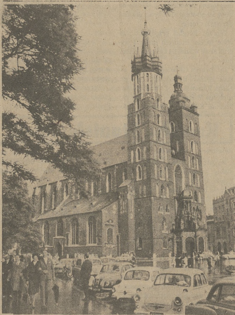
KRAKÓW. — Kościół Mariacki

Na froncie wewnętrznym pozycja Begin'a została ostatnio wzmocniona, gdy komitet parlamentarny odrzucił oskarżenia, że premier zdymisjonował szefa izraelskiej służby bezpieczeństwa, aby w ten sposób wstrzymać śledztwo w sprawie zamachów bombowych na dwóch arabskich mayorów miast w Przedjordanii.