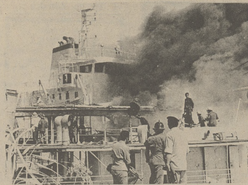
BASRA, IRAK. — Straż ogniowa gasi pożar na statku po nalocie bombowców irańskich na to portowe miasto w rejonie Shat-al Arab.