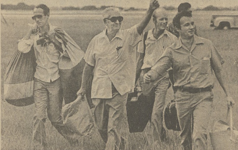
MIAMI. — Amerykanie zwolnieni z więzień kubańskich opuszczają teren lotniska Tamiami w Miami. W sumie 30 Amerykanów którzy więzieni byli na Kubie zostało zwolnionych na mocy amnestii.