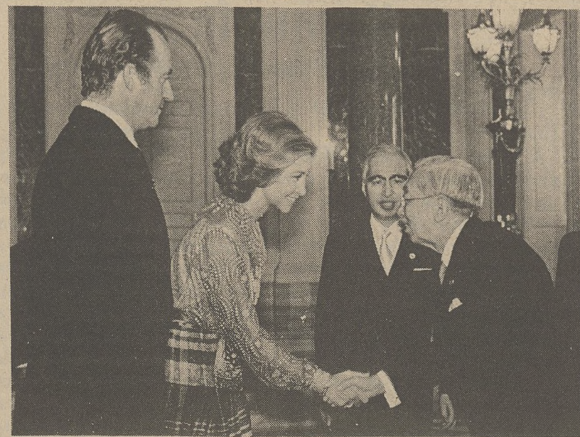
TOKIO. — Bawiąca z wizytą w Japonii hiszpańska para królewska przyjęta została przez cesarza Hirohito.

Tymczasem w mieście nadal obowiązuje "godzina policyjna" dla dzieci, trwają intensywne poszukiwania czterech porwanych i dotychczas nie odnalezionych ofiar tajemniczego zbrodniarza.