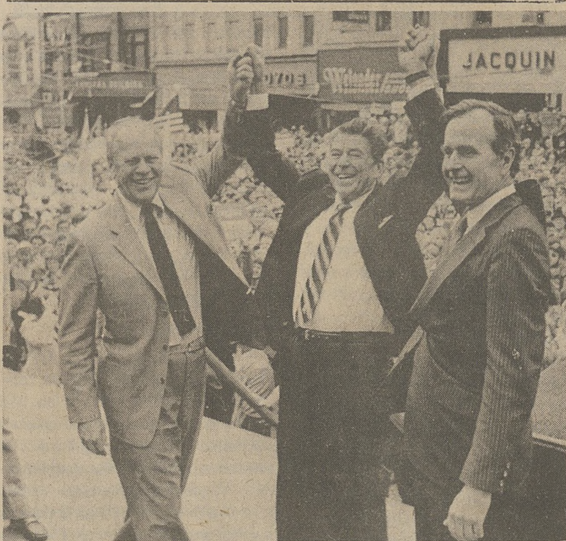
PEORIA, ILL. — W przeddzień wyborów spotkali się w Peorii, Ill.: były prezydent Gerald Ford, prezydent-elekt Ronald Reagan i wiceprezydent-elekt George Bush.