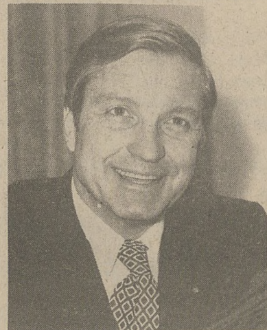
Sen. Charles H. Percy

Washington. (ST) — Przejście kontroli nad Senatem przez republikanów, po raz pierwszy od 1952 roku, przyniosło sen. Charles Percy (R.-Ill.) zgodnie z obowiązującym prawem starszeństwa możliwość objęcia stanowiska przewodniczącego