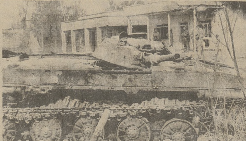
SHALMCHE. — Wojska irackie zajęły część pograniczną irańskiej prowincji Khuzistan prawie bez walki, ponieważ "obrońcy" masowo dezertowali przechodząc na stronę Iraku.

Kamera spoczywa wówczas na skrzyniach z kartkami wyborczymi tak, aby nikt nie mógł dopuścić się sfałszowania wyborów.