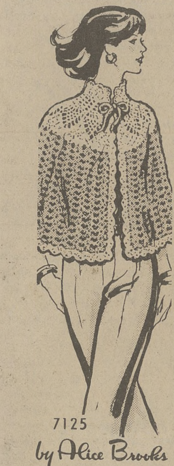
7125 by Alice Brooks

O Ile Nie Posiada Innej Umowy z DZIENNIKIEM ZWIĄZKOWYM