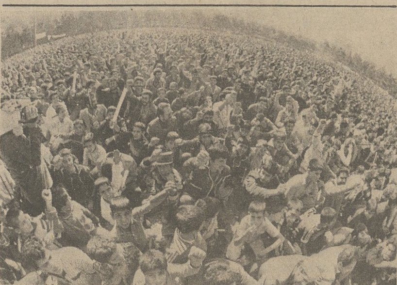
TEHERAN. — Setki tysięcy Irańczyków zgromadziło się na manifestacji w pierwszą rocznicę napadu na gmach ambasady amerykańskiej i wzięcia zakładników.

Christopher zaopatrzony w odpowiedź rządu US na żądania wysunięte przez Iran w zamian za uwolnienie zakładników, opuścił Washington o godz. 1 nad ranem. Treści odpowiedzi nie ujawniono.