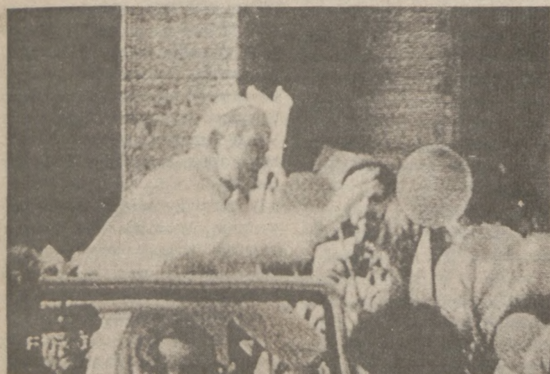
Ojciec Święty pozdrawia witających Go pielgrzymów na kilka sekund przed strzałami oddanymi przez zamachowca.