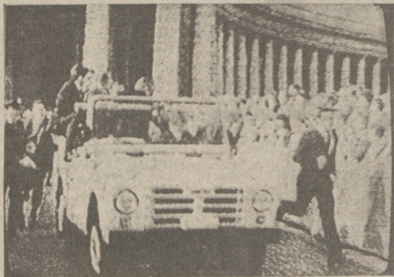
Samochód wiozący Ojca Świętego zwiększa szybkość, aby odwieźć rannego do najbliższego szpitala.