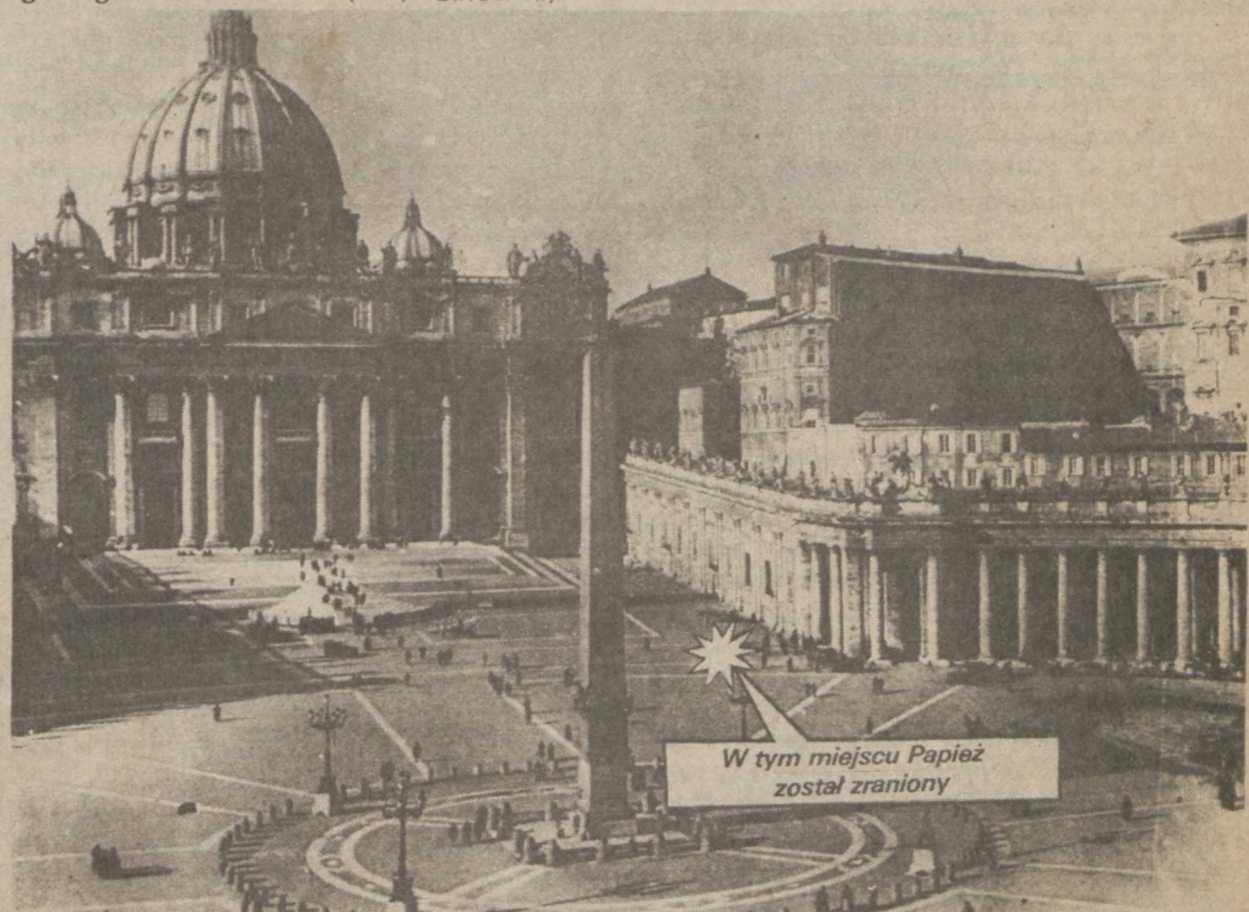
W tym miejscu Papież został zraniony