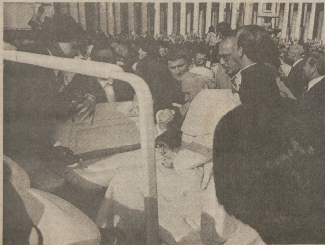
Papież Jan Paweł II pada, w odkrytym samochodzie, po otrzymaniu postrzałów.

(Z niedzielnego przemówienia Ojca Św. ze szpitala do wiernych na Placu Sw. Piotra).