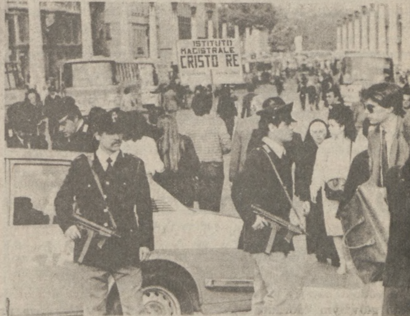
Policja wstrzymała ruch na Via della Concilazione i poddała kontroli samochody, natychmiast po zamachu na życie Ojca Świętego.