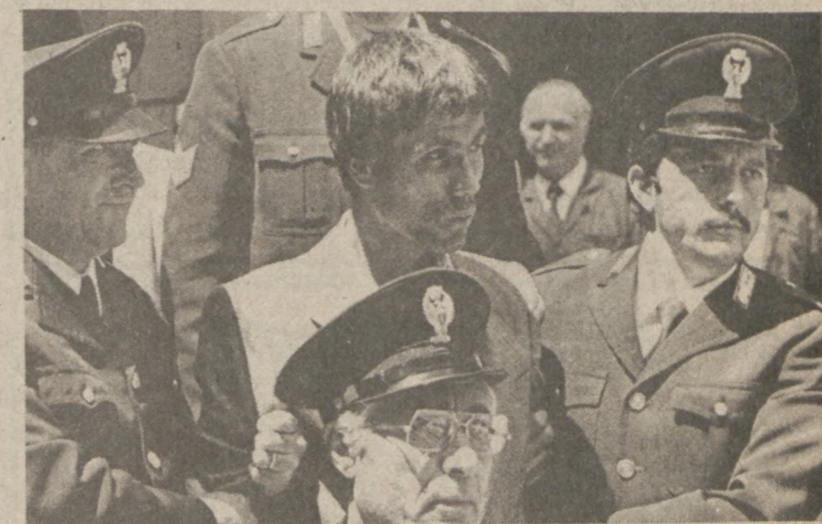
24-letni Turek, Mehmet Ali Agca, zamachowiec, który usiłował zastrzelić Ojca Świętego, prowadzony przez policjantów do więzienia rzymskiego Regina Coeli.

"Zjednoczony w Chrystusie, kapłan i ofiara, ofiarowuję moje cierpienia Kościołowi i światu... Modlę się za naszego brata, który strzelał we mnie, i któremu ja szczerze przebaczam... Jestem szczególnie blisko tych osób, które wraz ze mną zostały zranione..."