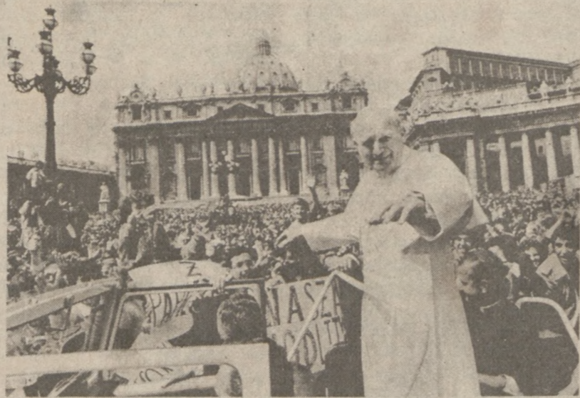
Ojciec Święty z serdecznym uśmiechem i ufnością zwraca się do witalującego tłumy, w chwilę przed dokonaniem na Niego zamachu.