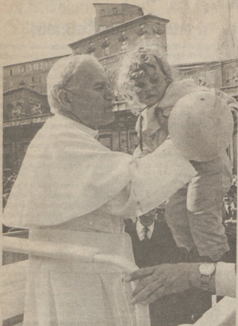
Jak co tydzień, w czasie śródowej audiencji generalnej, Ojciec Święty przejeżdżając przez plac św. Piotra, znalazł czas by wziąć w ramiona dziecko. W chwilę później do Namiestnika Chrystusowego zamachowiec oddał strzały.