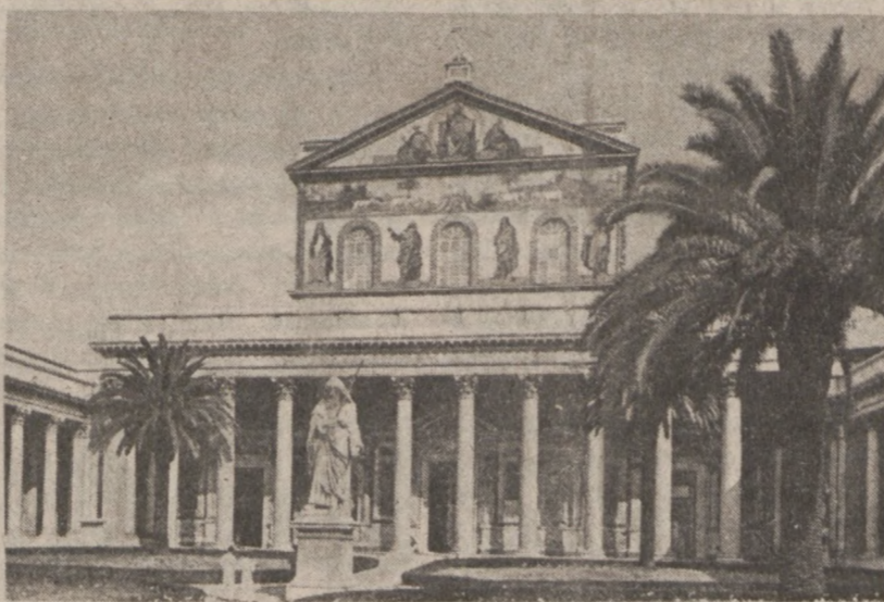
RZYM. — Bazylika Św. Pawła

Tokio. (UPI) — Sowiecka agencja prasowa TASS ostrzegła Japonię, aby nie dała sprowadzić się do roli "zakładnika" Pentagonu, dopuszczając amerykańskie okręty wojenne o uzbrojeniu nuklearnym do swoich portów.