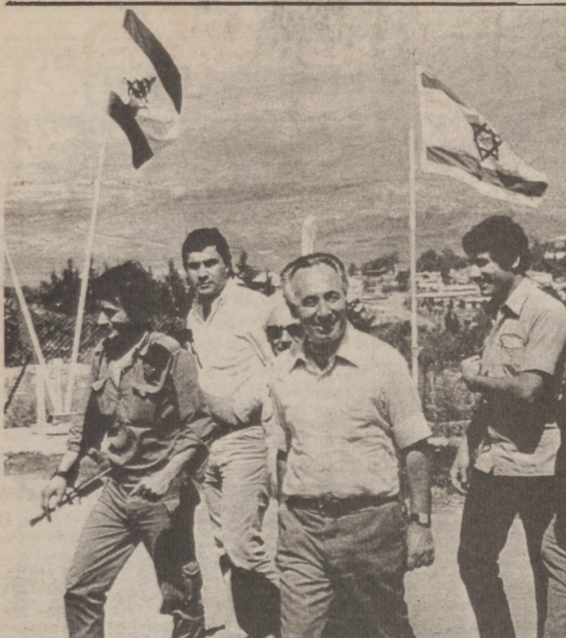
SHIMON PERES (w środku), przywódca opozycyjnej Partii Pracy, złożył wizytę w jednostkach stacjonowanych na granicy izraelsko-libańskiej.