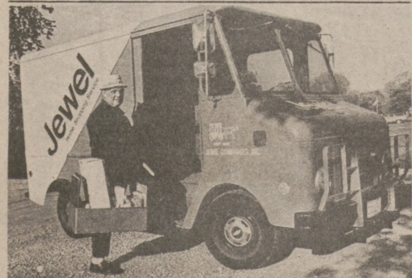
CHICAGO. — W ostatnim roku 19-go stulecia na ulicach Chicago pojawiły się pierwsze furgony konne dostarczające towary do domów klientów Jewel'a. Dziś używane są bardziej nowoczesne środki transportu.

Badania cen rynkowych za miesiąc kwiecień, wykazały podwyżkę cen na pięć gatunków wołowiny. Średnio wzrost ten wyniósł 7 centów na funcie