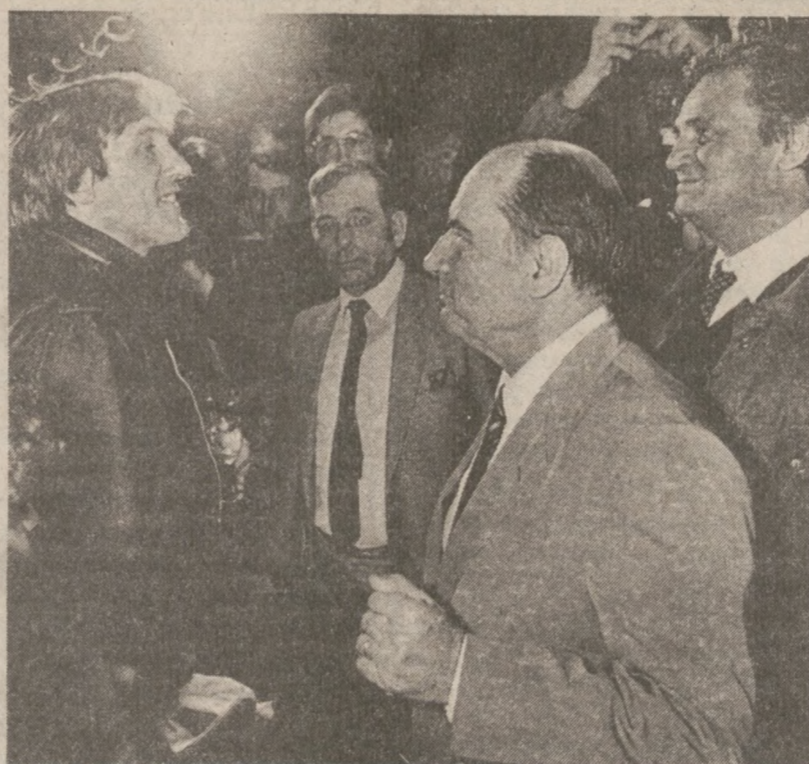
PARYŻ. — Zwycięzca w ostatnich wyborach prezydenckich we Francji, socjalista Francois Mitterand w rozmowie z wyborcami.

Mimo spadku spożycia narkomania i alkoholizm nastolatków ciągle stanowią główny problem krajowy.