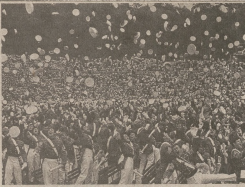
WEST POINT. — Kadeci Akademii Wojskowej w West Point wiwatują w czasie uroczystości graduacyjnej.