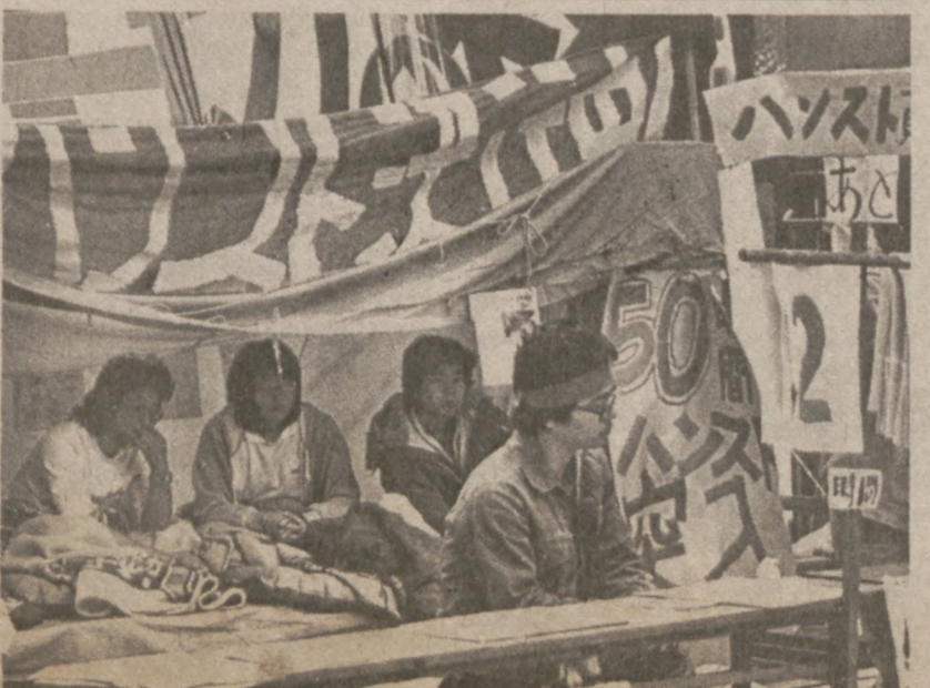
TOKIO. — Studenci Uniwersytetu Tokijskiego rozpoczęli strajk głodowy, protestując przeciwko obecności amerykańskich okrętów wojennych o napędzie nuklearnym na wodach japońskich.