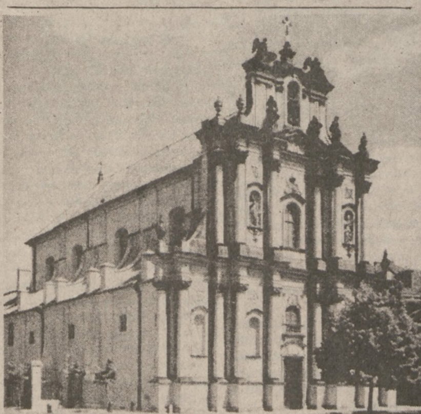
WARSZAWA. — Kościół pod wezwaniem św. Józefa, przy seminarium duchownym, gdzie spoczywała trumna ze zwłokami śp. Stefana Kardynała Wyszyńskiego, Prymasa Polski.

Demokraci żądają zmniejszenia podatków małżeńskich, podatków od darowizn i własności dziedzicznych oraz podatków od dochodów z oszczędności.