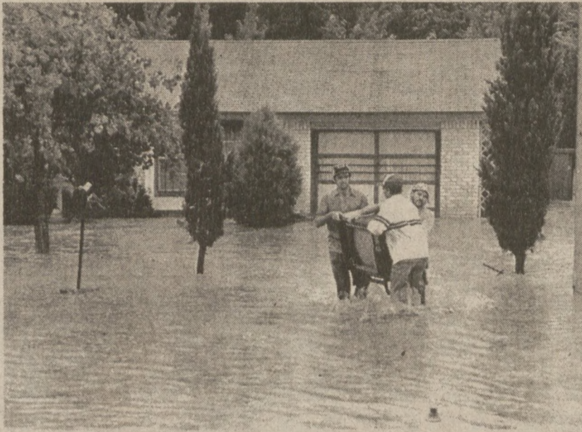
AUSTIN, TEKSAS. — Obfite opady deszczu spowodowały wystąpienie z brzegów wód rzeki Creek. Na zdjęciu mieszkańcy domu objętego powodzią wnoszą aparat telewizyjny.

Fakt, że wśród wybranych delegatów na kongres tylko bardzo niewielu komunistów ma przeszłość robotniczą, budzi zaniepokojenie. Dalszą komplikację w przygotowaniu kongresu stanowi tak zwany ruch struktur poziomych, który jest instrumentem do rozkładania partii i jest