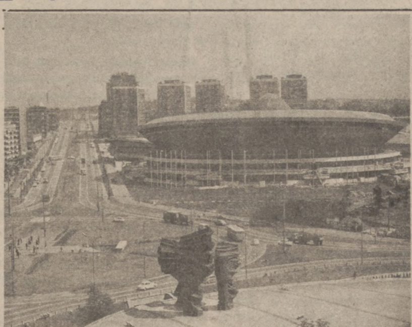
KATOWICE. — Słynny katowicki "Spodek" i pomnik Powstańców Śląskich.

Paryż (UPI) — Francuska Komisja Energii Atomowej zalicza do kategorii "wyspane z palca" twierdzenie izraelskie, że w zbombardowanych zakładach nuklearnych pod Bagdadem istniała w podziemiach tajna wytwórnia bomb nuklearnych.