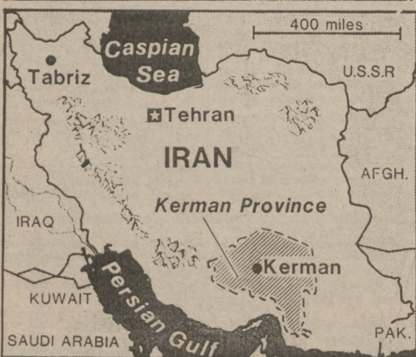
TEHERAN. — Ostatnie trzęsienie ziemi, którego epicentrum zanotowano w miejscowości Kerman w Iranie, pociągnęło za sobą ponad 3,000 ofiar śmiertelnych.