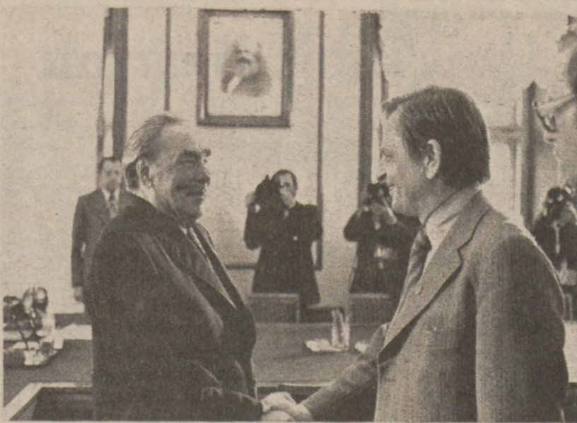
MOSKWA. — Leonid Breżniew wita przewodniczącego Szwedzkiej Partii Socjal-Demokratycznej Ulofa Palme, który bawił w wizytę w Moskwie.

"One są nam potrzebne, ale nie mogą reprezentować wpływowej linii w naszym związku" — powiedział przywódca "Solidarności".