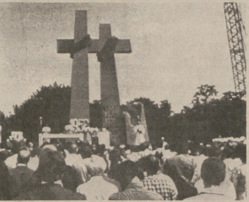
POZNAN. — Uroczystość odsłonięcia pomnika ku czci zabitych robotników w czasie Wypadków Poznańskich w roku 1956. (UPI)

Londyn (UPI) — Kurs dolara zapisał się dziś wysoką żyżyką, górując nad wszystkimi głównymi walutami. Cena złota w Londynie i w Zurichu wykazała tendencję spadkową w porównaniu z notowaniami piątkowymi.