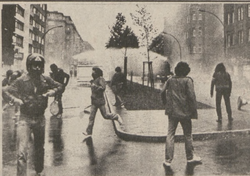
BERLIN. — Policja zachodniobrzeńska użyła armatek wodnych do rozpędzenia demonstrantów, protestujących przeciwko decyzji władz miejskich, eksmitowania z mieszkań “dzikich lokatorów”.