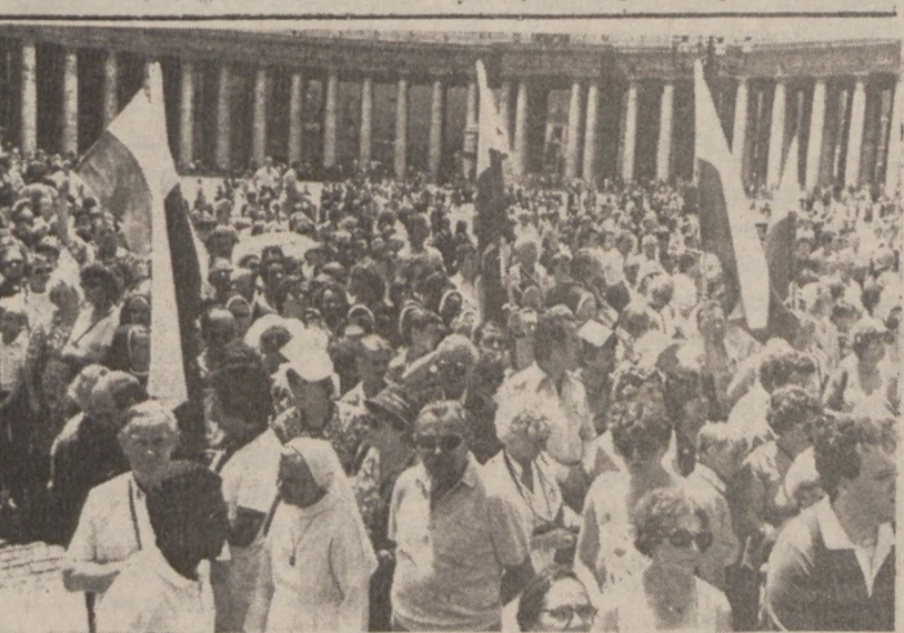
MIASTO WATYKAŃSKIE. — Pielgrzymi z Polski słuchają przemówienia Ojca Świętego, naganego w klinice rzymskiej, gdzie papież przechodzi wirusowe zapalenie optyczne.

W San Quentin przebywa 1.000 morderców. Ostatnio władze penitencjarnie zostały zaszokowane żądaniem dania im takich samych praw jak reszcie populacji więziennej, a więc dostępu do telefonów, szkoleniowych programów telewizyjnych, wizyt małżeńskich, ćwiczeń rekreacyjnych na świeżym powietrzu, kąpiel pod prysznicami 3 razy tygodniowo i wtyczek do uszu, eliminujących hałas z zewnątrz. Zmiany takie kosztowałyby $20 mln. W rezultacie doszło do wzrostu kontaktów między najbardziej niebezpiecznymi więźniami, co z kolei mogłoby doprowadzić do rozrostu groźnych kontraband i ruchów na terenie więzienia, pod przywództwem groźnych, pozbawionych skrupułów bandytów.