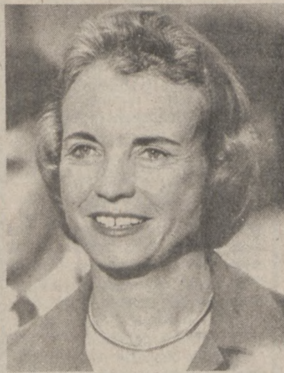
Sędzia Sandra O'Connor