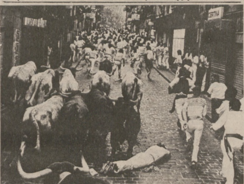
PAMPLONA, HISPANIA. — Tradycyjna gonitwa z bykami przez ulice miasta odbywa się w miesiącu lipca.