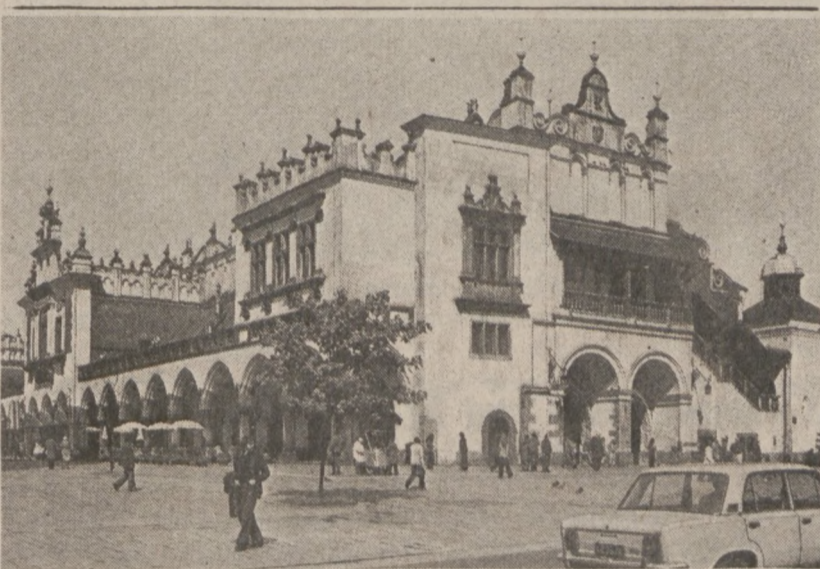
KRAKÓW. — Rynek Główny, Sukiennice.

Niezależnie od tego komu ostatecznie masło zostanie sprzedane, USA stracą na transakcji, zmuszone do pobrania niższych cen, zgodnych z cenami na rynkach światowych.