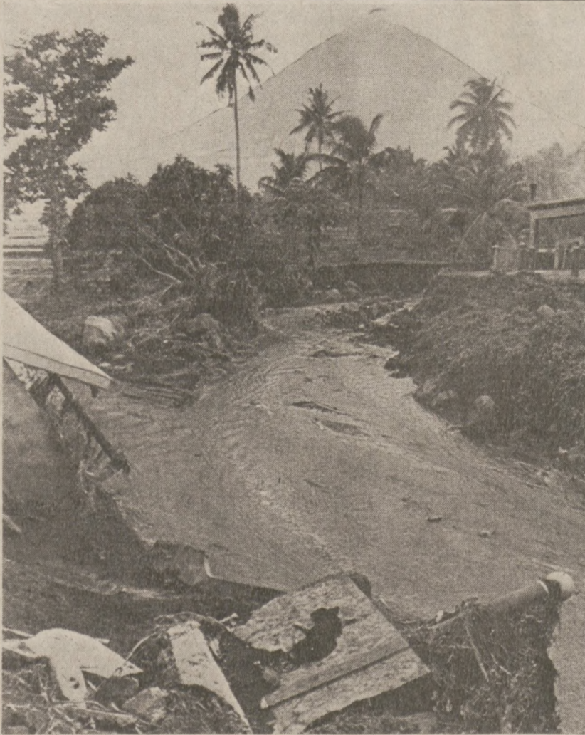
LEGASPI CITY, FILIPINY — Burza tropikalna, jaka przeszła nad terenem u podnóża wulkanu, pochłonęła 120 ofiar śmiertelnych.