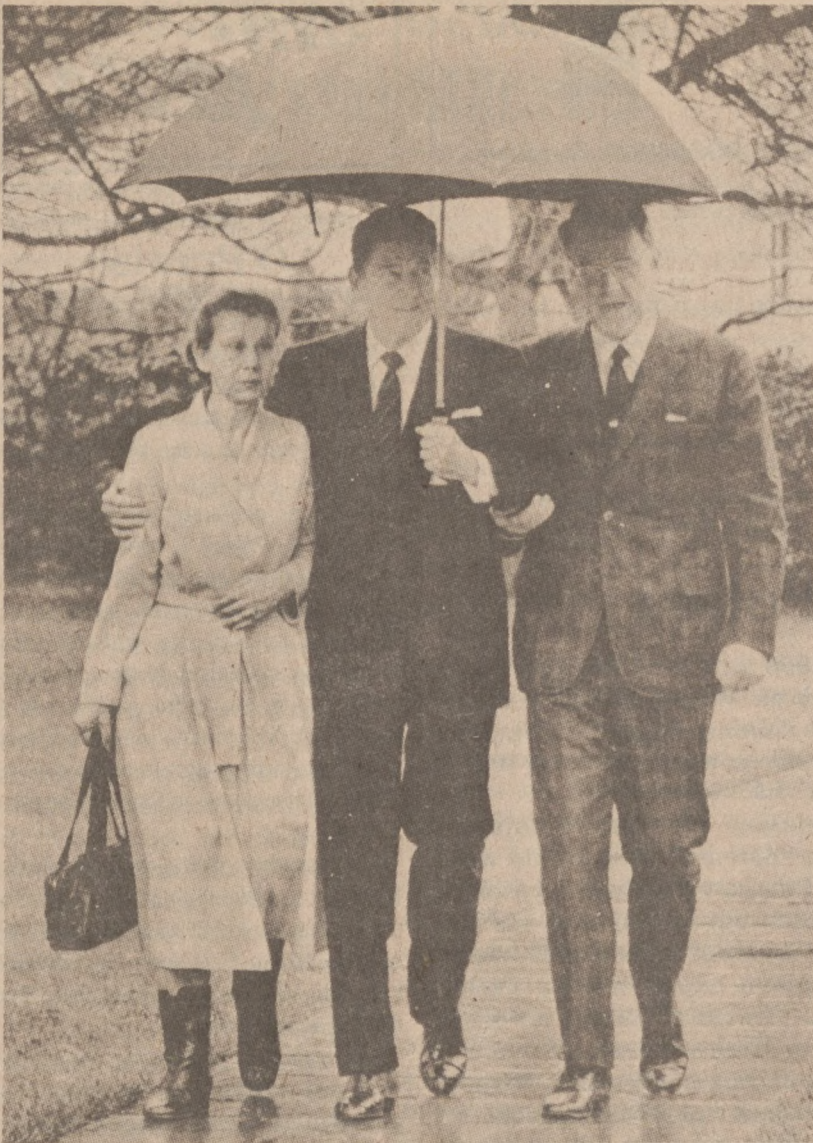
WASHINGTON. — Prezydent Ronald Reagan odprowadza państwa Spasowskich do samochodu, po spotkaniu, jakie miało miejsce w Białym Domu 22 grudnia br.