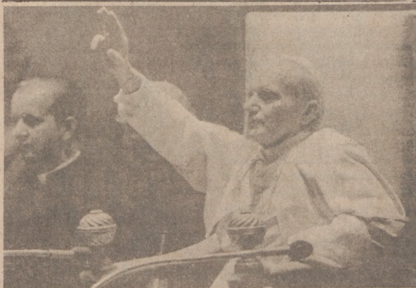
MIASTO WATYKAŃSKIE. — Papież Jan Paweł II przemawia do zgromadzonych pielgrzymów w czasie generalnej audycji.

Pekin — Propaganda chińska ogłosiła, że Chiny nie boją się osamotnienia w konfrontacji ze Związkiem Sowieckim i że nie zawahają się poświęcić dobrych stosunków ze Stanami Zjednoczonymi, jeżeli broń amerykańska docierać będzie do Tajwanu. Sprzedaż amerykańskiej broni Chinom Narodowym Pekin uważa za mieszanie się w wewnętrzne sprawy chińskie.