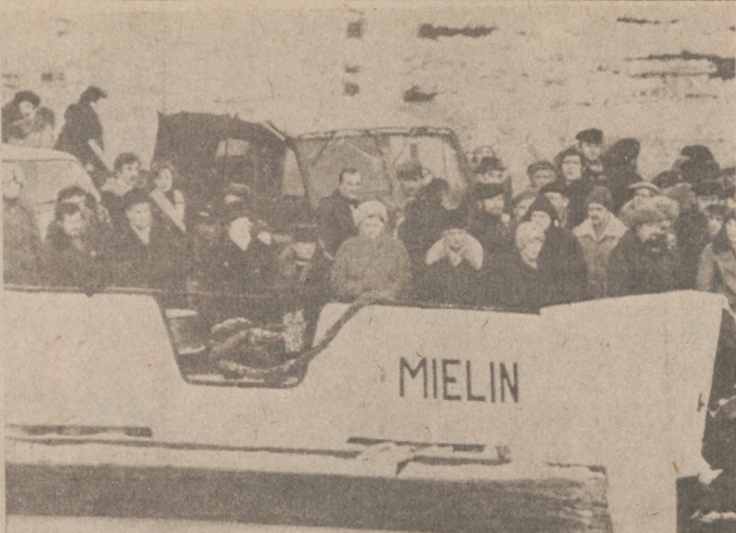
ŚWINOUJŚCIE. — Prom odpływający do Szwecji 15 grudnia bież. roku. (UPI)

INDEPENDENCE, MO. — Prezydent Reagan polecił, aby nadwyżki sera, które zmagazynowane są na terenie całego kraju, zostały przekazane ubogim. Na zdjęciu ser, który znajduje się w podziemnych magazynach niedaleko Kansas City. (UPI)