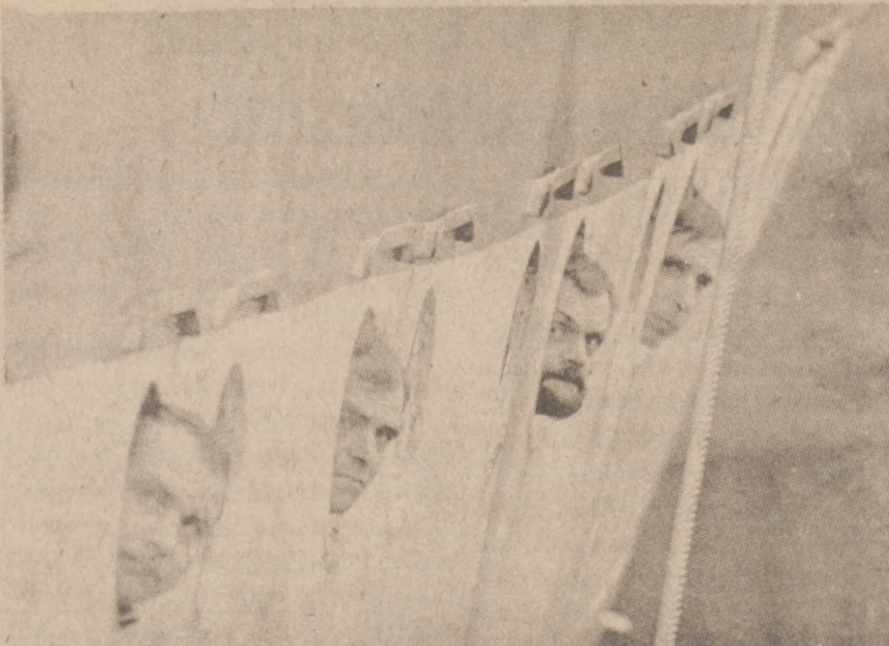
VANCOUVER, KANADA. — Marynarze polskiego kutra rybackiego "Regulus", patrzą przez okna kajut. Wielu z nich poprosiło władze kanadyjskie o prawo azylu.

Przystań ta znajdowałaby się kilka bloków na zachód, gdzie rzeki łączą się z Calumet Sag Channel.