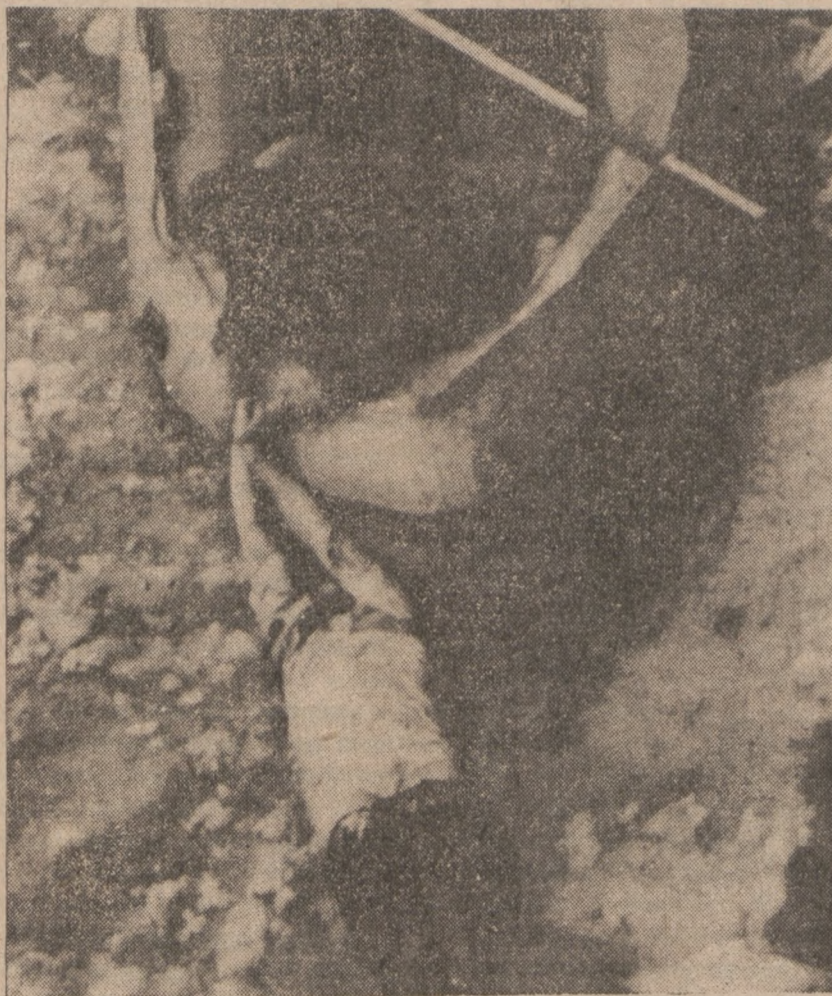
WASHINGTON. — Ekipy Ratownicze wyciągają z wody ciała jednej z ofiar katastrofy lotniczej.

Shamir oświadczył wczoraj w Jerozolimie, iż Izrael osiągnął ostateczną granicę w dziedzinie wyrażania ustępek w sprawie autonomii Palestyny. Nowe, usilne próby, podjęte w sprawie wyprowadzenia z długiego impasu rozmów w sprawie autonomii Palestyny, polegają b.d. na. na przesłuchaniu przez Waszyngton różnic działających obie strony oraz wysunięciu propozycji, które doprowadziłyby do wyeliminowania punktów spornych.