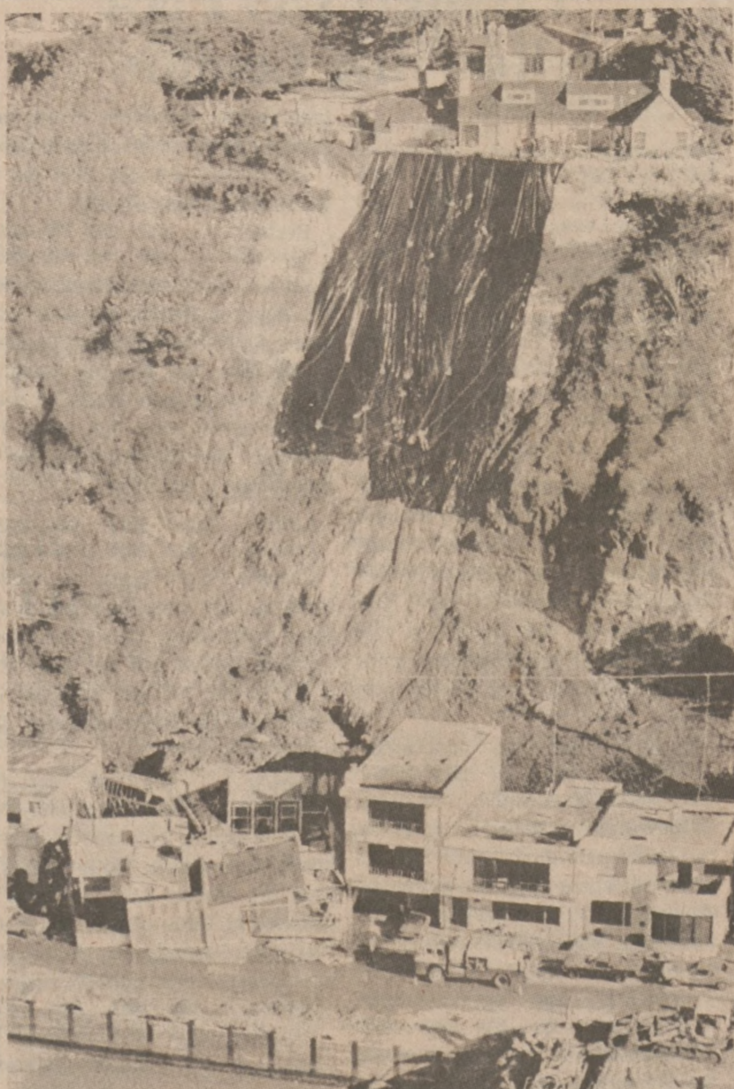
RIO DEL MAR, KALIFORNIA. — Zdjęcie zniszczeń jakie spowodowały ulewę w Kalifornii. (UPI)

Małżeństwo zostało aresztowane za posiadanie broni oraz narkotyków. Zeznawali oni, że broni którą posiadają, pożyczili od handlarzy narkotyków. W mieszkaniu ich znaleziono skradzionemu rzeczy za sumę około $100,000.