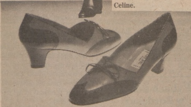
Poniżej sportowe czółenka, połączenie dwóch kolorów: szarego z czarnym. Obydwie propozycje francuskiej projektantki mody Celine.