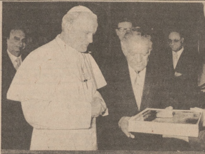
MIASTO WATYKAŃSKIE. — 7 grudnia złożył wizytę Ojcu Świętemu minister spraw zagranicznych Izraela Jitzhak Shamir. Ojciec Święty wręczył gościowi podarunek. Nie ujawniono szczegółów prywatnej rozmowy Ojca Świętego z Shamirem.

Wyrok w sprawie obu strażaków zostanie ogłoszony 8 lutego. Każdemu z oskarżonych grozi kara więzienia do 7 lat.