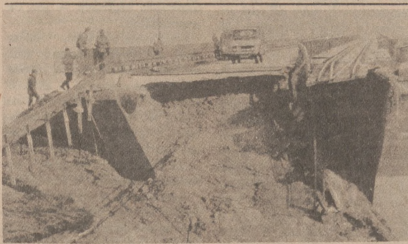
PŁOCK. — Oddział saperów sprawdza most, który został uszkodzony na skutek wylania Wisły. Tysiące mieszkańców zostało pozbawionych dachu nad głową.

Władze sądzą, iż w akcji porwania wzięło udział około 12 terrorystów.