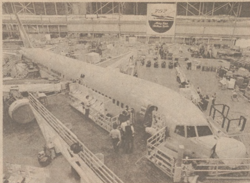
RENTON, WASH. — Pierwszy samolot typu Boeing 757 przechodzi ostatnią kontrolę, tuż przed przekazaniem go do malowania. Prace przy konstrukcji tego samolotu zostaną zakończone już w tych dniach a lot próbny przewidziany jest na luty.