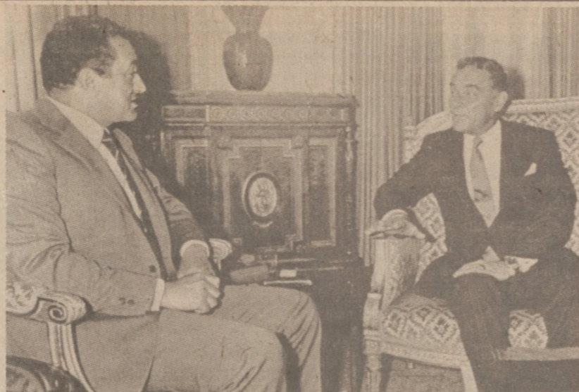
KAIR. — Prezydent Egiptu Hosni Mubarak w rozmowie z Sekretarzem Stanu U.S. Alexandrem Haig'iem.

New Zealand became the 24th World Cup finalist when they defeated China 2-1, in a playoff game in Singapore last week.