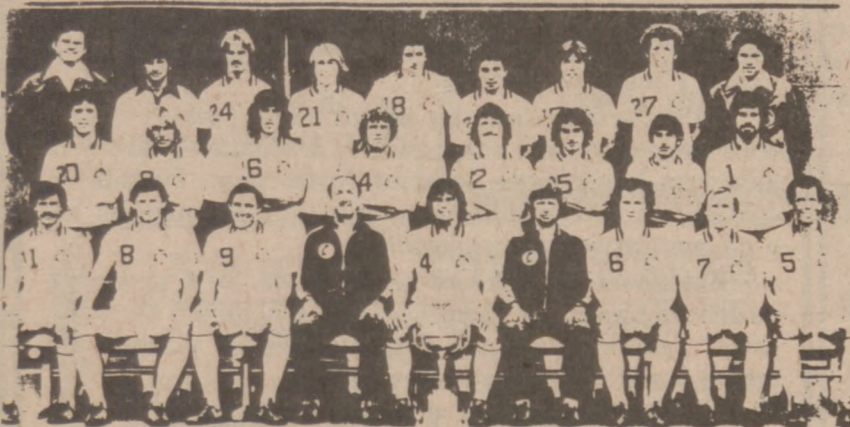
NEW YORK COSMOS — jedna z najsilniejszych drużyn piłkarskich na terenie Stanów Zjednoczonych, która również uzyskała wiele sukcesów na terenie międzynarodowym. Rozegra już w tę sobotę w hali Chicago Stadium mecz piłkarski z Chicago Sting. Mecze rozpocznie się o godzinie 1:30 po południu.

The game between the Sting and Cosmos will take place Saturday, January 23, 1:30 p.m. at the Chicago Stadium.