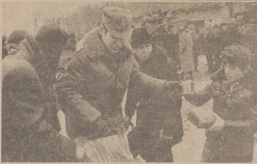
PŁOCK — W jednej ze wsi w okolicach Płocka, żołnierze rozdają żywność ludności, która straciła domy na skutek powodzi. Zdjęcie z 14 stycznia br.

Decyzja kardynała stawia proboszczy w trudnej sytuacji. Trzeba w tym względzie mieć więcej wyrozumiałości. Kościół katolicki w Chicago będzie z tego powodu jedną katolicką diecezją na 90 istniejących w całym kraju, w której jako zarządzenie wej-dzie plan podniesienia dochodu przez sprzedaż oficjalnego tygodnika. W naszym stanie w latach 1976 do 1982 ilość sprzedawanych tygodników katolickich zwiększyła się z 70.000 do 170.000 egzemplarzy.