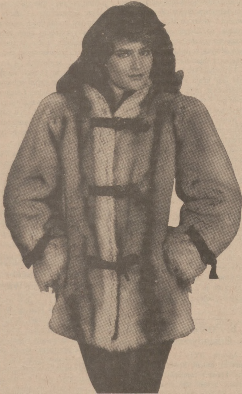
Sportowa kurtka z syntetycznego futra produkcji francuskiej (imitacja wilków) z kolekcji Chloe de Bruneton nie różni się wiele od kurtki z prawdziwych wilków — chyba, że ceną? ...