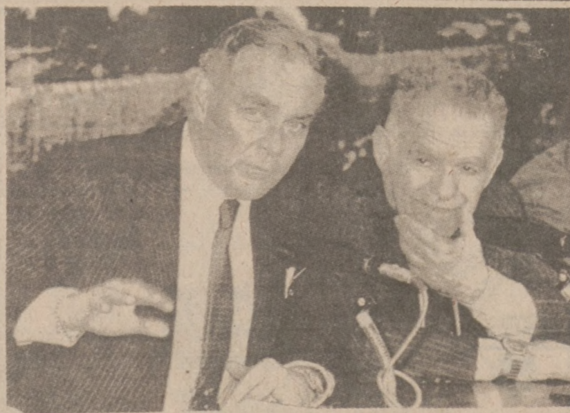
LOTNISKO BEN-GURION, IZRAEL — Sekretarz stanu U.S. Alexander Haig i minister spraw zagranicznych Izraela Yitzhak Shamir, w czasie konferencji prasowej, na której podsumowano dwudniowy pobyt sekr. Haig'a w Izraelu.