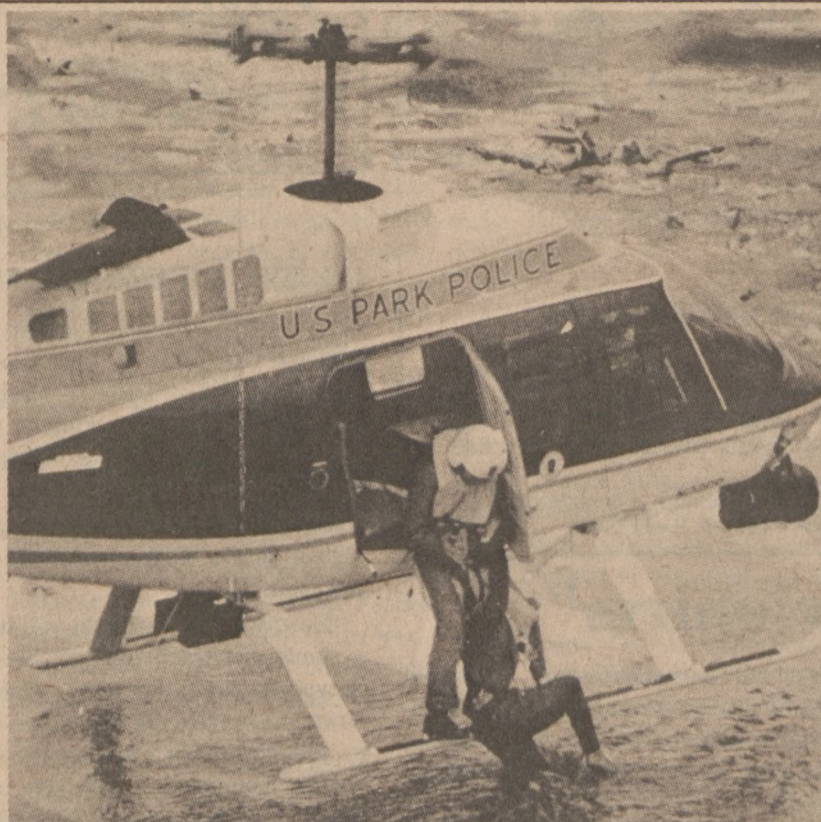
WASHINGTON — Członek załogi helikoptera pomaga ofierze katastrofy samolotowej — wyciągając ją z lodowatej wody.