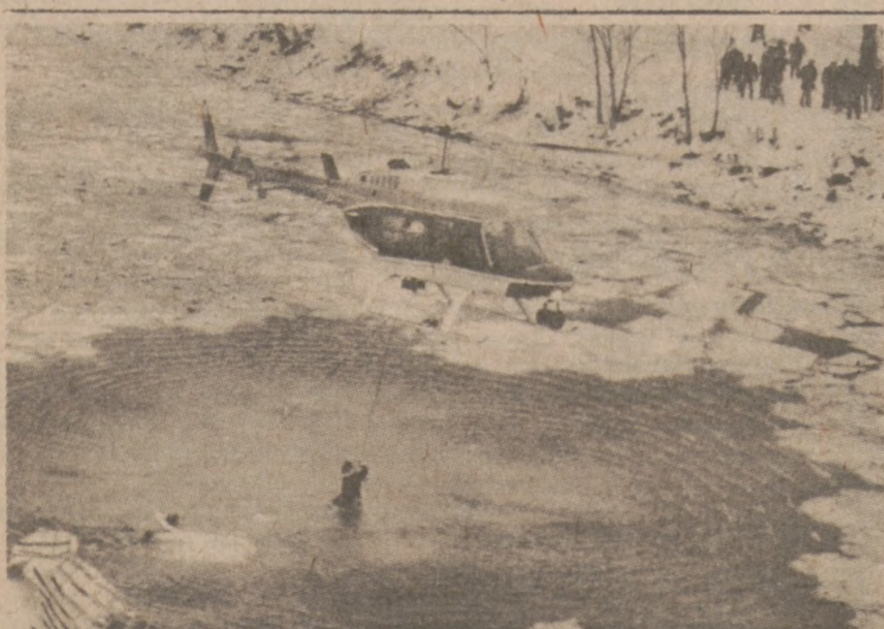
WASHINGTON — Do akcji ratowniczej — wyciągania ofiar katastrofy lotniczej, użyto helikopterów. Za pomocą lin, wciągano na pokład śmigłowca ludzi z rzeki Potomac.

Rejestracja wyborców prowadzona była przy współpracy wielu grup obywatelskich, które uświadamiały swych członków o obywatelskim obowiązku i przywileju — jakim jest prawo głosu. Podobno najwięcej zarejestrowano obywateli dzięki akcji organizacji murzyńskiej PUSH.