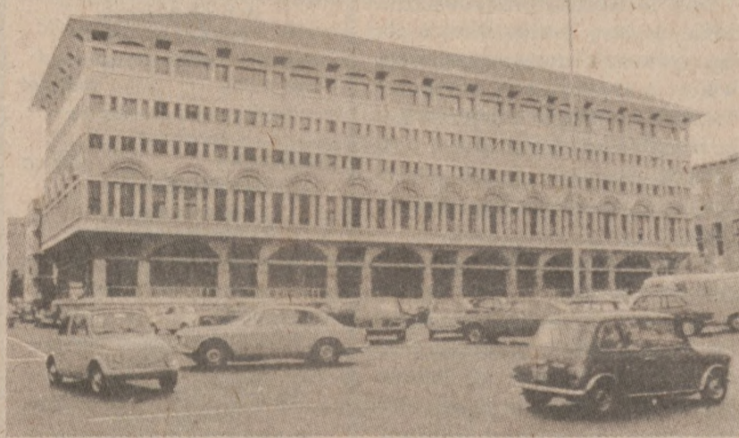
RZYM. — Budynek w którym znajdują się biura Chrześcijańskiej Partii Demokratycznej. Z doniesień prasy włoskiej wiadomo, że terroryści "Czerwonych Brygad" mieli zamiar wysadzić ten budynek w powietrze w czasie trwania tam konferencji czolowych polityków włoskich. (UPI)

Narody Zjednoczone (UPI) — Stany Zjednoczone zawetowały ujętą w zglaszonym tonie rezolucję Rady Bezpieczeństwa Narodów Zjednoczonych, przedłożoną w związku z planowanym nałożeniem na Izrael sankcji — za przyłączenie terenów Wyżyny Golan.