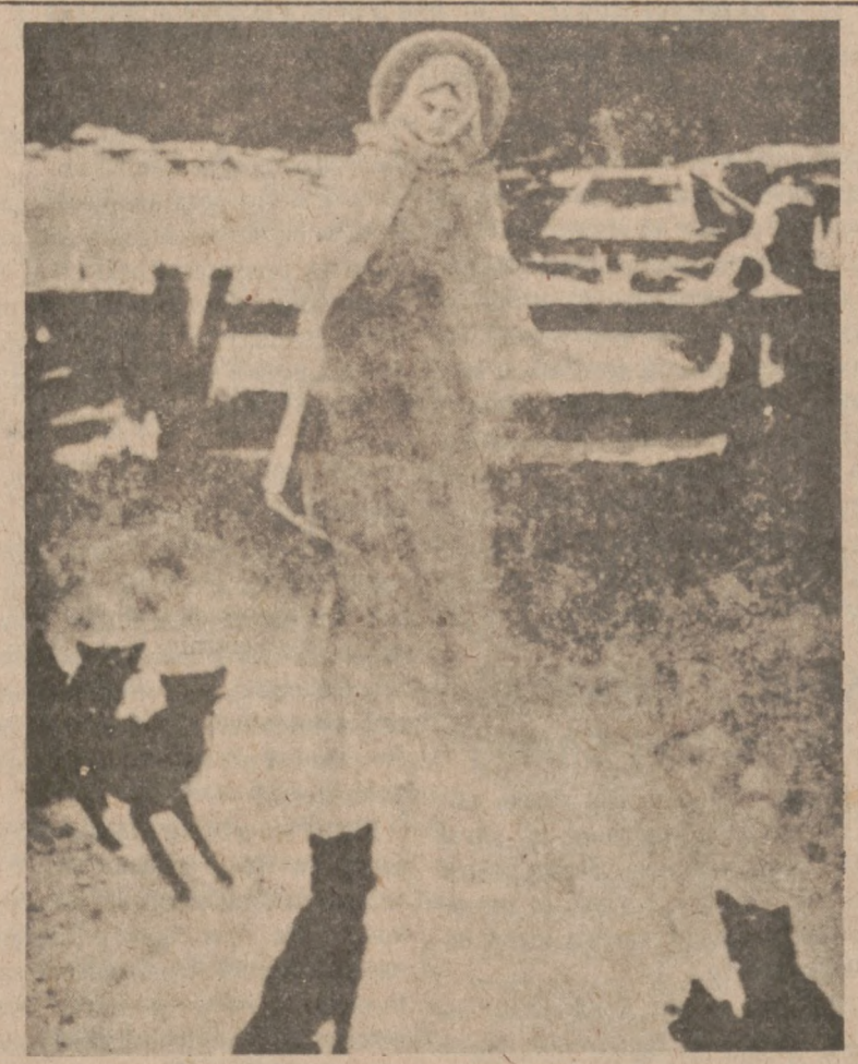
MATKA BOSKA GROMNICZNA — obraz Piotra Stachiewicza

W południowej części stanu Michigan, ze względu na złe warunki atmosferyczne 150 okręgów szkolnych zamknęło szkoły.