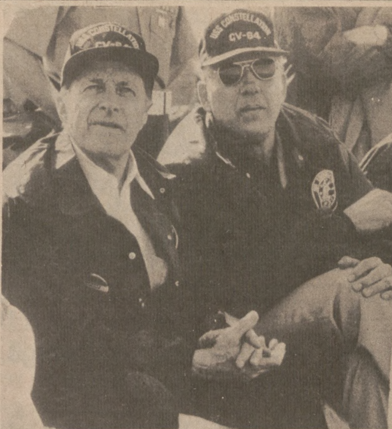
LOTNISKOWIEC USS CONSTELLATION. — Sekretarz Obrony Caspar Weinberger z komendantem lotniskowca USS Constellation na pokładzie statku na Oceanie Indyjskim.

Garcia z raną postrzałową brzucha znajduje się w szpitalu. Postrzelił się, chcąc, aby opowiadanie jego o napadzie rabunkowym miało większe prawdopodobieństwo.