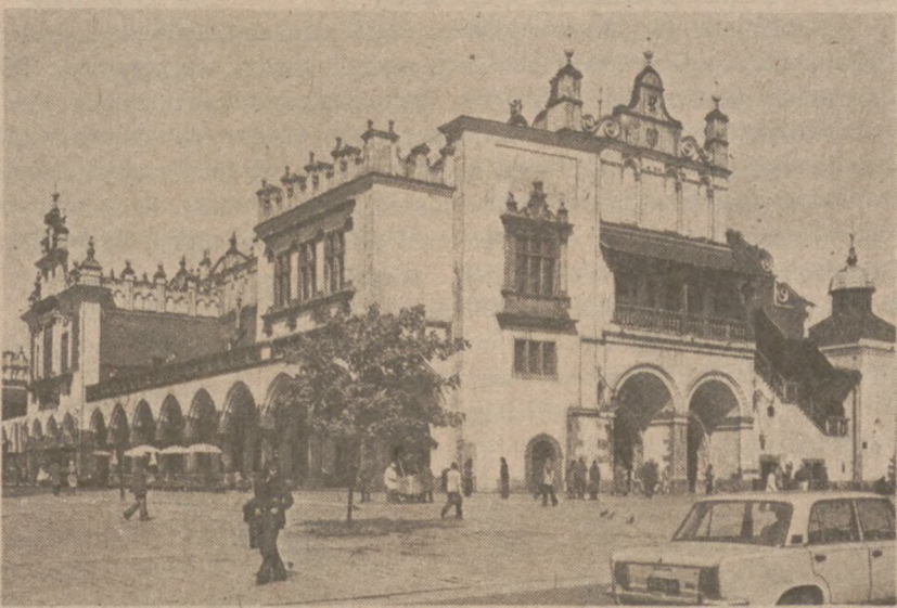
KRAKÓW. — Rynek Główny, Sukiennice.

Przedstawiciele rządu twierdzą, że w całym Salwadorze trwają zamieszki, a więc nie może być mowy o bezpiecznych miejscach. Dlatego właśnie słychać głosy o jak najdalej idącym zabezpieczeniu amerykańskiego personelu.