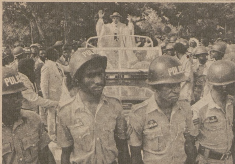
IBADAN, NIGERIA. — Ojciec Święty w otwartym samochodzie pozdrawia witające Go tłumy.

Przypominamy, że dawcą krwi może być każda osoba powyżej 17 lat, która waży przynajmniej 110 funtów i jest w dobrym zdrowiu.