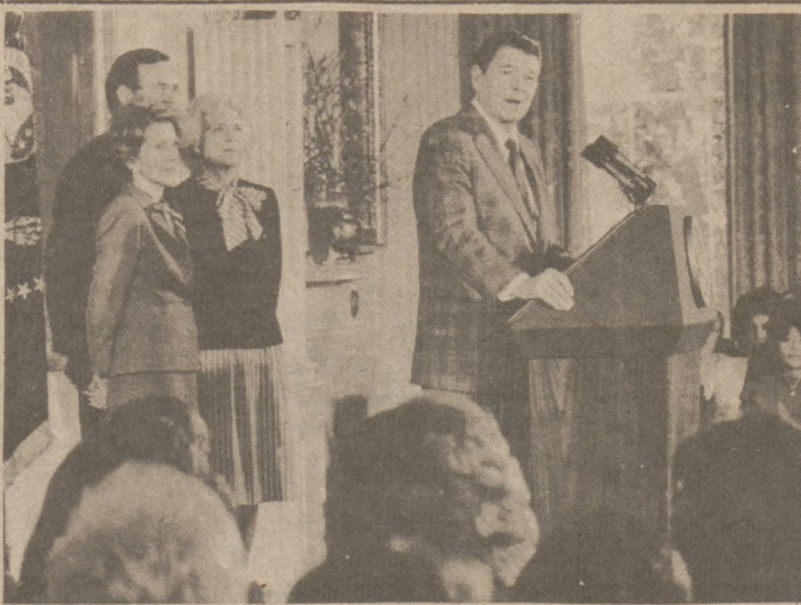
WASHINGTON. — Prezydent Reagan przemawia do grupy 250 kobiet na spotkaniu w Białym Domu. Przemówieniu przysłuchują się: Nancy Reagan, wiceprezydent George Bush z żoną Barbara.

Wiele akcjonariuszy wyraziło swoją złość, ponieważ Harvester rozdzielił sumę 6 milionów dolarów pomiędzy 3,300 zarządców w styczniu, niedługo po tym, kiedy kompania ogłosiła swoje straty w wysokości $635.7 miliona za rok fiskalny 1981.