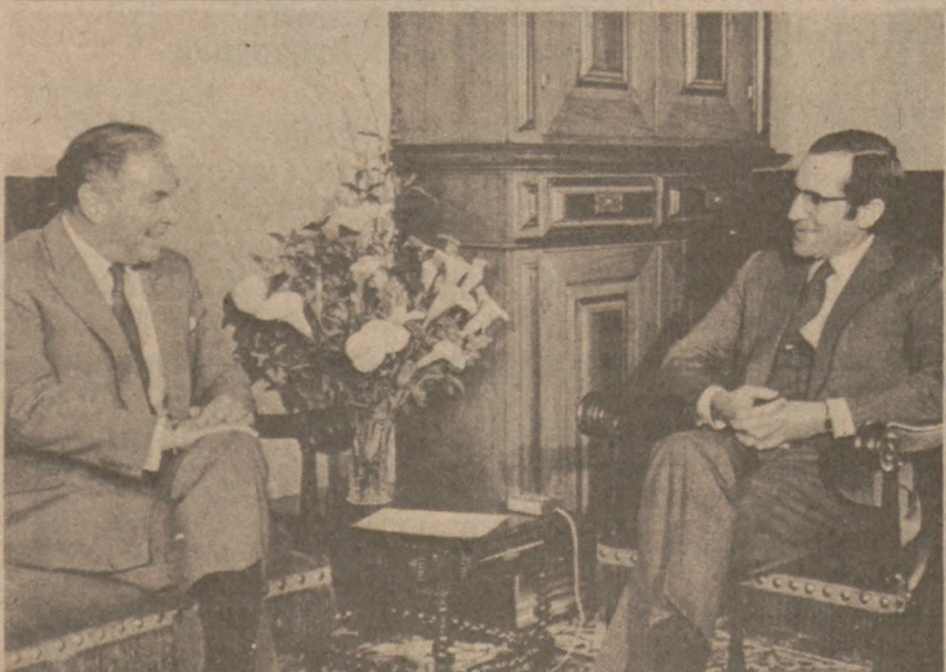
LIZBONA, PORTUGALIA. — Prezydent Portugalii Antonio Ramalho Eanes spotkał się z Sekretarzem Stanu Alexandrem Haig, który przebywał w Portugalii z oficjalną wizytą.

Zwłoki mężczyzny znalezione w samochodzie, który był wywieziony z miejsca, które było objęte zakazem parkowania. Zwłoki znajdowały się na tylnym siedzeniu samochodu. Sekcja zwłok wykazała, że przyczyną śmierci. Córka mężczyzny, sugerowała zaraz po otrzymaniu zawiadomienia dla ojca, że jego auto zostało wywiezione, aby sprawdzono czy w samochodzie nie znajdują się jego zwłoki. Kiedy auto wywieziono, drzwi były zamknięte, a szyby zasłane śniegiem i nikt nie przypuszczał, że ktoś może znajdować się wewnątrz samochodu.