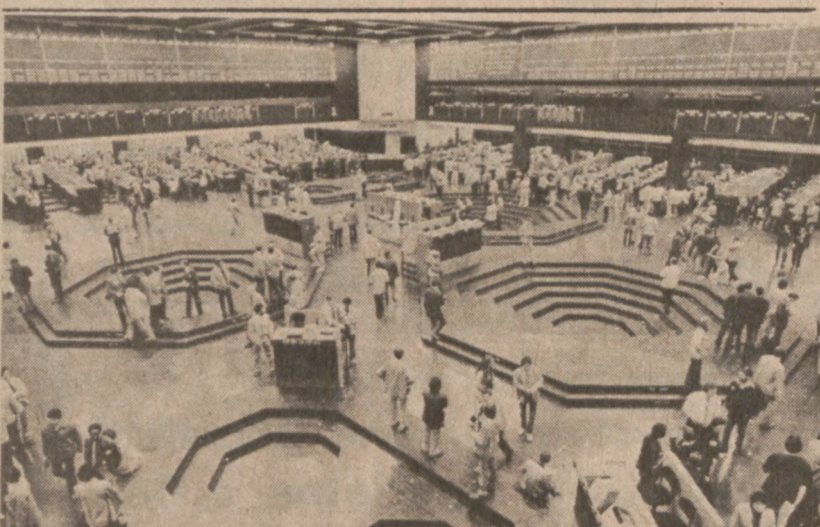
CHICAGO. — Zdjęcie nowej sali niedawno otwartego centrum giełdowego "Chicago Board of Trade".

Wtedy dopiero stwierdziła, że była ona w rodzaju "świnki doświadczalnej". Wywarło to wielki wpływ na jej psychikę. Wpadła w rozpacz i gniew zarazem. Wszystkie trzy kobiety występujące ze skargą do sądu mają córki i wszystkie trzy mają podstawę, aby martwić się o ich zdrowie i o to, czy w przyszłości będą w ogóle mogły mieć dzieci. Jak też istnieje obawa o ich własne zdrowie. Kobiety domagają się odszkodowania w wysokości 2.2 miliona dolarów.