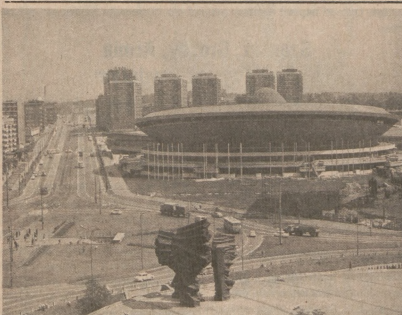
KATOWICE. — Słynny katowicki "Spodek" i pomnik Powstańców Śląskich.

Władze poinformowały, iż moment otwarcia konsulatów wzbudził się przypuszczenie w czasie zakończenia akcji wycofania wojsk Izraela z Półwyspy Synaj.