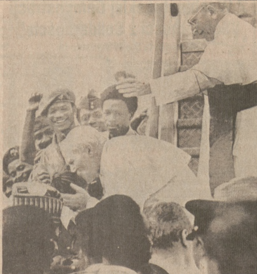
LAGOS, NIGERIA. — Ojciec Święty nachyla się, aby ucałować główkę dziecka nigeryjskiego.

W poniedziałek znaleziono zwłoki ośmiu chłopów, z miejscowości San Cristobal Verapaz, porwanych 5 dni temu przez niezidentyfikowanych osobników. W stolicy Gwatemali inni rebelianci zabili 4 zastępców mayorę w restauracji na zachodniej stronie miasta.