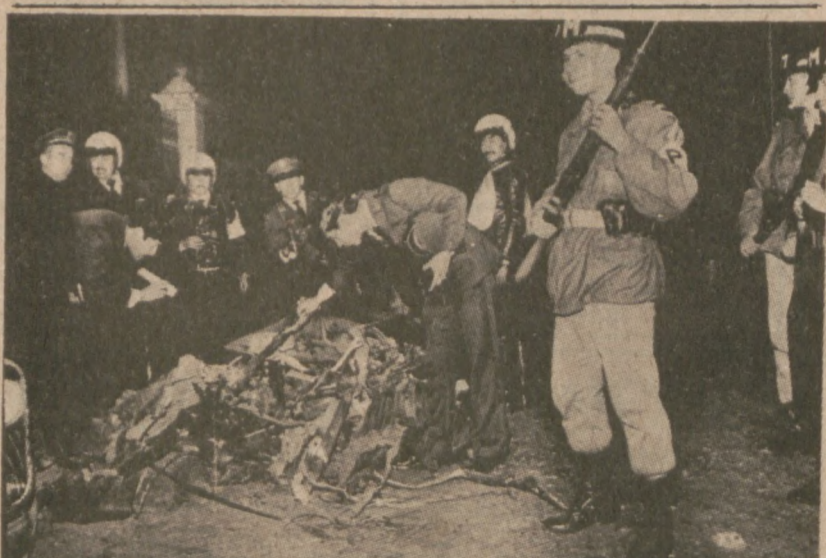
BOGOTA, KOLUMBIA. — Policja i wojsko przy wraku samochodu, który eksplodował 10 marca, w pobliżu pałacu prezydenckiego. Do samochodu, lewicowcy z grupy M-19, podłożyli 66 funtów dynamitu. Jedna z pięciu osób, które odniosły obrażenia podczas wybuchu, zmarła następnego dnia.

Trzy osoby zgłosiły się w środę do pogotowia ratunkowego w południowej stronie miasta, z objawami zatrucia. Szpital zaalarmował straż pożarną, aby udała się na inspekcję domu, gdzie te osoby prawdopodobnie zatruty były. Zabrano z tego budynku kilka innych osób do szpitala, również z objawami zatrucia. Okazało się, że urządzenie ogrzewnicze jest zepsute i wszystkie osoby uległy zatruczeniu.