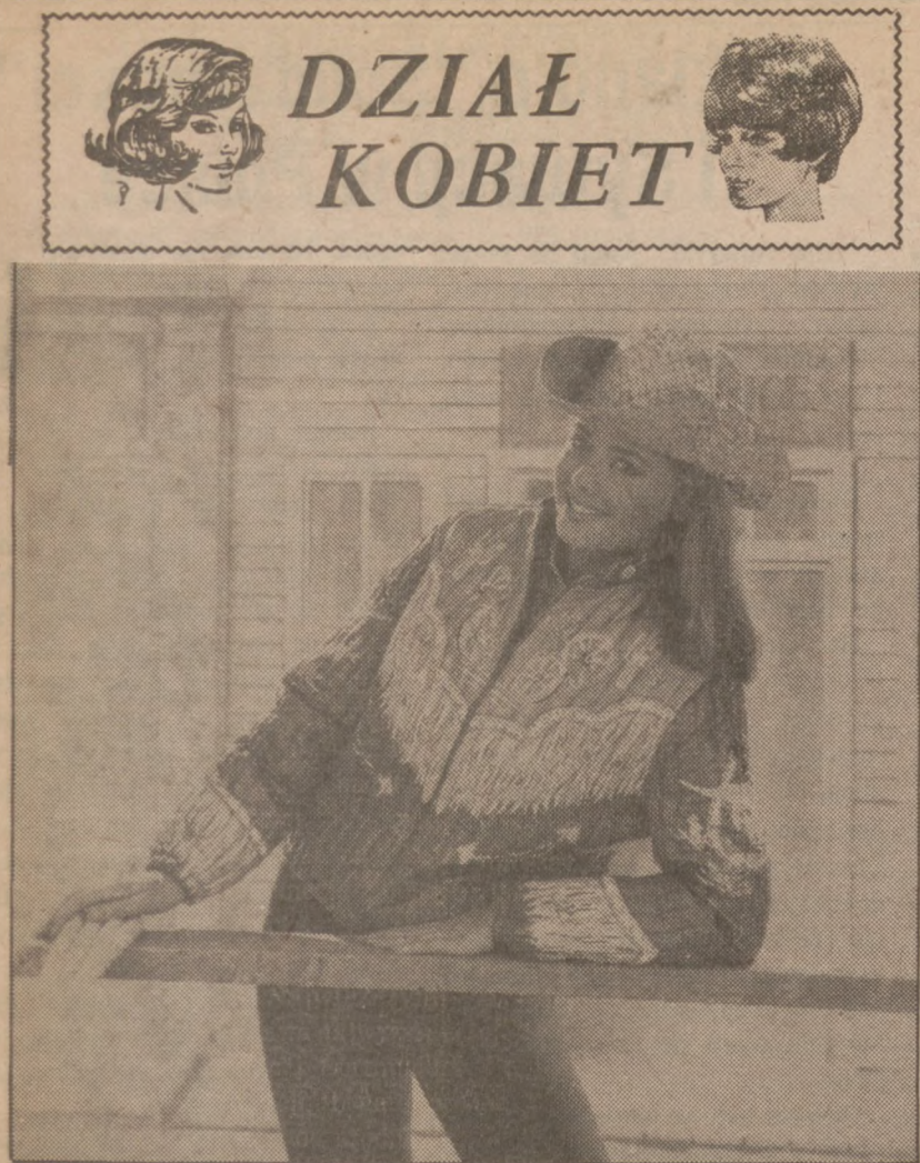
Kowbojska kurtka z wodoodpornego materiału o oryginalnym, kolorowym wzorze noszona z džinsami; doskonały ubiór dla nastolatków na nadchodzącą wiosnę.