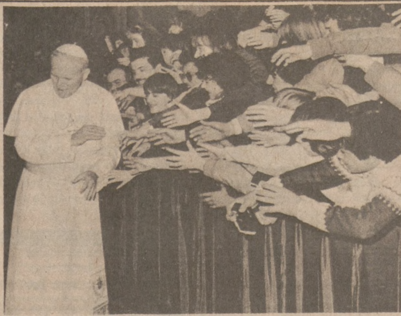
MIASTO WATYKAŃSKIE. — Papież Jan Paweł II w czasie jednej z swych cotygodniowych audiencji generalnych.

W myśl prawa Illinois biuro prokuratora stanowego nie może wykorzystać próbek charakteru pisma przeciw podejrzany o naruszenie porządku publicznego, może natomiast użyć ich jeśli zostanie wniesione oskarżenie o przestępstwo. Po oświadczeniu sędziego zarówno Schellenberg, jak i Kissinger dali po 26 próbek swojego pisma w biurze prokuratora stanowego.