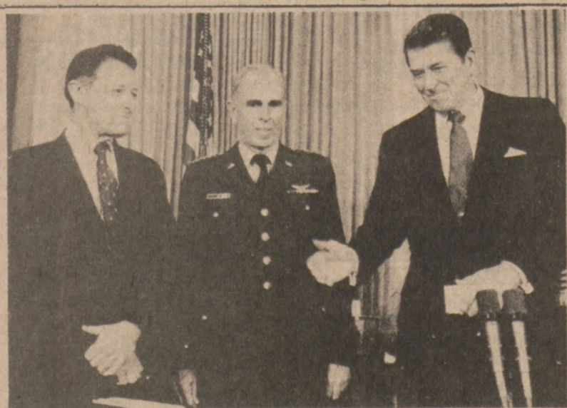
WASHINGTON. — Prezydent Ronald Reagan w czasie spotkania w "Oval Office" z sekretarzem obrony Casparem Weinbergerem (po lewej) i generałem Armii Johnem Vessey.