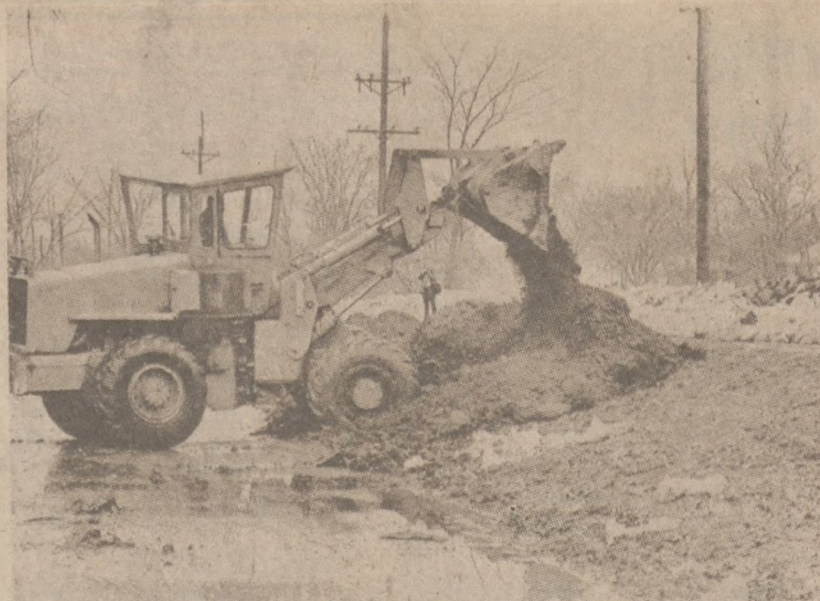
FORT WAYNE, IND. — Praca przy wznoszeniu wałów ochronnych przed wodami występującymi z brzegów okolicznych rzek.

Planowana na kwiecień podwyżka była dość problematyczna, jeśli chodzi o gospodarkę RTA, ponieważ zdawano sobie sprawę, że mayor Byrne nie pozwoliła na podniesienie opłat za przejazd transportem CTA. Skoro więc RTA podniosłaby opłaty, mieszkańcy przedmieść byłoby poważnie poszkodowani. Podwyżka groziła również utratą znacznej liczby pasażerów, którym nie opłacałoby się korzystać z transportu publicznego.