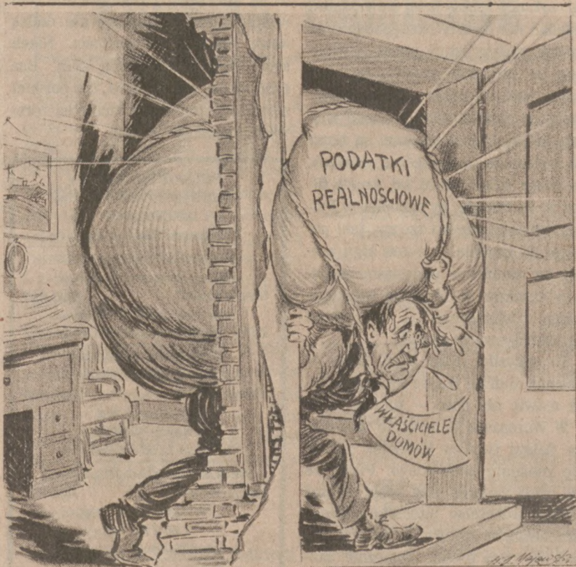
Rysunek Kazimierza Majewskiego, który ukazał się po raz pierwszy 30 marca 1950 r. nie stracił na aktualności.

Umowa dotycząca eksploatacji otwartych złóż węglowych w prowincji Shanxi. Na mocy tej umowy kompania Hammera zainwestuje w tych złóżach 250 milionów dolarów w pierwszej tylko fazie. Spodziewane jest, że do 1985 roku wydobycie węgla z tych złóż dojdzie do 15 milionów ton rocznie.