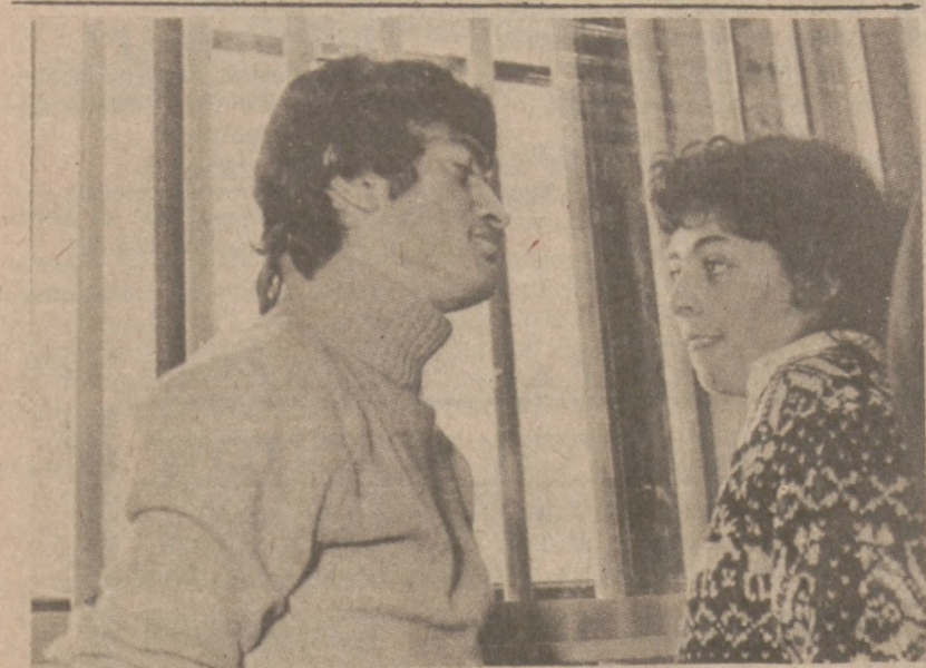
WERONA, WŁOCHY. — Terrorysty włoscy, członkowie Czerwonych Brygad, w specjalnej klatce kuloodpornej, w czasie rozprawy, jaka toczy się przeciw nim w związku z porwaniem generała U.S. Jamesa L. Doziera.