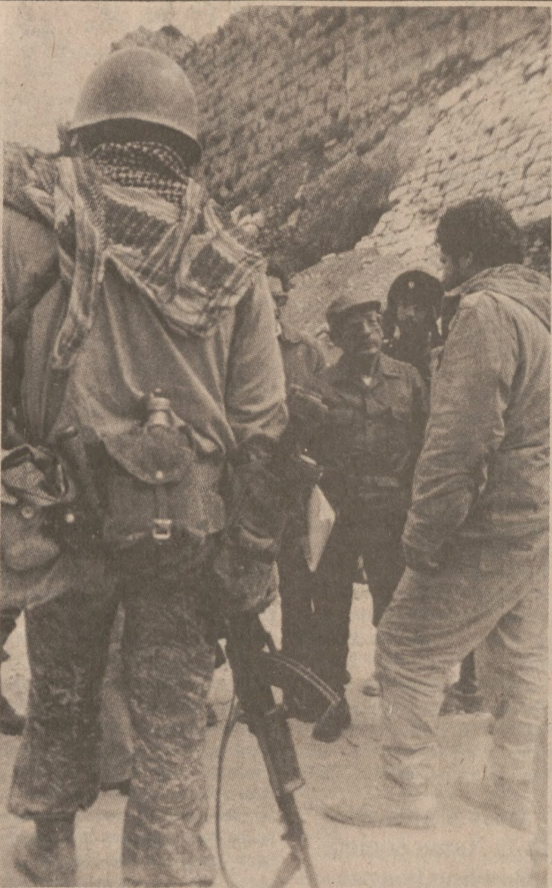
BEJRUT. — Szef rebeliantów salvadorskich Cayetano Carpio złożył wizytę organizacji Palestine Liberation. Wizyta ta była utrzymywana w ścisłej tajemnicy. Miał miejsce 17 marca br. (UPI)

Sen. Hatfield zwrócił uwagę na fakt, że tamta bomba atomowa była w porównaniu do dzisiejszej broni nuklearnej, "prymitywną zabawką".