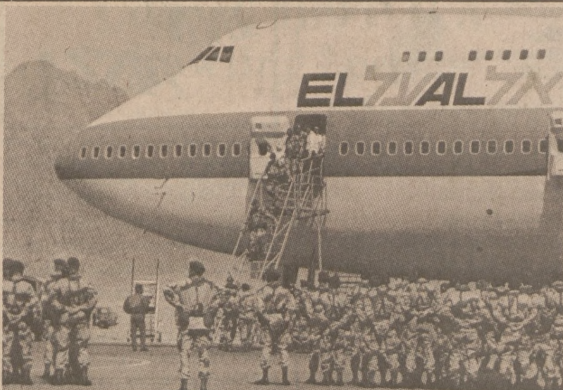
SHARM EL-SHEIKH. — Amerykańscy spadochroniarze z 82nd Airborne wysiadają z samolotu. Będą oni częścią Multinational Force and Observers na obszarze Synaju.