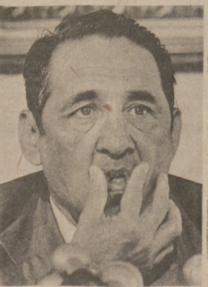
SALWADOR. — Prezydent Salvadora Jose Napoleon Duarte, w czasie konferencji prasowej.