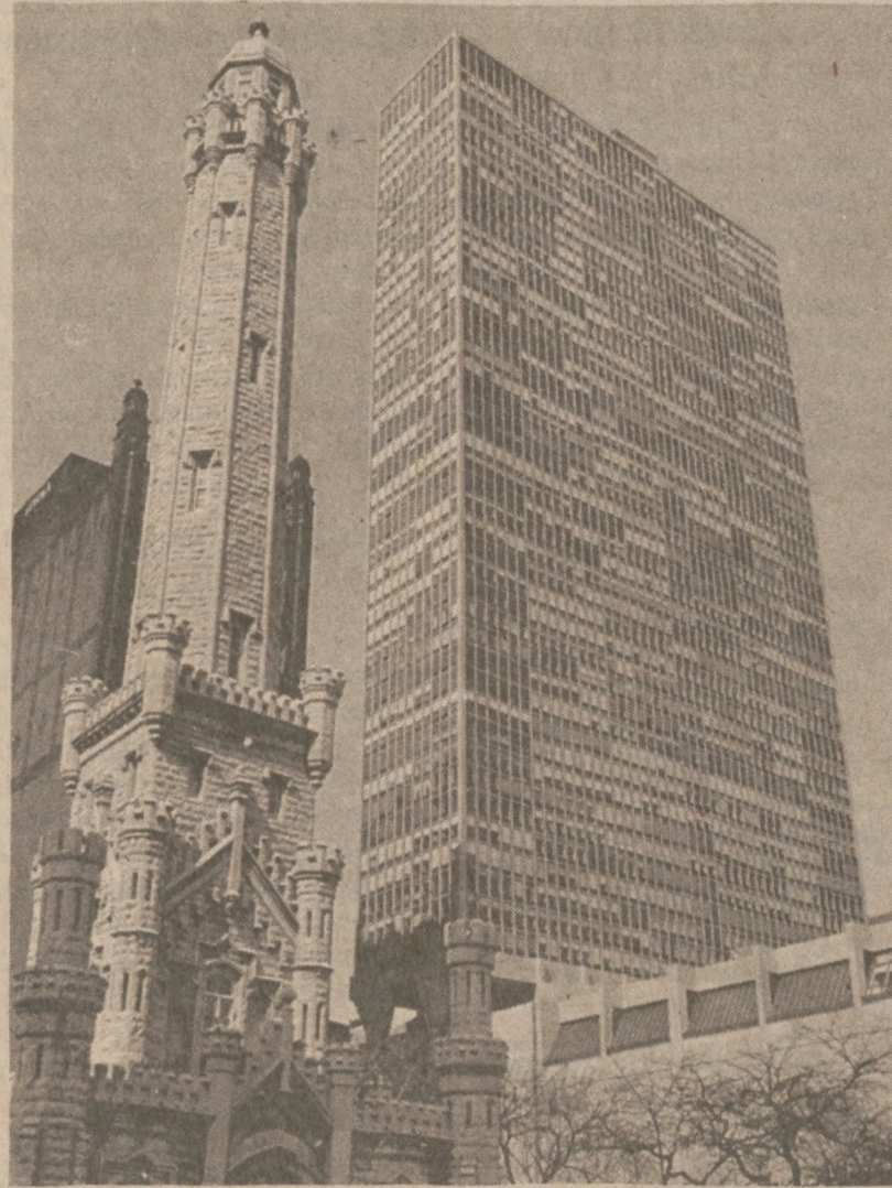
CHICAGO. — Budynek w pobliżu Water Tower, w którym obecnie mieszka mayor J. Byrne.

Jak wspomnieliśmy, przewiduje się, że naprawy trwać będą całe lato. Zamknięte odcinki autostrad mają zostać otwarte dla ruchu kołowego 1 sierpnia, natomiast wszystkie prace naprawcze powinny zostać zakończone nie później jak do 5 października br.