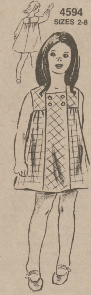
by Anne Adams

FREE-FLOATING LINES with high, gathered yokes at either side of the front — this is one of summer's freshest dresses. Sew it with/without sleeves in gingham checks or flowery voile. Printed Pattern 4594: Child's Sizes 2, 4, 6, 8. Size 6 takes 1 3/4 yards 45-inch fabric. $2.25 for each pattern. Add 50¢ for each pattern for postage and handling. Send to: