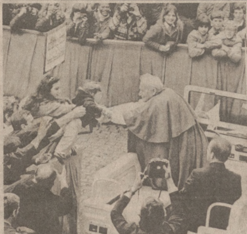
MIASTO WATYKAŃSKIE. — Ojciec Święty Jan Paweł II w czasie audiencji generalnej, jaka odbyła się 14 kwietnia. Papież spóźnił się na audiencję, ponieważ na skutek złych warunków atmosferycznych helikopter wiozący Go z Castel Gandolfo musiał lądować na lotnisku wojskowym.

Statek nosi nazwę Salut 7 i krąży wokół ziemi w odległości od 136 do 172 mil od jej powierzchni.