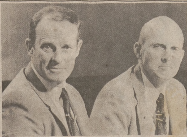
OŚRODEK LOTÓW KOSMICZNYCH, HUSTON. — Astronauci Jack Lusma (L) i C. Gordon Fullerton, którzy niedawno odbyli podróż wahadłowcem "Columbia" w czasie swej pierwszej oficjalnej konferencji prasowej, jaka odbyła się 13 kwietnia br.