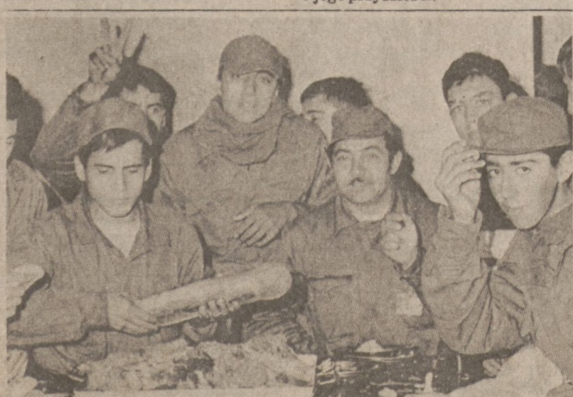
FALKLANDY. — Grupa argentyńskich żołnierzy stacjonujących na Falklandach w czasie tradycyjnego posiłku wielkanocnego.