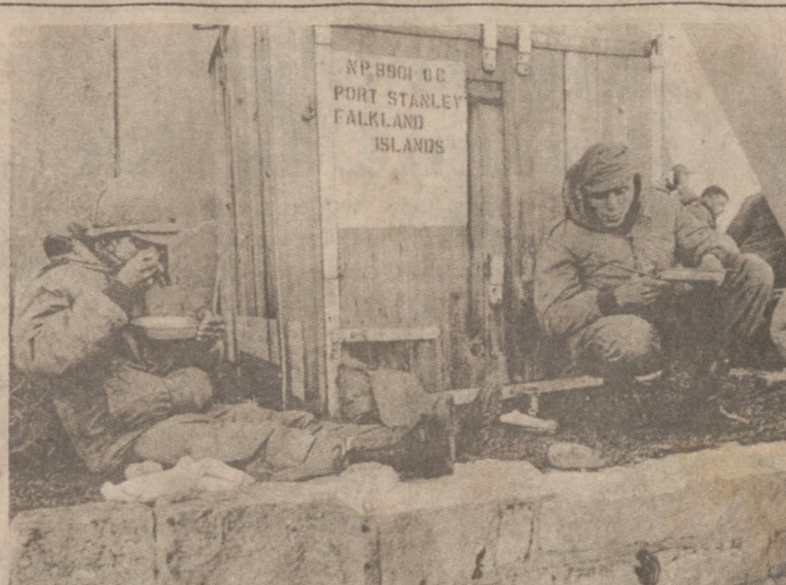
PORT STANLEY, FALKLANDY. — Żołnierze argentyńscy spożywają posiłek będąc w porcie falklandzkim.

Przedstawiciel władz izraelskich powiedział, że pisemne zapewnienia dotyczące autonomii Palestyńczyków, mogłyby być złożone w postaci listu podpisanego przez prezydenta Egiptu Hosni Mubaraką, skierowanego do premiera Begina, bądź też w innej formie.