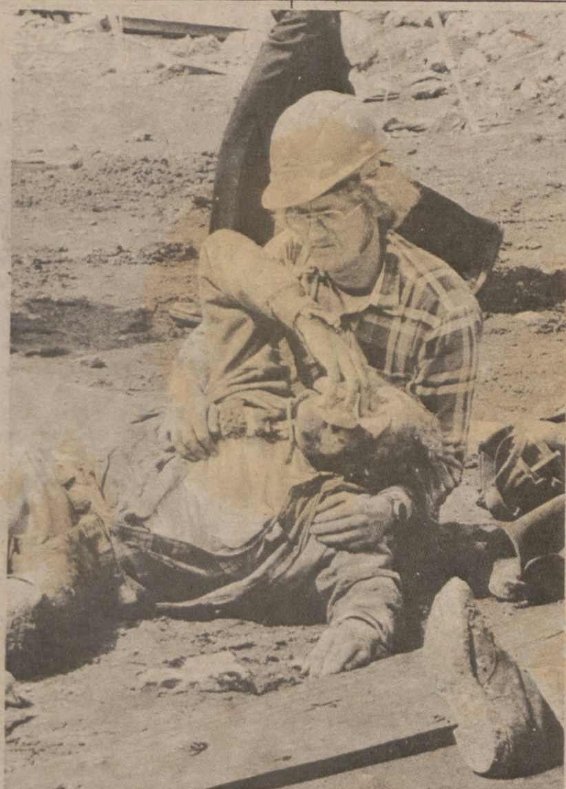
EAST CHICAGO, INDIANA. — Jeden z robotników budowlanych pomaga rannemu koledze. Zdjęcie zrobione w kilka minut po katastrofie, w jakiej zginęło 12 osób, kiedy zawalił się most po którym miała przebiegać autostrada.