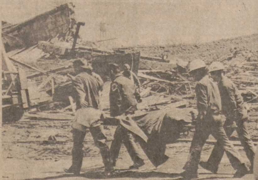
EAST CHICAGO, INDIANA. — Członkowie ekip ratowniczych wynoszą z gruzów ciało robotnika, który zginął w katastrofie, jaka wydarzyła się tu 15 kwietnia.

Policjant patrolowy zauważył pożar około 3:30 rano wkrótce po zamknięciu lokalu. W nocnym klubie znajdowało 7 pojemników zawierających płyn łatwopalny. Zniszczenia w klubie nie są zbyt wielkie, ponieważ szybkie wykrycie pożaru przyczyniło się do zmniejszenia nieszczęścia.