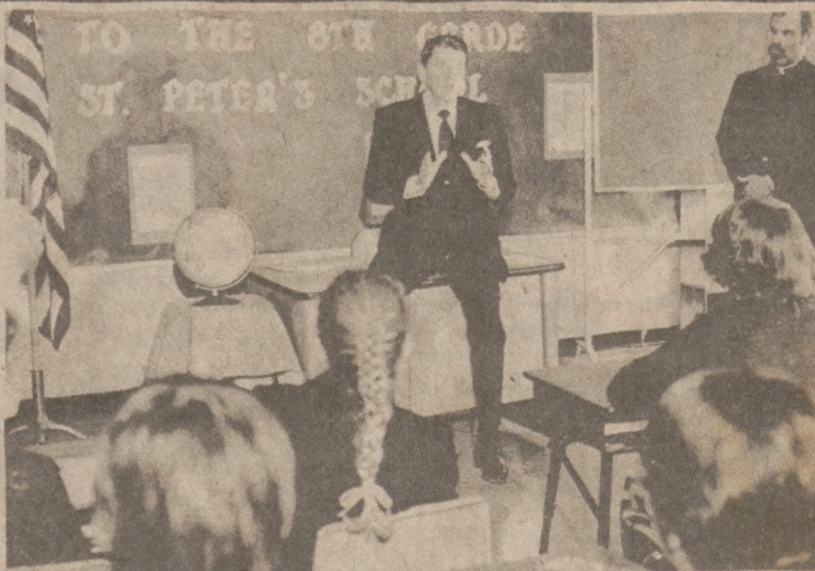
GENEVA, ILL. — Prezydent Reagan odwiedził uczniów szkoły katolickiej św. Piotra. Wziął udział w lekcji nauki o konstytucji U.S. odpowiadając na zadawane pytania. (UPI)

Stanowy Dept. Opieki Społecznej przyznał, że jedynie w tym ostatnim punkcie, rzeczywiście postąpiono niewłaściwie. We wszystkich innych wypadkach postępowano w myśl obowiązujących przepisów. Cała sprawa nie została jeszcze rozwiązana i czeka na załatwienie.