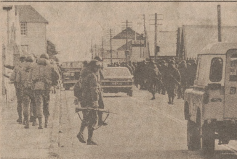
FALKLANDY. — Wojsko argentyńskie na ulicach Port Stanley, w drodze do miejsca biwakowania.

W r. 1971 ówczesny min. spraw zagr., sir Alec Douglas-Home zarządził masowe wydalenie sowieckich szpiegów, którzy przebywali w W. Brytanii jako członkowie sowieckiej misji handlowej. Od tego czasu Brytyjskie Min. Spraw Zagranicznych postanowiło, że jeśli członek sowieckiej misji zostanie wydany w W. Brytanii po wykryciu jego działalności szpiegowskiej, ilość członków sowieckiej misji handlowej zostanie automatycznie zmniejszona o jedną osobę.