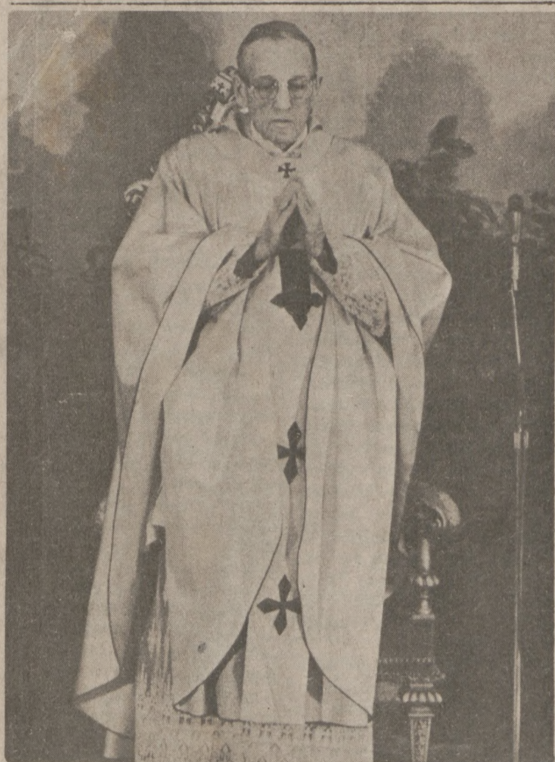
CHICAGO. — Śp. ks. Kardynał John Cody. Ostatnie zdjęcie Kardynała z Pasterki, którą odprawił w grudniu ub. roku w Katedrze.

London (DP) — Pięciu górników zginęło w wypadku, jaki miał miejsce w kopalni "Victoria" pod Wałbrzychem. Nastąpiło tam oberwanie się węgla oraz pojawienie się trującego tlenku węgla i metanu.