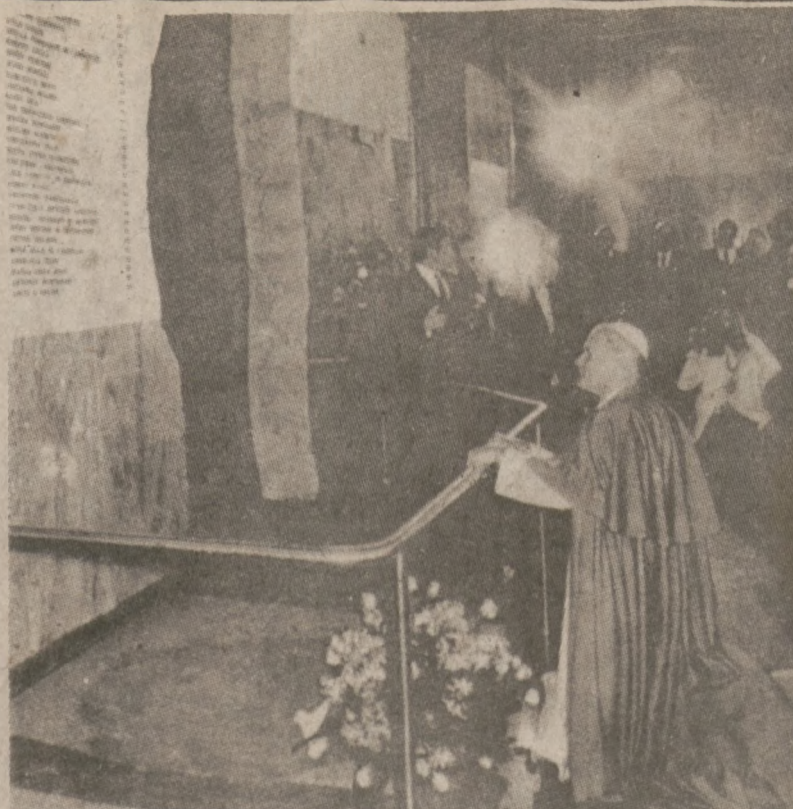
BOLONIA, WŁOCHY. —Ojciec Święty zatopiony w modlitwie w miejscu, gdzie na skutek wybuchu bomby zginęło 85 osób. Bombę podłożono na dworcu kolejowym 2 sierpnia 1980 r.

Od wielu miesięcy jak się nieoficjalnie podaje, CTA z powodu trudności finansowych nie przyjmuje do pracy nikogo. Dlatego ponowne zatrudnienie Brabec wywołało liczne protesty. Jednakże jak się stwierdza, prezes rady CTA Cardilli znajdował się pod presją polityczną, dając zgodę do ponownego zatrudnienia.