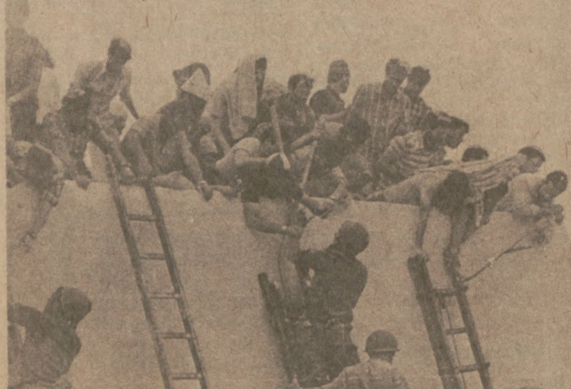
YAMIT, SYNAJ — Zdjęcia z ostatnich dni, kiedy prowadzono ewakuację ludności żydowskiej zamieszkującej te tereny. Od niedzieli, przeszły one spowrotem do Egiptu.