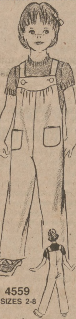
4559 SIZES 2-8