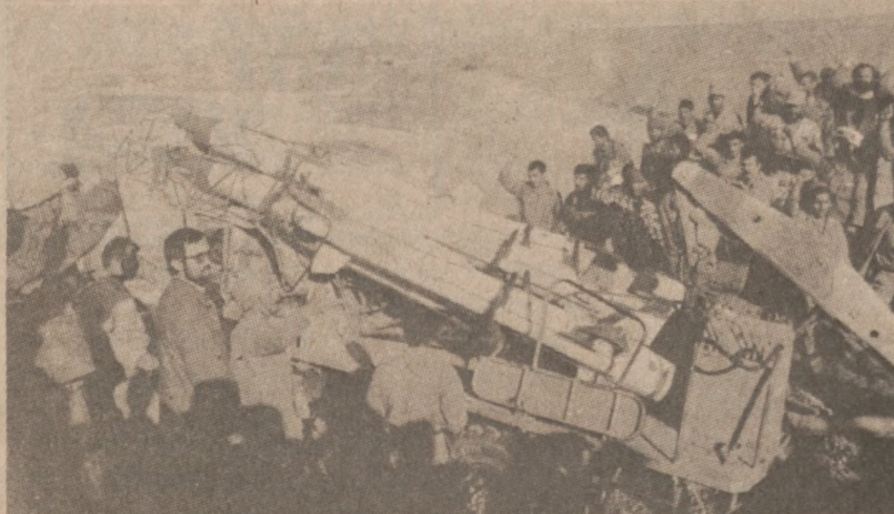
DASHT-E ABBAS, IRAN. — Kilka tygodni temu zdobyto iraackie pociski, które stanowią nadal obiekt zainteresowania żołnierzy irańskich.