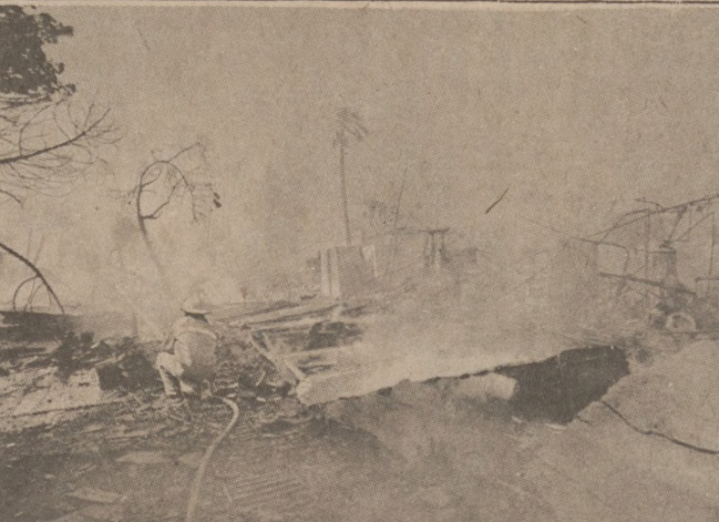
ANAHEIM, KALIFORNIA. — Scena zniszczeń spowodowanych pożarem, jaki rozprzestrzenił się w Kalifornii. Trzeba było ewakuować tysiące mieszkańców.