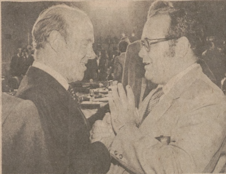
WASHINGTON — W czasie specjalnego zebrania Organizacji Państw Amerykańskich, (OAS) rozmawiają ze sobą: minister spraw zagranicznych Argentyny Nicanor Costa Mendez (po lewej) i minister spraw zagranicznych Nicaragui Miguel D'Escento. (UPI)

Webb pochwalił konsula tajlandzkiego w Chicago, Chevy Suestrong'a oraz przedstawicieli dyplomatycznych tego kraju w Washingtonie, w tym również ambasadora Prok Amara-nand'a — za "wyjątkową i bliską współpracę w tej dziedzinie, co doprowadziło do rozwiązania poważnego problemu". Webb oświadczył, że śledztwo w tej sprawie prowadzone jest nadal.