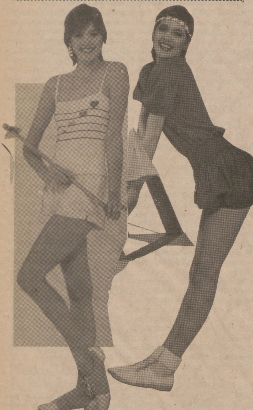
Kolejne propozycje letnich strojów wypoczynkowych, do parku i na wycieczki, projektu Gitano.