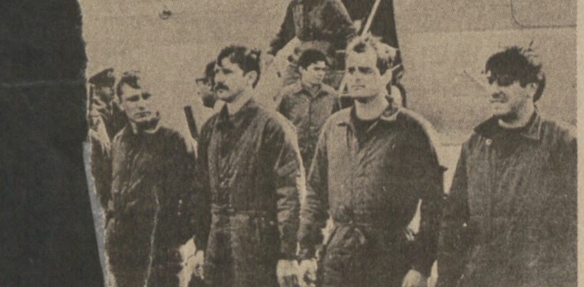
ANCA, ARGENTYNA — Marynarze, którzy ocalili z "neral Belgramo" jaki zatopili Angliey 5 maja br.