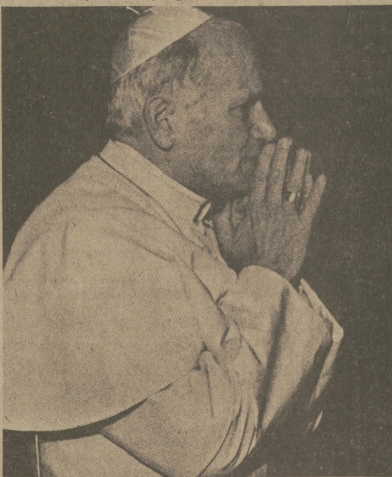
Dzisiaj przypada 62 urodziny Ojca Świętego