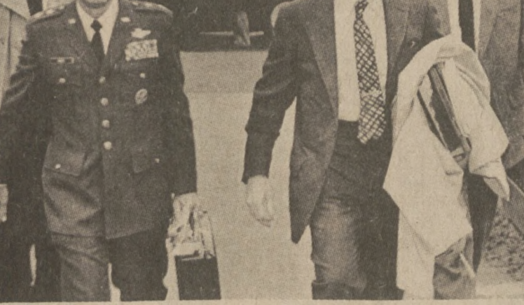
BRUKSELA — Sekretarz obrony U.S. Caspar Weinberger przyjechał do Brukseli na posiedzenie ministrów obrony państw NATO.