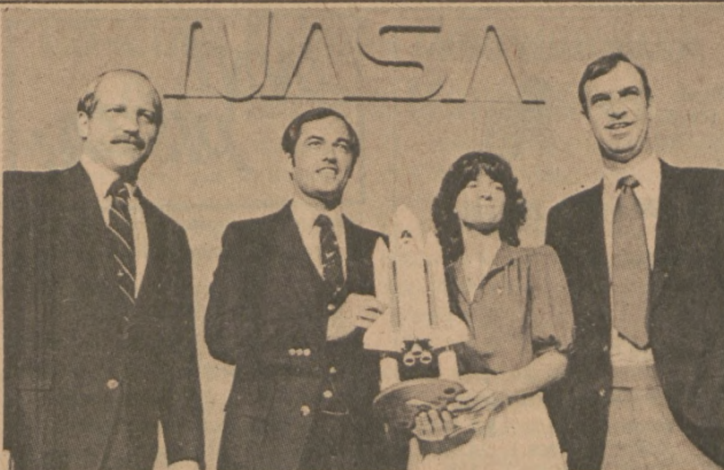
SPACE CENTER, HOUSTON. — Na zdjęciu ekipa astronautów, którzy polecą w przestworza siódmym lotem wahadłowca. Od lewej stoja: Frederick Hauck — pilot, Robert Crippen — komendant, Sally Ride — specjalista i John Fabian — specjalista.