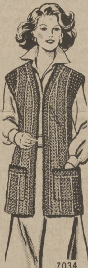
7034 by Alice Brooks

Go-everywhere classic! This lean, long jacket tops all JIFFY-CROCHET in slimming vertical stripes. Combine four colors or shades of a single color for this cap-sleeved jacket. Pattern 7034: Women's Sizes 38-40; 42-44 included.