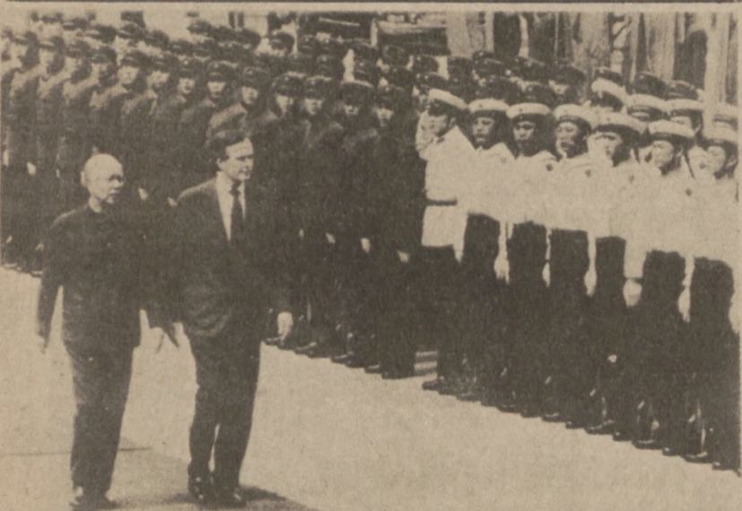
PEKIN. — Wicepremier Chin Wan Li, towarzyszy wiceprezydentowi George Bush w czasie ceremonii powitalnych. Wiceprezydent Bush złożył wizytę w Chinach w ubiegłym tygodniu. Zdjęcie z 7 maja br.

Wypadek wydarzył się niedaleko 71 ul. i Morgan na południowej stronie miasta.