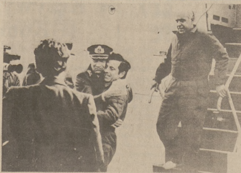
BAHIA BLANCA, ARGENTYNA — Zastępca komandora argentyńskiego okrętu "General Belgrano" witany serdecznie na lotnisku argentyńskim w momencie, gdy samolot przywiózł rozbitków. Okręt został zatopiony przez Anglików 5 maja. Zginęło ponad 300 marynarzy.

Umowa ta obowiązywać będzie w zakładach w Milwaukee i Kenosha, Wis. do dnia 16 września 1985 r., a w Toledo do 31 stycznia 1985.