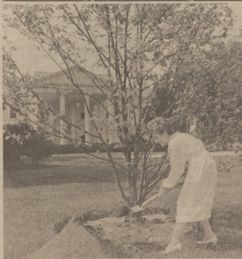
WASHINGTON. — Zgodnie z tradycją, Pierwsza Dama Nancy Reagan posadziła w ogrodzie przed Białym Domem drzewko magnolii.

W pobliskiej szkole przeprowadzono ewakuację dzieci i nauczycieli. Przyczyna eksplozji nie jest dotychczas znana.