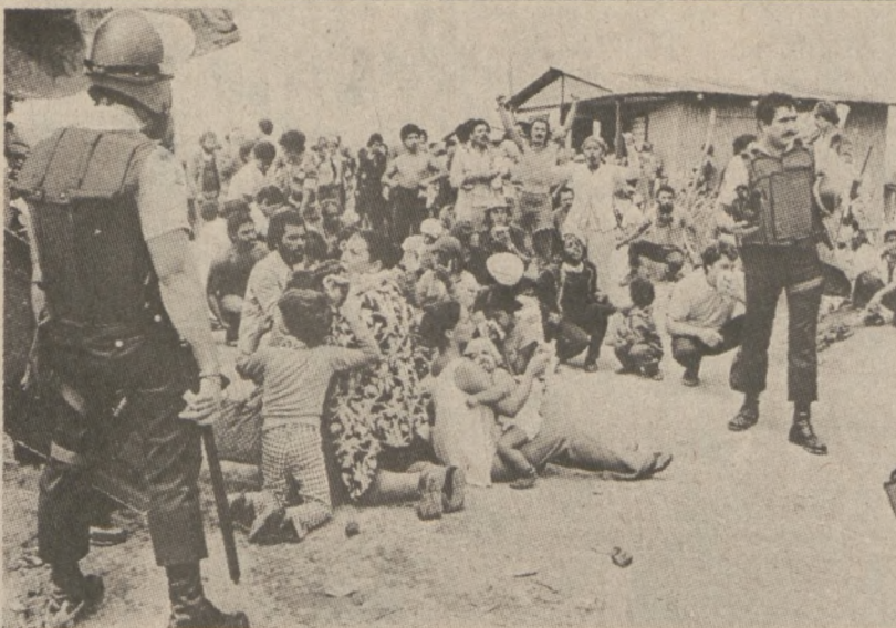
RIO GRANDE, PUERTO RICO — Policja ewakuuje samowolnych osadników, którzy zajęli tereny położone w pobliżu San Juan, zakładając wioskę villa Sin Mideo. W sumie ewakuowano ponad 250 osób.