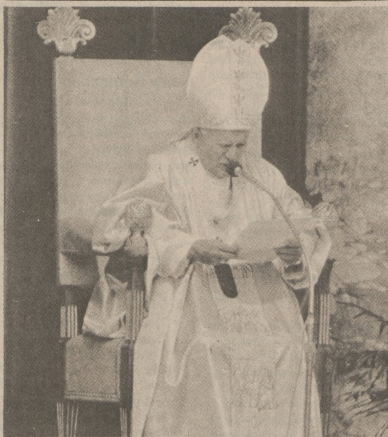
MIASTO WATYKANSKIE. — Papież Jan Paweł II wygłasza kazanie w czasie uroczystości beatyfikacyjnych, jakie odbyły się w Watykanie 23 maja br.

London (UPI) — Wartość dolara w stosunku do walut europejskich nieznacznie spadła. Cena złota wzrosła o $3 do $330.50 za uncję.