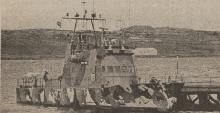
MALWINY. — Statek patrolowy marynarki argentyńskiej przycumowany u brzegu w Porcie Stanley.

Culotta zeznawał również, że otrzymał polecenie od Spilotro zamordowania członka bandy włamywaczy Ernesta Davino. Culotta zlecił wykonanie tego zadania Neumann. Neumann kupił broń, jednakże nie miał okazji zamordowania Davino, ponieważ był przez policję przesłuchiwany w sprawie dwu innych morderstw. W międzyczasie znaleziono u niego broń, za co został oskarżony i skazany na 2 lata więzienia na rozprawie w ostatnim tygodniu.