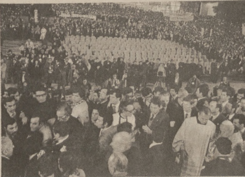
FATIMA, PORTUGALIA.—Zdjęcie na którym uchwyciono chwilę, kiedy służba bezpieczeństwa Papieża zdołała uchwycić niedoszłego zamachowca, na stopniach wiodących do sanktuarium Matki Boskiej Fatimskiej. Po prawej, Papież w otoczeniu świty, po lewej grupa w której znajduje się zamachowiec.

Przeciwnicy ustawy twierdzą, że nie wolno odbierać pracownikom przywilejów poprzednio obiecanych, ponieważ, jak wiadomo Gubernator podpisał już umowę o pracę z przedstawicielami pracowników stanowych.