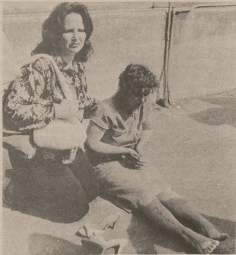
HOUSTON.—Jedna z ofiar wybuchu, jaki miał miejsce 1-go czerwca w banku, czeka na pierwszą pomoc. W wybuchu tym, zostało rannych 15 osób.

Ostatni raz zamachowiec wyszedł z sali w ub. czwartek. Następnego dnia, przepraszał sąd za swe zachowanie, przyrzekając, że będzie się starał pozostać na sali rozpraw do końca procesu. Hinckley wyjaśnił również, że czasami nie może poradzić sobie z własnymi myślami, wówczas właśnie udaje się w odosobnione miejsce, czyli do swej celi.