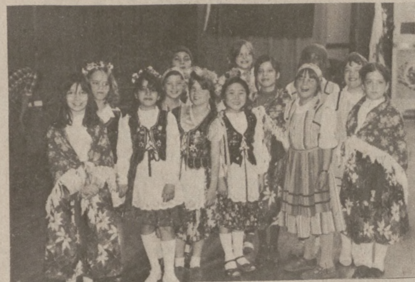
Grupa dzieci w strojach regionalnych odtńczyła polski taniec. Wśród uczniów byli też nie polskiego pochodzenia.