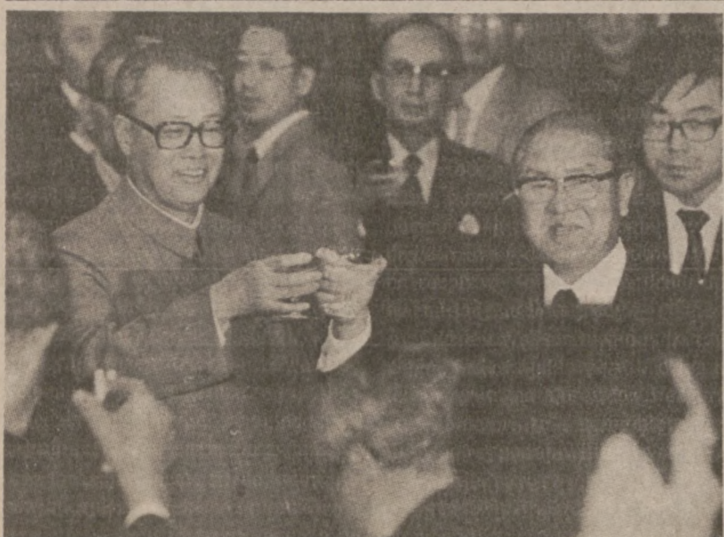
TOKIO. — Chiński premier Zhao Ziyang (po lewej) i japoński premier Zenko Suzuki (po prawej) wznoszą toast w czasie przyjęcia, jakie odbyło się w ambasadzie chińskiej w Tokio.

Ogólna liczba przestępców skazanych na karę śmierci wzrosła do tego stopnia, że władze stanowe zostały zmuszone stworzyć dla nich dodatkowy blok więzienny. Obecnie 40 skazanych przestępców przebywa w więzieniu Menard w Chester, 60 mil na południowy wschód od St. Louis. Nowy blok więzienny będzie w stanie pomieścić 46 osób i będzie oddany do użytku przy końcu miesiąca.