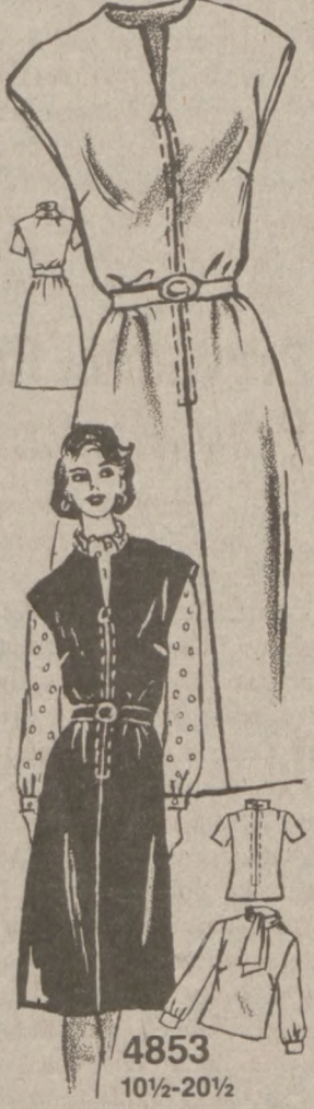
4853 10 1/2-20 1/2 by Anne Adams

Zip and go in this smart jumper-dress with extended shoulders. Just two main parts — no waist seam, fitting, fuss, problems. Blouse has scarf tie. Printed Pattern 4853: Half Sizes 10 1/2, 12 1/2, 14 1/2, 16 1/2, 18 1/2, 20 1/2. Size 14 1/2 (bust 37) dress takes 1 7/8 yards 60-inch. $2.25 for each pattern. Add 50¢ for each pattern for postage and handling. Send to: