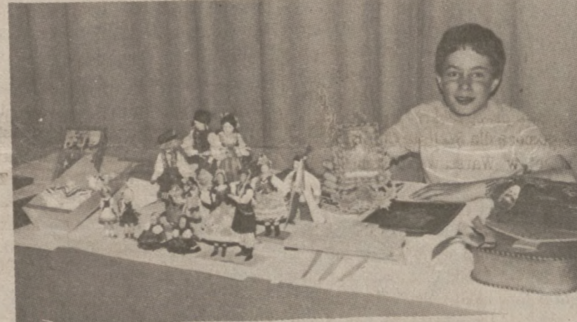
Jeden z uczniów "pełni dyżur" przy stole na którym zgromadzone wyroby polskiej sztuki ludowej.

liczba dzieci mówiących po polsku podwoiła się. Nic więc dziwnego, że zarówno dzieci jak i opiekujący się nimi nauczyciele postanowili uczcić 191 rocznicę uchwalenia Konstytucji 3 Maja.