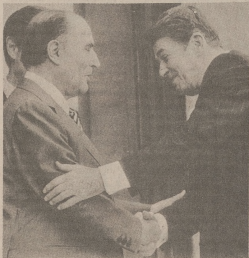
PARYŻ.—Prezydent Francji Francois Mitterrand wita prezydenta U.S. Ronalda Reagana, w pałacu Elizejskim 3 czerwca

Krajowa Organizacja Kobiet zabiegała o poparcie ERA w 4 stanach: N. Carolina, Florida, Oklahoma i Illinois. Pozostałe stany jeszcze nie wypowiedziały się w tej sprawie.