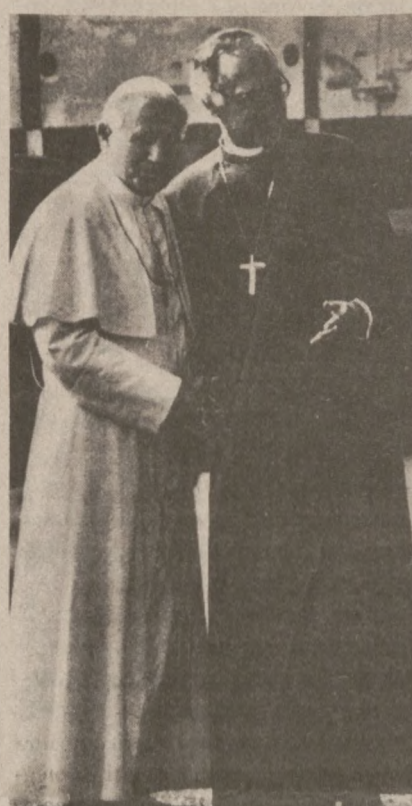
CANTERBURY. — Papież Jan Paweł II i arcybiskup Canterbury Robert Runcie.

W pierwszym dniu swego pobytu w Wielkiej Brytanii, siedząc na tronie w katedrze katolickiej Westminsteru Ojciec Święty powiedział: "Dzisiaj, po raz pierwszy w historii Biskup Rzymu stanął na ziemi brytyjskiej. . . Najgłębszym moim marzeniem i najgorętszą nadzieją w modlitwach mych jest to, że moja wizyta przyczyni się do zjednoczenia chrześcijan" . . . — a stwierdzenia