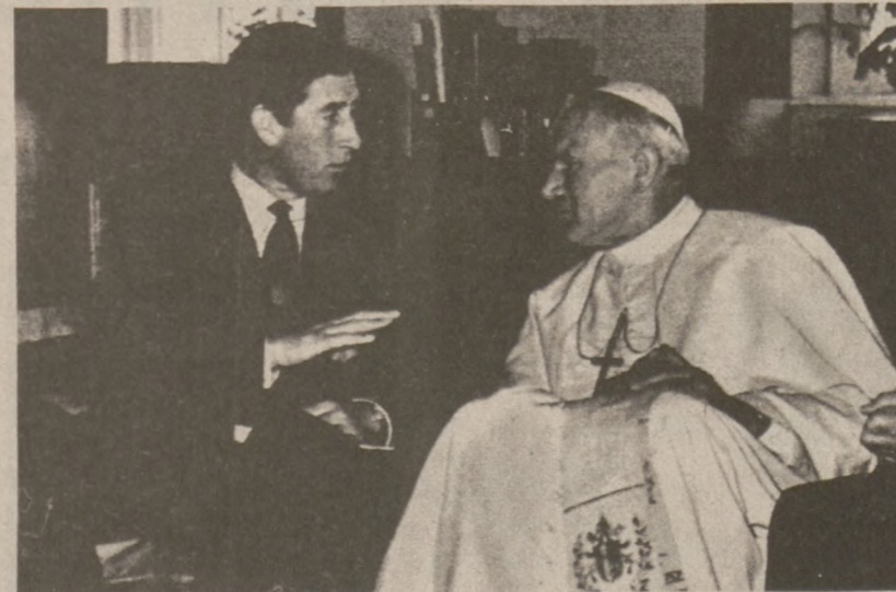
CANTERBURY, ANGLIA. — Ojciec Święty w rozmowie z następcą tronu księciem Karolem.

Kolejnym etapem nabożeństwa były: wspólne odmówienie Modlitwy Pańskiej, homilie Arcybiskupa i Papieża, intronizacja Biblii, odnowienie chrztu i wreszcie uczczenie wspólnych nam męczenników za wiarę.