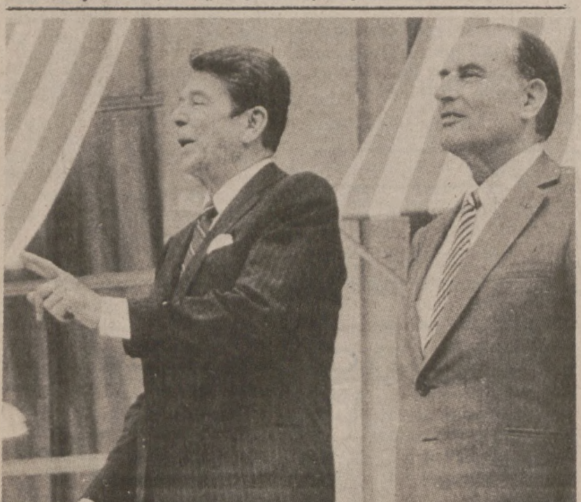
PARYŻ.—Prezydent U.S. Ronald Reagan i prez. Francji, Francois Mitterrand w czasie wspólnej konferencji prasowej, jaka odbyła się w ogrodzie pałacu Elizejskiego 3 czerwca br.

Rada Szkolna utrzymuje jednak, że problem rozwiązać się sam, ponieważ obecnie nie ma już tylu kandydatów z obu grup etnicznych, którzy chcieliby uczęszczać do szkół.