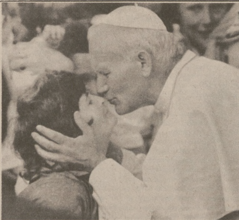
CARDIFF, WALIA.—Przed odjazdem do Rzymu, papież Jan Paweł II żegna się z kobietą—Walijką. Papież zakończył sześciodniową podróż do Anglii 2 czerwca br.