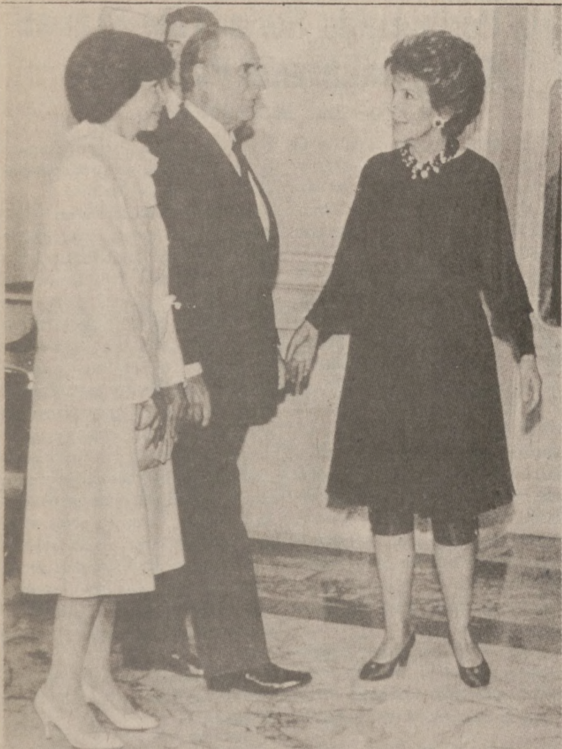
PARYŻ.—Nancy Reagan, żona prezydenta U.S., wita prez. Mitterrand'a i jego małżonkę Daniełę. Państwo Mitterrand przybyli do ambasady U.S. na przyjęcie wydane przez państwo Reagan.