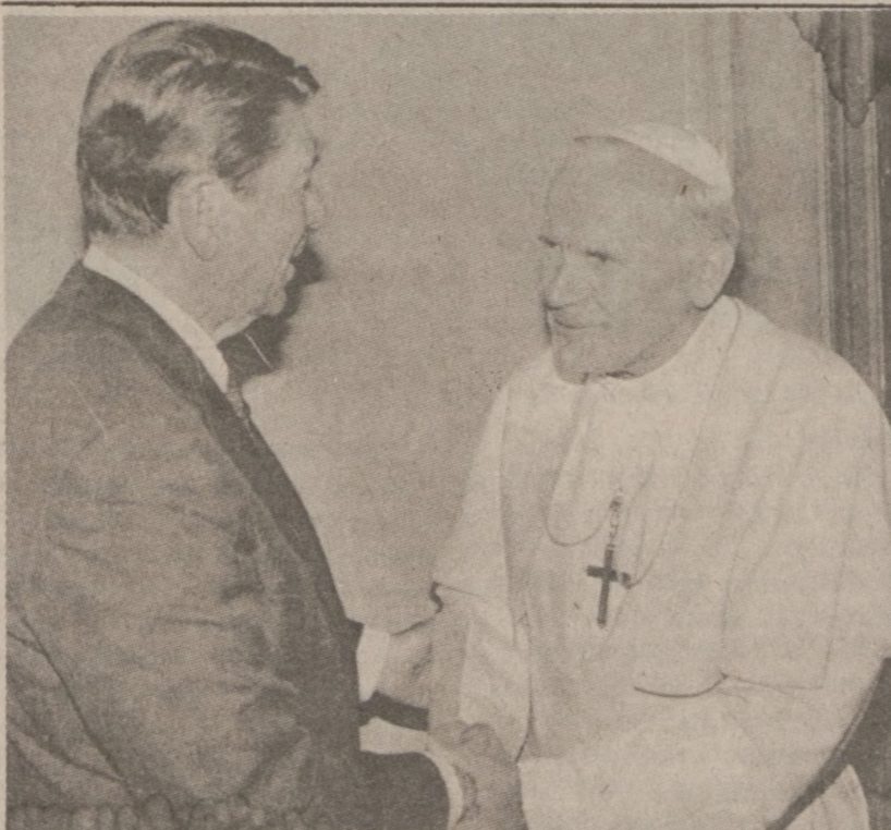
WATYKAN.—Papież Jan Paweł II wita prezydenta U.S. Ronalda Reagana, który złożył Mu wizytę 7 czerwca br. Prywatna audiencja odbyła się w bibliotece papieskiej.

Prezydent Argentyny, gen. Leopoldo Galtieri oświadczył, że plan ten nie zawiera dostatecznych gwarancji na to, że W. Brytania postąpi zgodnie z planem ONZ.