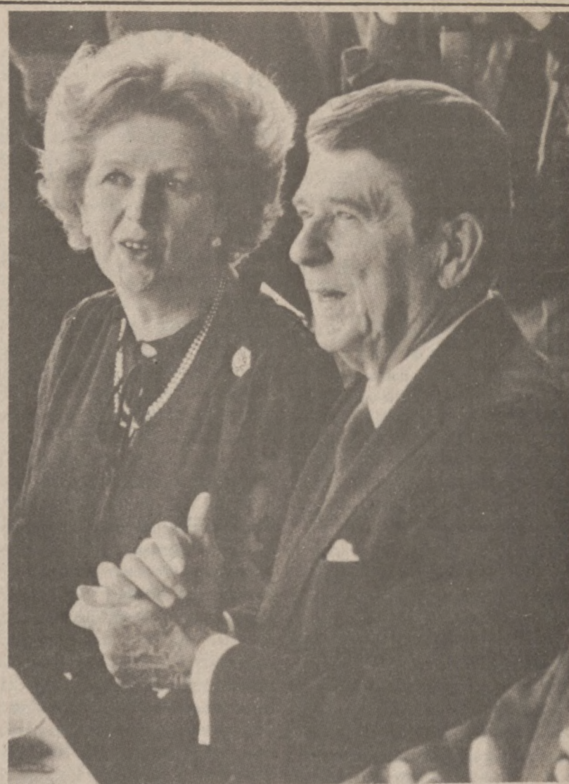
WERSAL, FRANCJA — Prezydent U.S. Ronald Reagan z premierem Wielkiej Brytanii Margaret Thatcher w czasie obiadu, jaki odbył się 6 czerwca w Wersalu.

Pamiętaj, że wobec zmuszenia narodu polskiego do milczenia, "Dz. Związkowy" jest jego wolnym głosem.