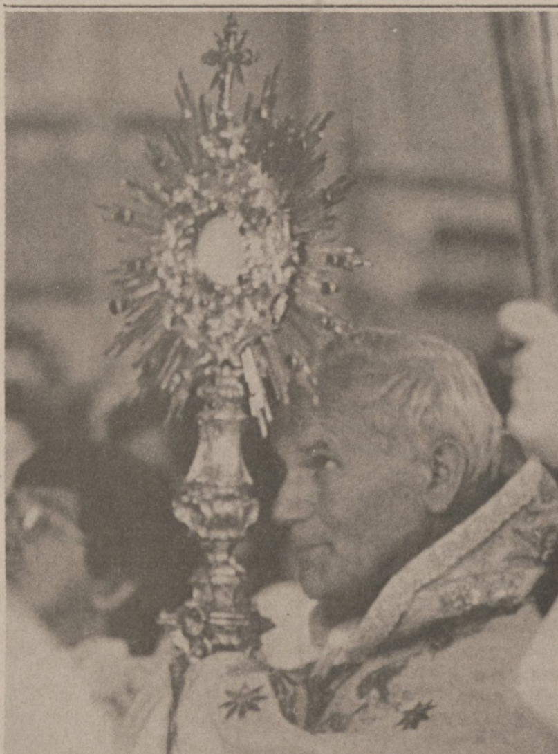
RZYM. — Papież Jan Paweł II podczas procesji "Bożego Ciała", która wyruszyła z bazyliki Jana Laterańskiego do bazyliki większej Matki Boskiej, 10 czerwca br. Ojciec Święty przebywa dzisiaj w Genewie.

Genewa — Ojciec Św. Jan Paweł II przybył do Genewy, nazywanej "protestanckim Rzymem" (rzucił tam po tyrańsku Jan Kalwin), by wygłosić przemówienia na konferencji Międzynarodowej Organizacji Pracy (ILO) i Czerwonego Krzyża. Powitanie w Genewie było b. skromne. Tylko kilkaset osób witało Papieża wzdłuż trasy przejazdu z lotniska do miasta. W przemówieniu do delegatów ILO, Papież domagał się dla robotników prawa do organizowania się w związki zawodowe, niezależne od władz politycznych (czego nie mają robotnicy w Polsce). Papież ostro wystąpił przeciw wzrastającemu bezrobociu, przypomniał, że setki milionów ludzi głoduje, stwierdzając, że dobro ludzkości wymaga (Ciąg dalszy na str. 6-ej)