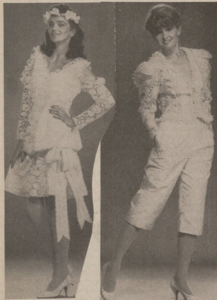
Propozycje strojów dla panny młodej po ślubie, na przyjęcie weselne, projektu Constance Mallas.