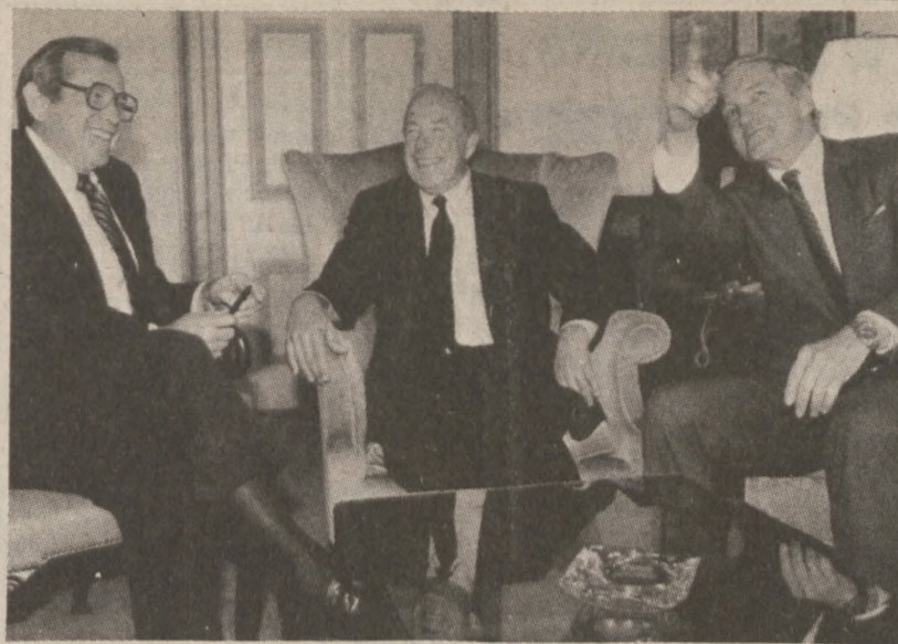
WASHINGTON. — Kandydat na stanowisko sekretarza stanu George Shultz (w środku) spotkał się na Kapitolu z przewodniczącym większości w Senacie Howardem Baker (po lewej) i sen. Charlesem Percy, przewodniczącym senackiego komitetu spraw zagranicznych. Spotkanie odbyło się w końcu czerwca.

Decyzja sędziego zostanie rozpatrzona przez Sąd Apelacyjny. Jeśli zostanie potwierdzona, oznaczać to będzie poważne straty finansowe dla powiatu, ponieważ właściciele nie będą musieli, jeśli odkupią posiadłości, wyrównywać zaległych podatków.