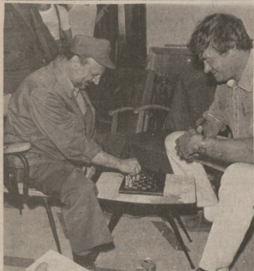
BEJRUT — Przywódca Palestyńczyków Yasser Arafat gra w szachy z korespondentem zagranicznym w swojej kwaterze w Bejrucie. Zdjęcie z 30 czerwca br.