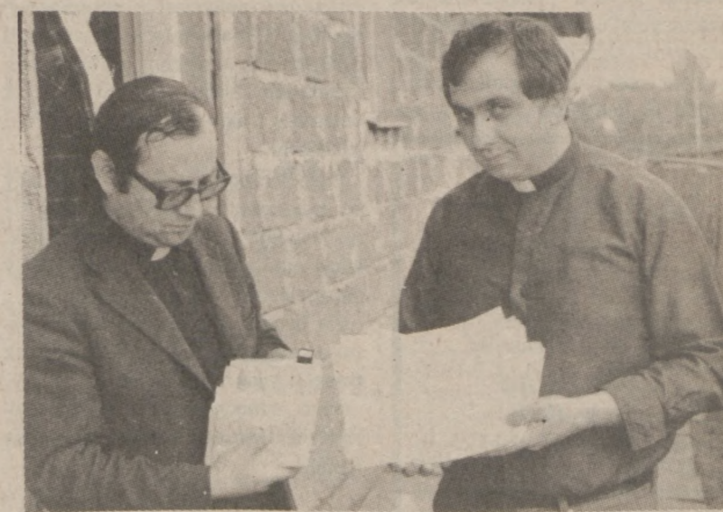
Księża z przygotowanymi listami osób, które potrzebują pomocy.

z bp. Dominem doszli do wniosku, że obecnie najbardziej potrzebne są leki i sprzęt medyczny, szczególnie części do maszyn medycznych, chemikalia pozwalające na przeprowadzanie różnego rodzaju analiz laboratoryjnych, antybiotyki, papier do maszyn EKG. Zwrócono uwagę na konieczność zaopatrzenia polskich lekarzy we współczesne periodyki medyczne, ponieważ medycyna polska oparta jest na medycynie zachodniej i stałe dokształcanie się lekarzy, jest