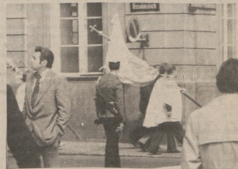
W Warszawie, przygotowania do Obchodów półroczia wprowadzenia stanu wojny.