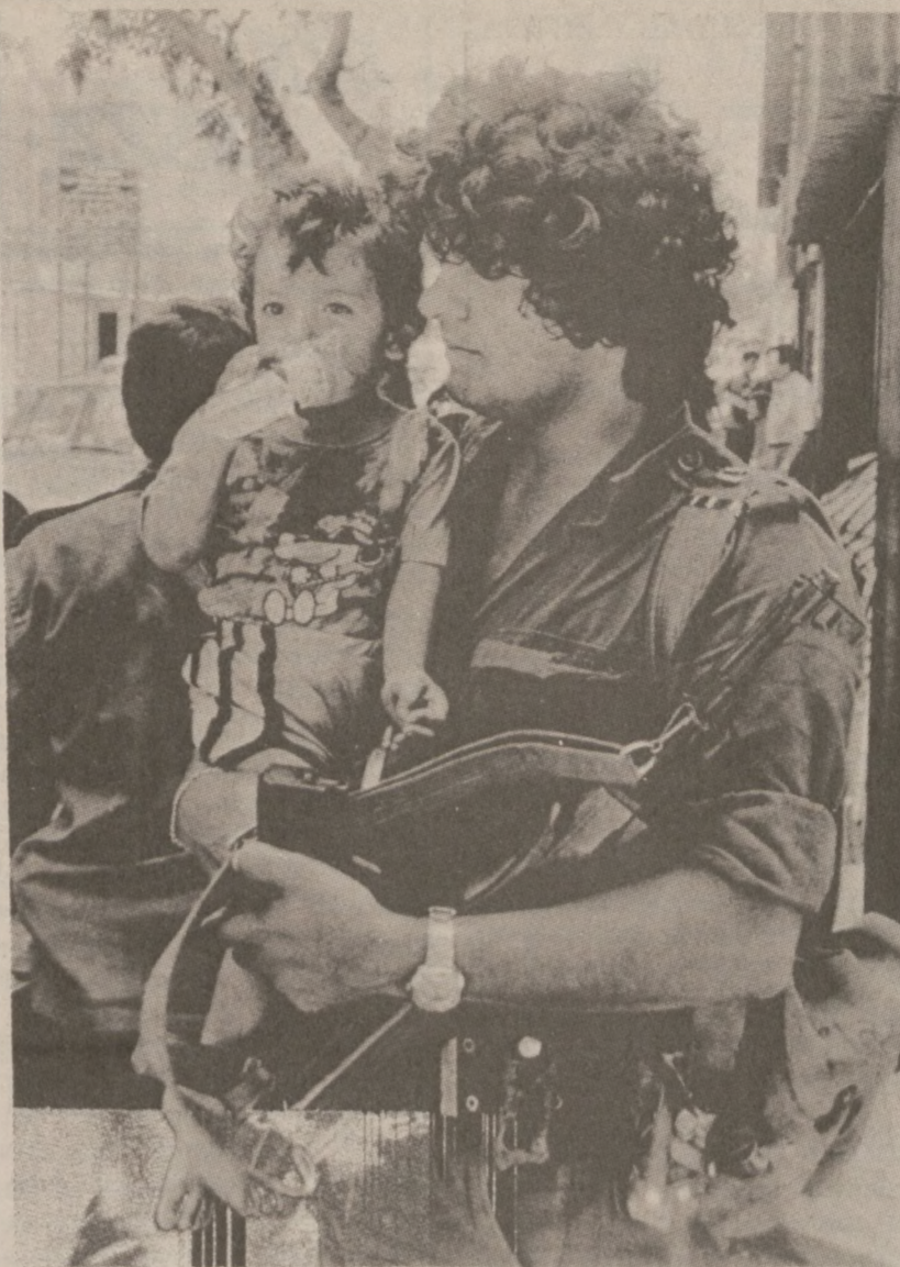
BEJRUT. — Żołnierz palestyński, korzystając z zawieszenia broni z dzieckiem na rękach wybrał się na spacer po ulicach stolicy Libanu.

Występowała w wielu filmach m. in. w "The French Connection", "Staircase", "Three coins in a fountain" oraz serialu telewizyjnym "Upstairs Downstairs".