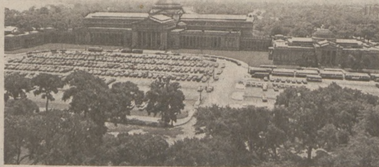
CHICAGO. — Muzeum Wiedzy i Przemysłu.