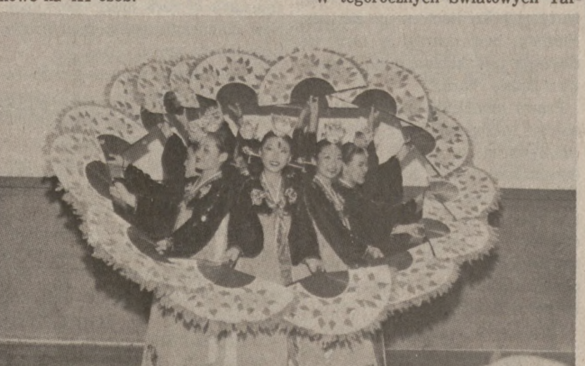
Expo 82—Zespół tancerek koreańskich

Strukturą tematyczną Targów jest 266 stóp wysoka wieża "Sunsphere" z kulistym globem na szczycie, zbudowanym z 350-ciu szklanych płyt zawierających wtopione wewnątrz 24-karatowy pył złota. Wewnątrz znajduje się 5 pięter, w tym 3 restauracje na 376 osób, oraz dwa poziomy widokowe na 411 osób.