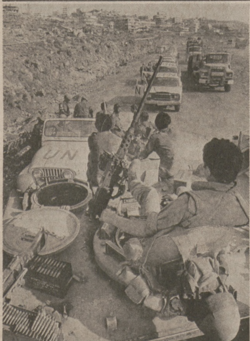
DAMOUR, LIBAN. — Uzbrojony oddział żołnierzy izraelskich wstrzymał kolumnę oddziałów Narodów Zjednoczonych zdążającą w kierunku Bejrutu.

Sprawę rozpatrywać będzie sędzia sądu okręgowego Arthur Dunne, nie wyznaczono jeszcze terminu rozpoczęcia przewodu sądowego.