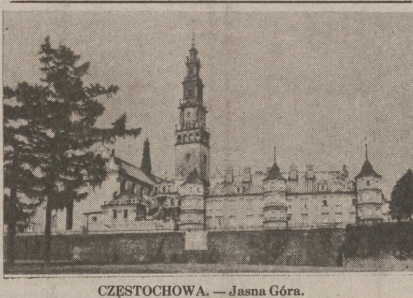
CZESTOCHOWA. — Jasna Góra.

Wznowienie ataków nastąpiło, gdy upojony sukcesem dyplomatycznym emisariusz amerykański Philip Habib już przystąpił do rozmów z wojskowymi amerykańskimi i francuskimi w sprawie wprowadzenia jednostek USA i Francji, które nadzorować będą ewakuację Palestyńczyków.