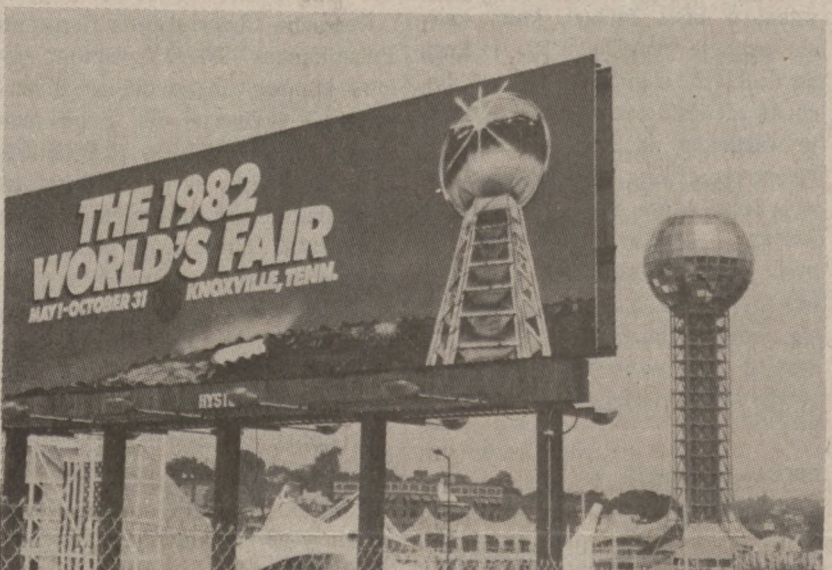
"Sunsphere" na "Expo 82"

Utrzymując tradycję wielkich Światowych Targów w Paryżu, Brukseli i Montrealu, organizatorzy spodziewają się, że odwiedzi je ok. 11 milionów ludzi. Jest to tak jak poprzednie, oficjalna światowa wystawa, zatwierdzona przez "Bureau of International Expositions" w Paryżu. W skrócie nazywane Expo 82.