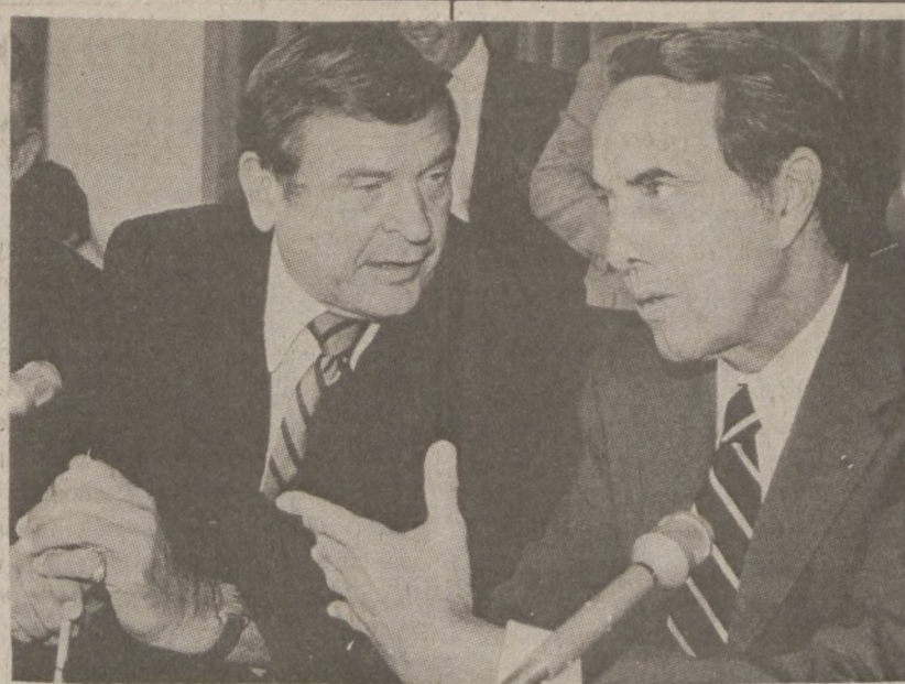
WASHINGTON. — Przewodniczący kongresowego komitetu środków i sposobów kongr. Daniel Rostenkowski (po lewej) w rozmowie z przewodniczącym senackiego komitetu finansów sen. Bobem Doyle.

Administracja Dziennika Związkowego Dział Ogłoszeń