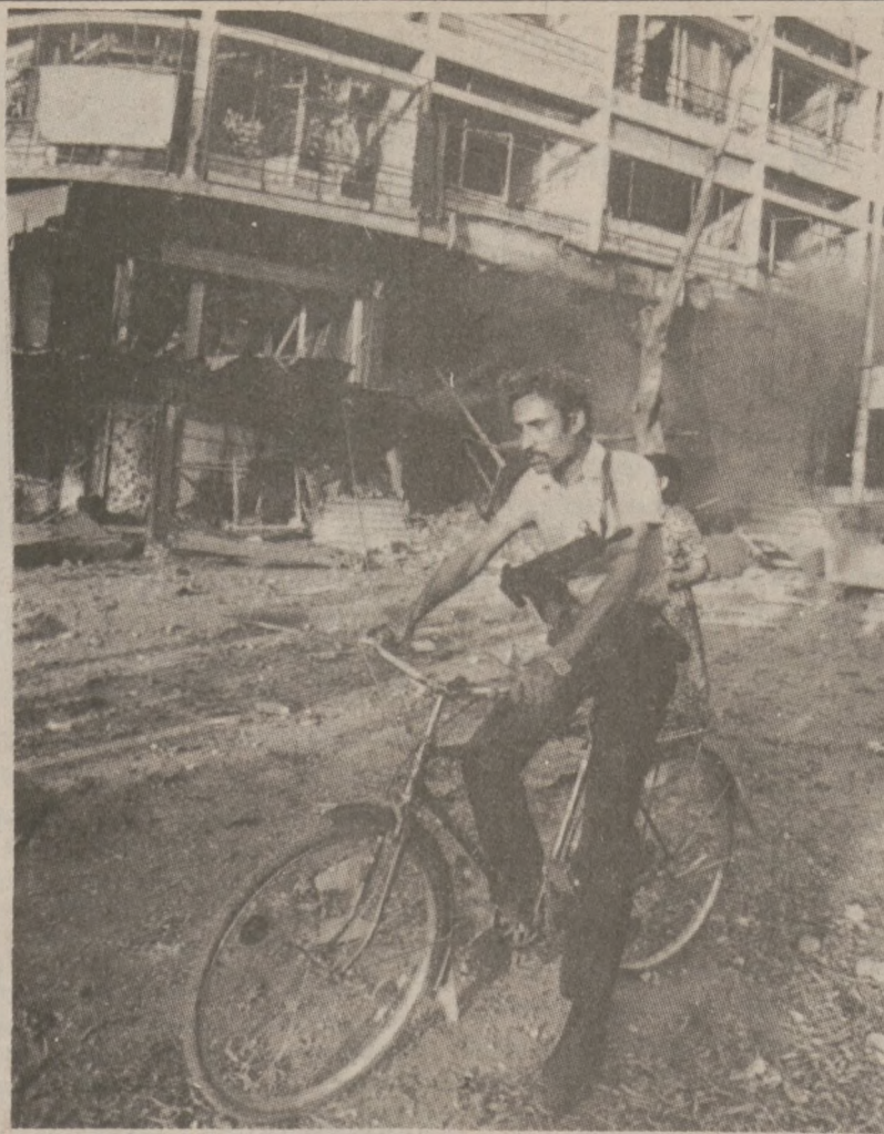
BEJRUT. — Żołnierz palestyński na ulicach stolicy Libanu.

8 osób zostało aresztowanych za posiadanie i handel narkotykami. Policja dokonała kilku oddzielnych najeżdów, w wyniku czego skonfiskowano narkotyki wartości $500,000. Na parkingu 920 W. Foster, skonfiskowano narkotyki wartości $140,000, od handlarza narkotyków. W mieszkaniu tego samego handlarza znaleziono narkotyki wartości $320,000.