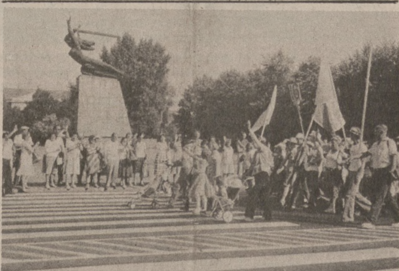
WARSZAWA. — Pielgrzymka 40,000 Warszawiaków mija pomnik "Warszawskiej Nike", w drodze do Częstochowy. Pielgrzymka wyruszyła z Warszawy 7 sierpnia br. (UPI)

Londyn (UPI) — Zyskowne operacje giełdowe spekulantów sprawiły, że kurs dolara obniżył się nieco w stosunku do notowań wczorajszych. Cena złota w Londynie i w Zurichu jest jednakowa: $332.50 za uncję.