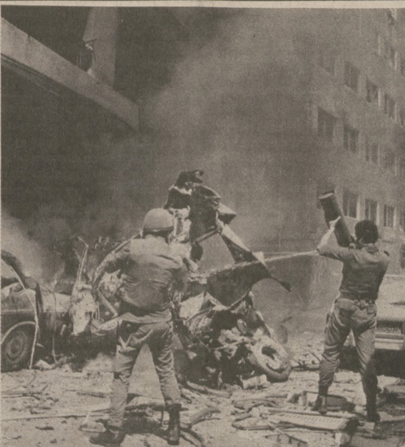
BEJRUT — Żołnierze gaszą ogień powstały po wybuchu bomby, rzuconej w sąsiedztwie hotelu, gdzie przebywają dziennikarze zagraniczni.