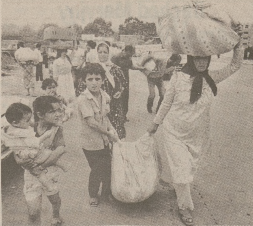
BEJRUT, LIBAN. — Ludność z zachodnich dzielnic Bejrutu ucieka do dzielnic wschodnich tego miasta.

New Delhi — Indira Gandhi zapowiedziała, że bez zgody Stanów Zjednoczonych i bez inspekcji amerykańskich realizować będzie program nuklearny, który służyć może zbrojeniom.