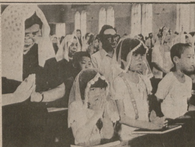
NAGASAKI, JAPONIA. — Nabożeństwo odprawione w rocznicę zrzućenia bomby atomowej na Nagasaki.

W restauracji tej będzie między innymi 20 do 30 gier elektronicznych dla dzieci oraz sala gier dla osób dorosłych. Restauracje tego typu są zarządzane przez Brock Hotel Corp. z Topeka, Kan., i istnieją już w Arlington Heights i Bowlingbrook oraz planowane jest dalsze ich otwarcie w okręgu chigagoskim (w sumie 25).