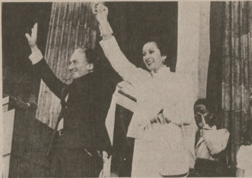
BOGOTA, KOLUMBIA. — Prezydent Kolumbii Belisario Betancur wraz z małżonką pozdrawia tłumy zgromadzone na uroczystości zaprzysiężenia Prezydenta, 8 sierpnia br.

Każdą umowę dotyczącą kupna i sprzedaży muszą zatwierdzić członkowie Rady Szkolnej, aby obowiązywała.