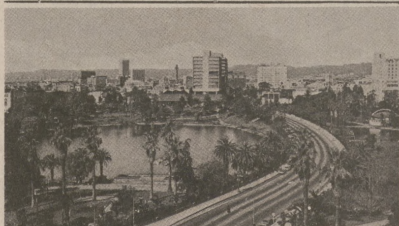
LOS ANGELES. — Słynny na całym świecie Wilshire Blvd. i piękny McArthur Park.

Obecne przepisy tej gry nie wymagają od graczy podawania swoich danych na odcinkach kuponów, biorących udział w losowaniu. W ten sposób zdobywca wygranej pozostaje anonimowy do czasu zgłoszenia się po odbiór nagrody. Według przepisów wygrywający mają rok czasu na odebranie wygranej sumy.