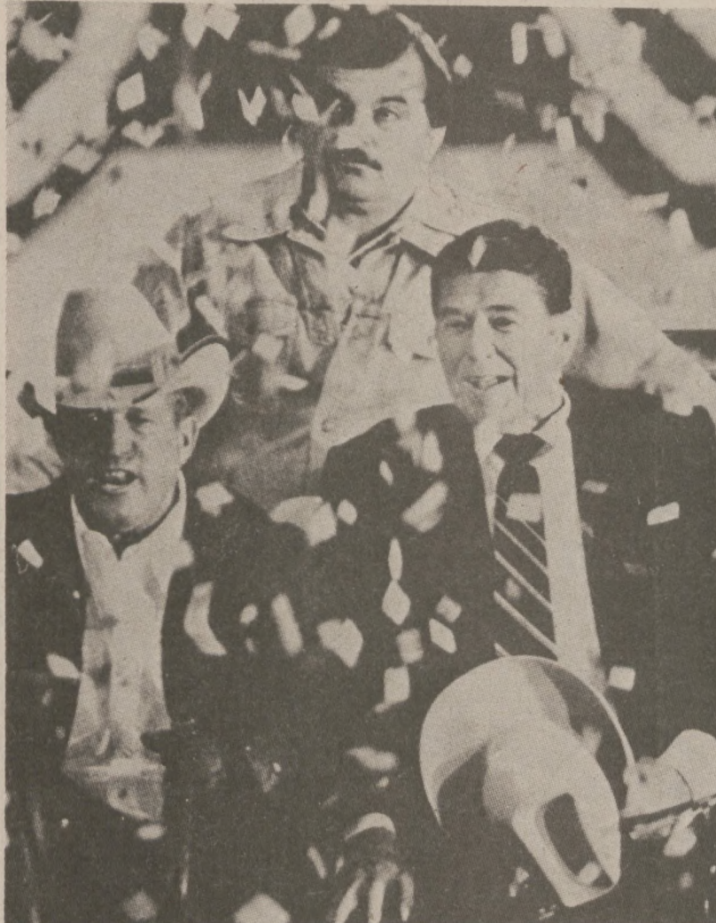
BILLINGS, MONT. — W uroczystościach jubileuszowych Billings, Montana wziął udział prezydent Ronald Reagan. Na zdjęciu, gdy wjeżdża na koźle dylżansu na arenę stadionu. Uroczystości odbywały się 11 sierpnia br.