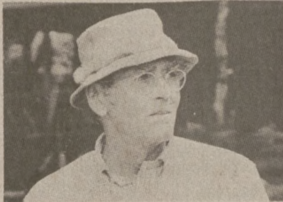
HOLLYWOOD. — 12 sierpnia br. zmarł znany aktor amerykański Henry Fonda. Na zdjęciu aktor w roli ojca, w ostatnim filmie za którego otrzymał "Oscara" p.t. "On Golden Pond".

Johannesburg (CT) — Władze Afryki Południowej twierdzą, że straty poniesione przez partyzantów, wynoszą w ciągu bieżącego tygodnia, co najmniej 314 zabitych. Wojska rządowe prowadzą na terenie południowej Angoli akcje oczyszczania terenów z partyzantów SWAPO.