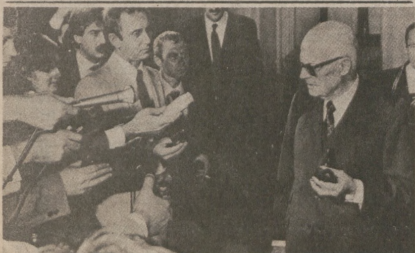
RZYM. — Prezydent Włoch Sandro Pertini zapewnił reporterów, że zrobi wszystko, aby zapobiec przedwczesnym wyborom. Najpierw rozpocznie rozmowy na temat utworzenia nowego rządu. (UPI)

Wiadomo, że codziennie ekipy miejskie odholowują z ulic i autostrad miasta od 25 do 50 samochodów.