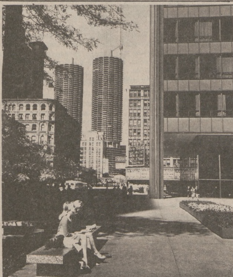
CHICAGO. — Ulica State w śródmieściu.

Schmidt, którego koalicja rozpadła się w dniu 17 września, oświadczył w poniedziałek, że w dalszym ciągu pragnie przeprowadzenia wyborów, jak najwcześniej.