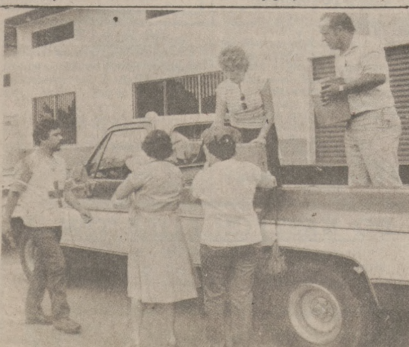
SAN PEDRO, HONDURAS, — Grupa osób wyladowuje z ciężarówki żywność, która zostanie dostarczona 82 zakładnikom.