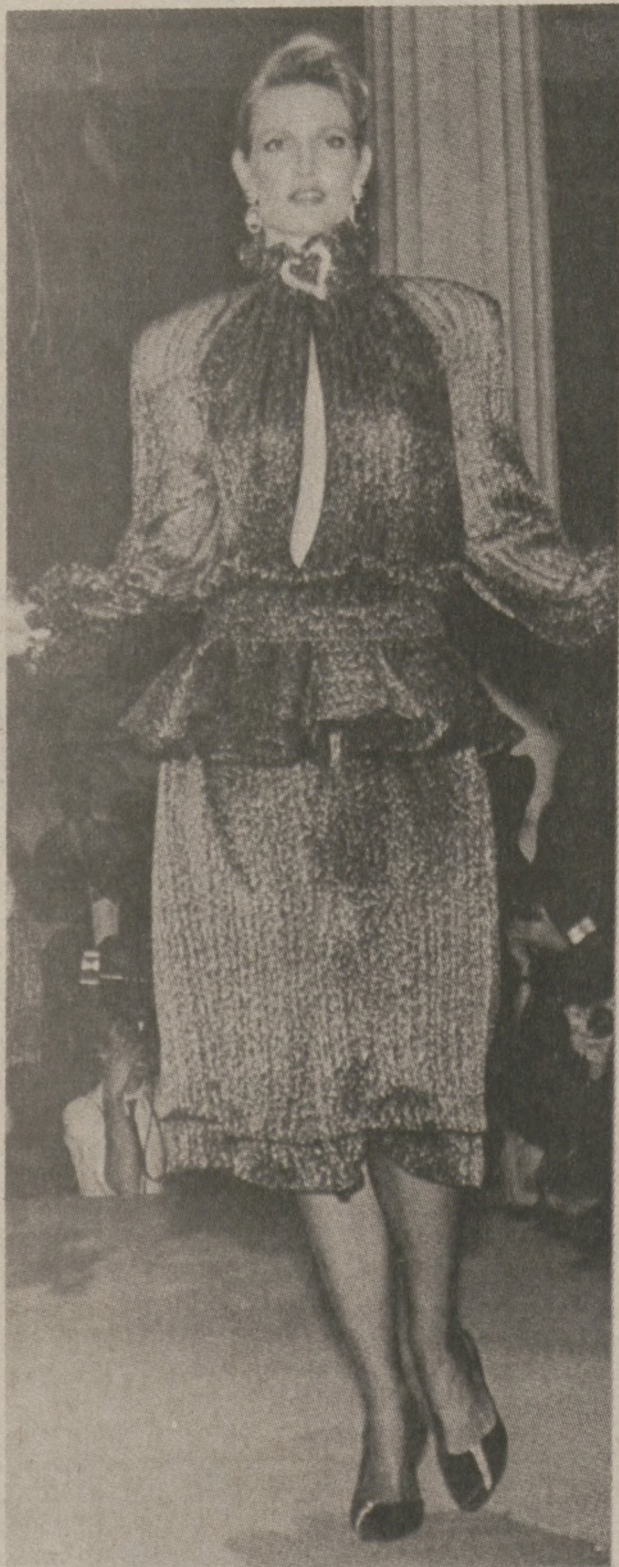
Jesienno-zimowa kolekcja znanego włoskiego projektanta mody, Valentino.