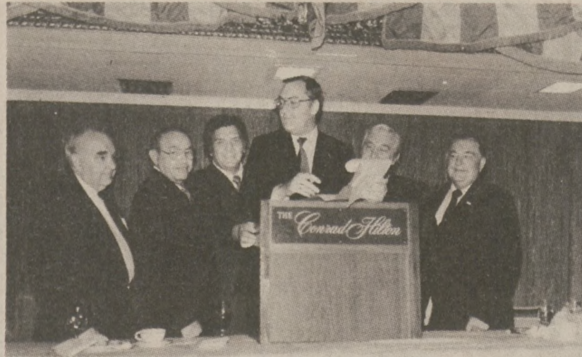
CHICAGO. — Gubernator Thompson podpisał ustawę przeciw dyskryminacji etnicznej.