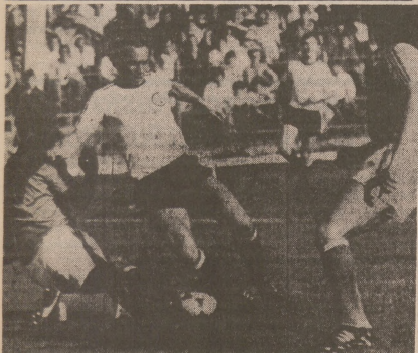
Byli zawodnik chorzowskiego Ruchu, obecnie występujący w Legii Warszawa, należał do wyróżniających się zawodników w meczu ze Śląskiem, wygranym przez Legię 1:0.

Miami (UPI) — McDonald wysunął oskarżenie przeciwko Burger King'owi żądając nie dopuszczenia do wyświetlania reklam zawierających "fałszywane i oszczerce informacje". Burger King nie zamierza rezygnować z reklamy, uparcie twierdząc, że jego hamburgery są przygotowywane dokładnie tak jak mówi reklama i że nie widzi w niej nic niewłaściwego jako, że pozostałe "hamburgerownie" faktycznie dają takie porcje jak sugeruje jego reklama.