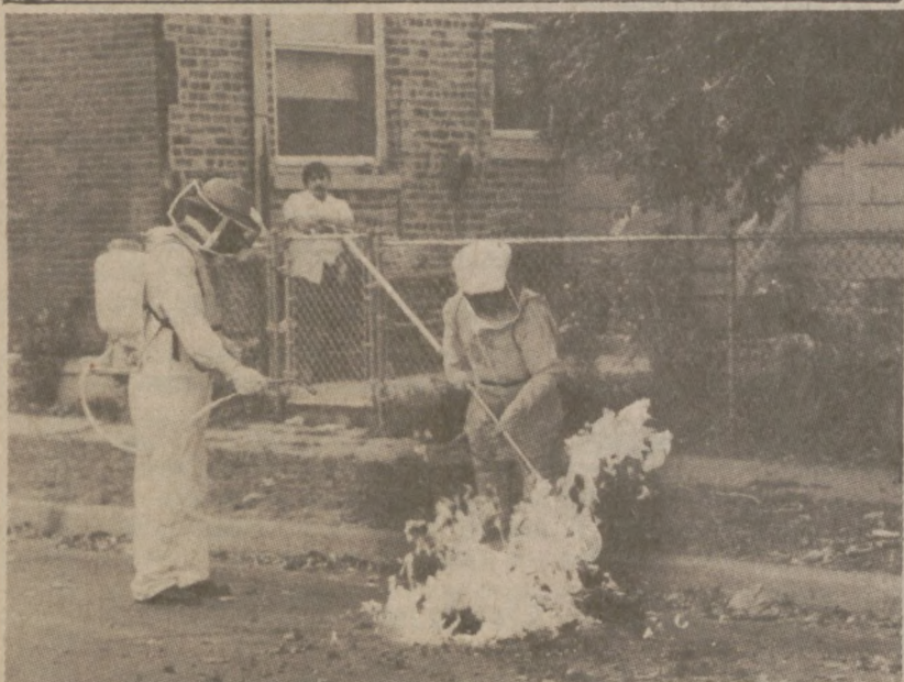
CHICAGO. — Specjalne ekipy Departamentu Ulic i Kanalizacji w akcji niszczenia gniazd os i szerszeni. Owady te pojawiły się w wielkich ilościach w różnych dzielnicach naszego miasta.

Oskarżeni kradli samochody w miejscowościach: Calumet City, Lansing, Glenwood, South Holland, Dolton oraz w okolicach Gary i Hammond.