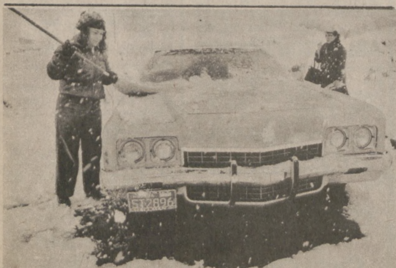
PLEASANT VALLEY, NEVADA. — 30 września spadł tu pierwszy śnieg. Spadło go stosunkowo dużo, bo 6 cali. Takiego śniegu, we wrześniu, nie notowano w tych okolicach od 1898 r.

Władze miejskie nie podejmą żadnej akcji, ażeby zabrać zbierania słodyczy przez dzieci w tym dniu oraz nie ograniczą godzin zbiórki.