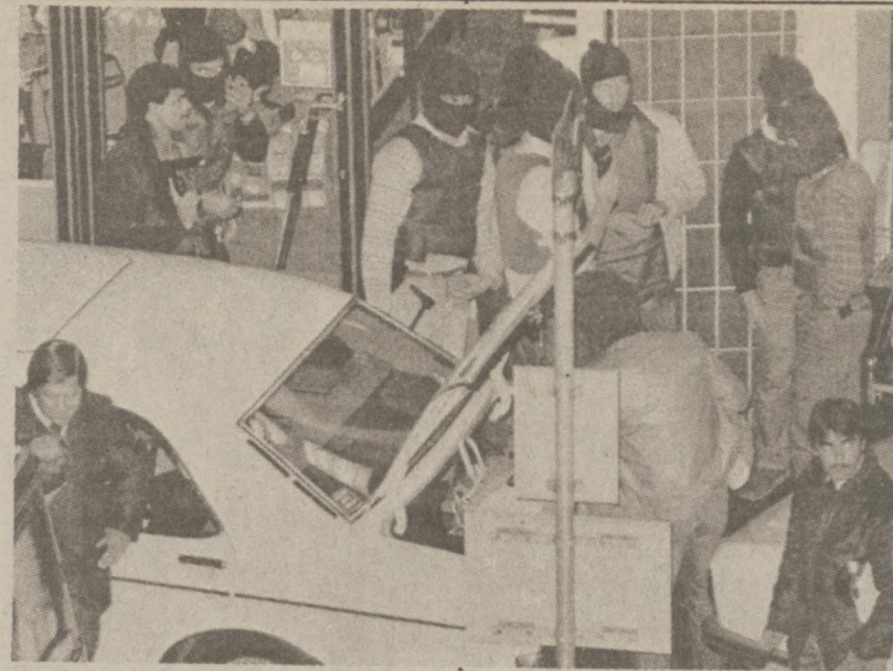
KOBLENZ, NIEMCY ZACHODNIE — Policja niemiecka przygotowała się do akcji oswożenia zakładników porwanych przez bandytę, który napadł na lokalny bank. Zdjęcie z 6 października br.

Zebrani odśpiewaniem "Sto lat" wyrazili swoją wdzięczność Ref-Renom za dekady pracy kulturalnej, podnoszenie na duchu i twardą ideową postawę.