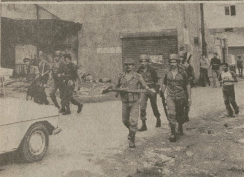
BEJRUT. — Oddziały armii libańskiej prowadzą poszukiwania składów amunicji oraz nielegalnych mieszkańców południowej części Bejrutu.

W sierpniu z tego samego piętra w celach samobójczych wyskoczył inny pacjent. Również w ubiegłym roku był wypadek, że pacjent wyskoczył z okna na 4 piętrze. Jak wykazało dochodzenie, wszystkie okna w budynku były odpowiednio zabezpieczone w myśl polecenia władz z marca tego roku. Wobec tego nie oskarżono kierownictwa zakładu o zaniedbanie.