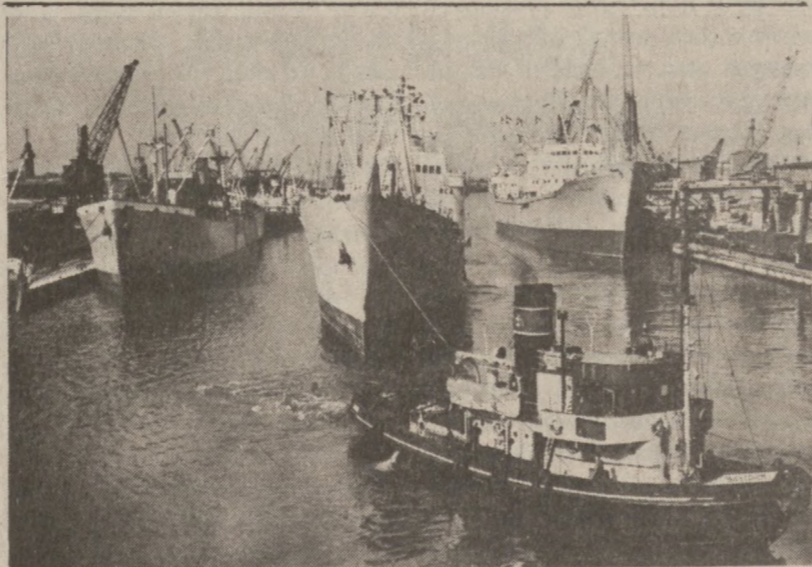
GDANSK. — Basen Władysława IV

Prezydent Hondurasu Roberto Suazo Cordova odrzucił propozycje Wenezueli i Meksyku o podjęciu rozmów z Nikaragą. Mimo to, meksykańscy dyplomaci oświadczyli, że nadal będą poszukiwać sposobów na doprowadzenie do pokojowych negocjacji między tymi państwami.