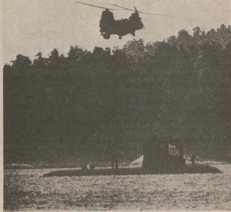
SZTOKHOLM — Szwedzka łódź podwodna "Seadog" blokuje przesyłki wodny, w akcji mającej na celu uchwycenie niezidentyfikowanej łodzi podwodnej, która znalazła się na wodach szwedzkich.

Sztuczna noga jest kontrolowana przez wewnętrzny mini-komputer, który przyjmując impulsy powoduje ruch nogi. Właściciel nogi może dzięki temu chodzić z minimalnym wysiłkiem.