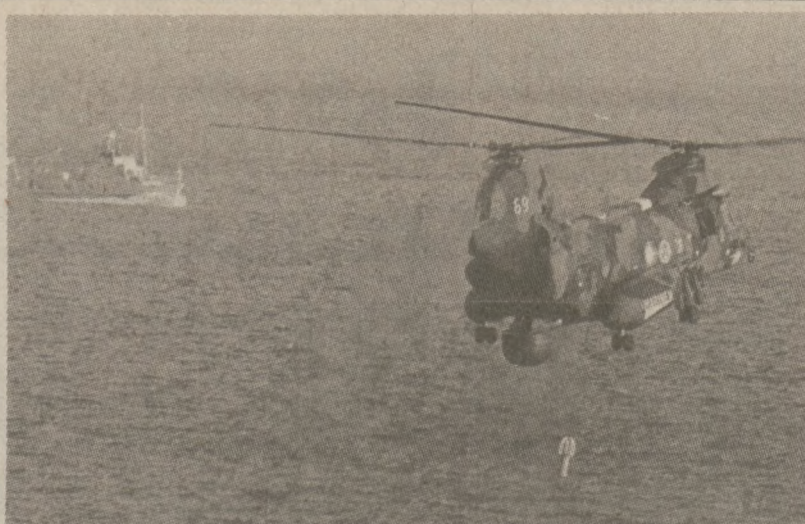
SZWECJA. — Helikopter szwedzkiej marynarki wojennej nasłuchuje odgłosów podwodnej łodzi obcej bandery w wodach w pobliżu bazy marynarki Muscoe.