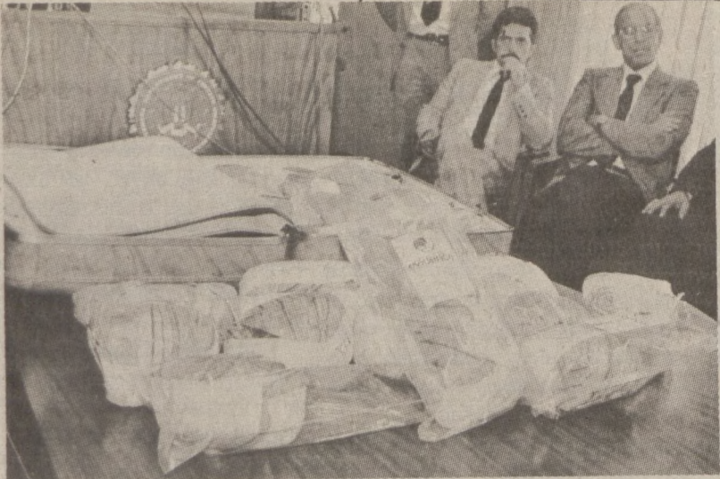
LOS ANGELES, Kalifornia — Na zdjęciu 20 kg. kokainy, skonfiskowanej na lotnisku Johnowi DeLoreanowi, byłemu pracownikowi General Motors, konstruktorowi samochodu, który nazwał swoim nazwiskiem: "DeLorean".