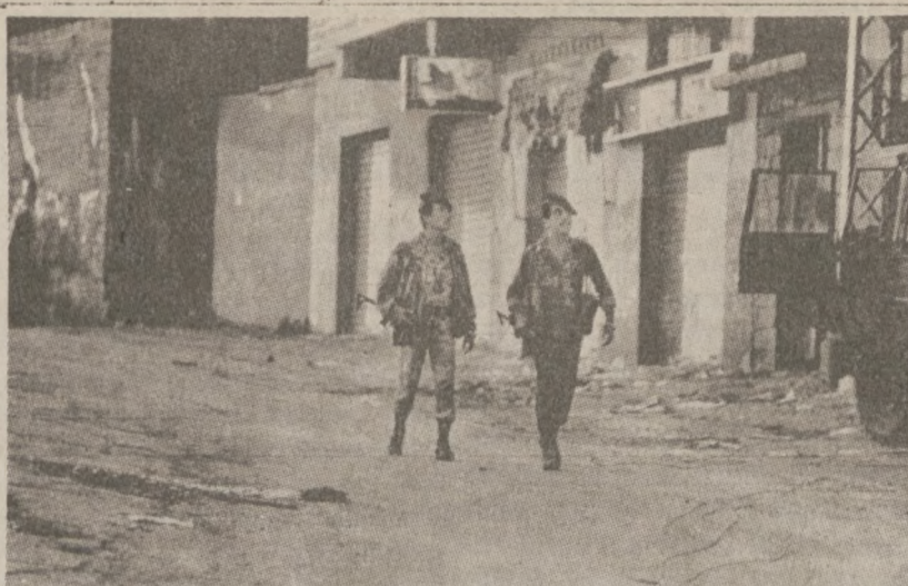
KFAR MATTA, LIBAN.—Patrol żołnierzy libańskich w wiosce, którą przejęto od żołnierzy izraelskich.

Część pamięci dzielnego i prawego Związkowca, Polaka gorliwego, bohatera spod Monte Cassino i żołnierza armii generała Andersa!