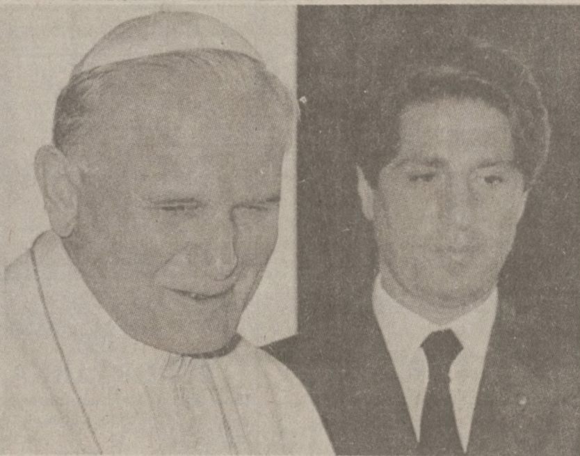
WATYKAN.—Prezydent Libanu Amin Gemayel i papież Jan Paweł II w czasie audiencji jaka odbyła się 21 października br.