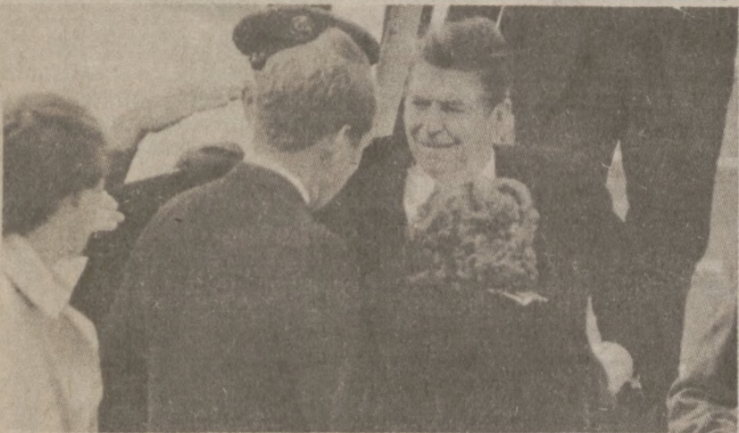
PEORIA, ILLINOIS.—Na lotnisku w Peorii powitał prez. Reagana mayor miasteczka, Richard Carver. Ponieważ było bardzo zimno, a Mayor przyszedł bez płaszcza, prez. Reagan starał się otulić go własnym. Prezydent był w Peoria 20 października br

Komitet finansowy rady miejskiej wystąpił z propozycją sprzedania za bytkowego domu Rookery za sumę $15.1 tml. Oczekuje się, że rada miejska zaaprobuje tę propozycję. W budynku tym mieści się Continental Illinois Bank & Trust Co. of Chicago. Continental jest pierwszym dzierżawcą tego domu. Dzierżawa została podpisana na 99 lat, i skończy się za 3 lata, w 1985 roku. Budynek liczy 96 lat. Nabywcą tego domu zostanie prawdopodobnie Continental Bank.