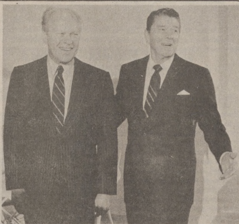
WASHINGTON — W poniedziałek 25 października prezydent Ronald Reagan spotkał się z byłym prezydentem Geraldem Fordem w Białym Domu. Na zdjęciu obaj prezydenci, w drodze do "Oval Office".

W przyszłym roku finansowy deficyt federalny może wzrosnąć do $175 mld. Rząd Reagana ujawnił te dane bez specjalnych komentarzy. Wiadomości tego typu mogą bowiem wpłynąć niekorzystnie na wyniki głosowania. Deficyt był najwyższym od czasów prez. Forda w 1976 roku, kiedy wynosił $66.4 mld. Prez. Jimmy Carter w styczniu 1981 roku na kilka dni przed odejściem z urzędu przedstawił Kongresowi propozycję deficytu wysokości $27.5 mld.