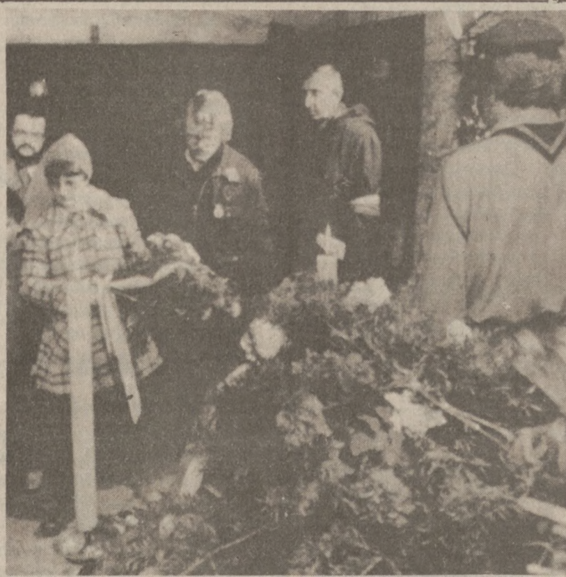
KRAKÓW. — Jeszcze rok temu uroczystości obchodzone w Polsce rocznicę odzyskania Niepodległości. Wielu obywateli składało wiązanki kwiatów na trumnie Marszałka Józefa Piłsudskiego w krypcie Katedry Wawelskiej. (UPI)

Kwatera izraelskiego gubernatora, wojskowego mieści się w mieście Tyr, położonym na wybrzeżu, w południowym Libanie. Wybuch miał miejsce o godzinie 1:45 rano czasu nowojorskiego.