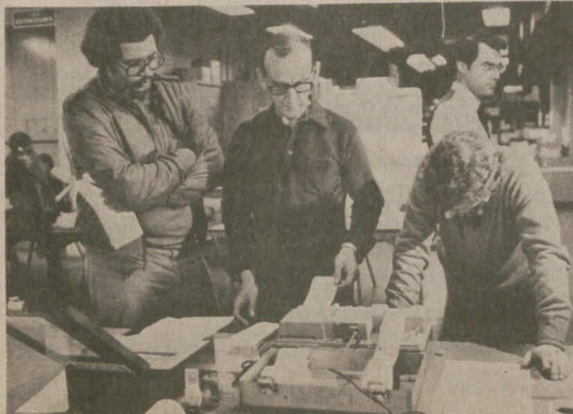
CHICAGO. — Sędziowie wyborów obliczają głosy złożone w wyborach 2 listopada.

Nad zebraniem powiewały liczne flagi "Solidarności" i flagi narodowe.