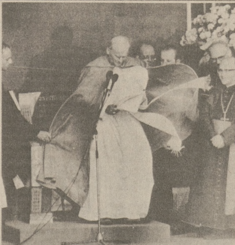
BARCELONA. — Ojciec Święty wygłasza kazanie w czasie Mszy św. odprowanej na górę, gdzie znajduje się klasztor. Silne wiatry rozwiewały szaty Dostojnego Pielgrzyma. Zdjęcie z 7 listopada br.

Sądzi się, że państwo Donahue zarobią nieźle pieniądze, ponieważ o posiadanie meteorytów ubiegają się prywatni kolekcjonerzy, muzea i instytuty naukowe.