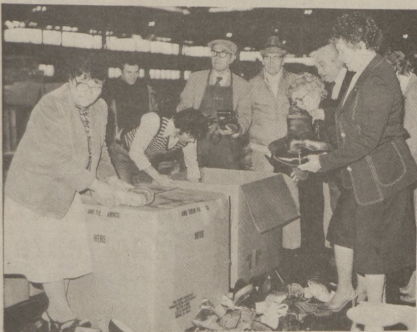
Najpierw trzeba sprawdzić, czy wszystkie buty mają parę. Powiązać je i dobrze ułożyć w kartonie.

Cenny par butów. Ochotnicy, działacze Wydziału Stanowego Kongresu Polonii Amerykańskiej i wielu innych organizacji poświęcili wiele godzin pracy (nadal pracują) przy sortowaniu i pakowaniu obuwia, przygotowując je na wysyłkę do Polski. Poniżej zdjęcia ilustrujące pracę ochotników.