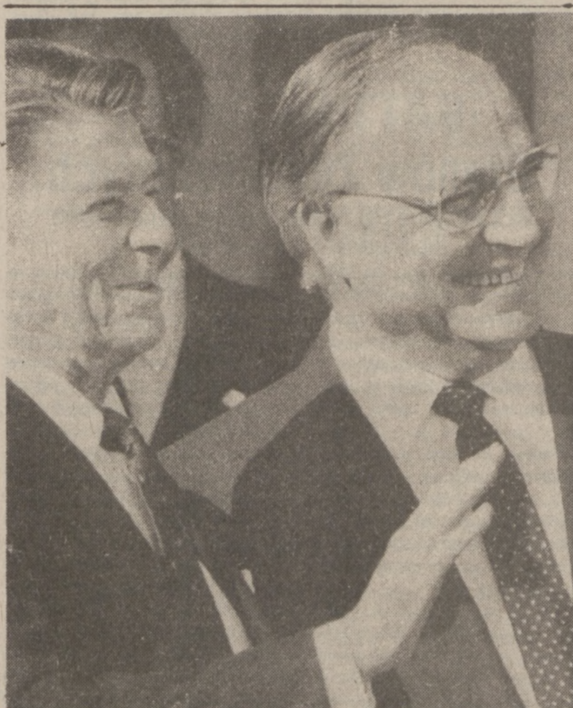
WASHINGTON — W poniedziałek, złożył wizytę prezydentowi Ronaldowi Reaganowi, kanclerz Niemiec Zachodnich Helmut Kohl.

Cena złota wzrosła o $2 w Londynie, $1 w Zurychu do $403.50 za uncję.