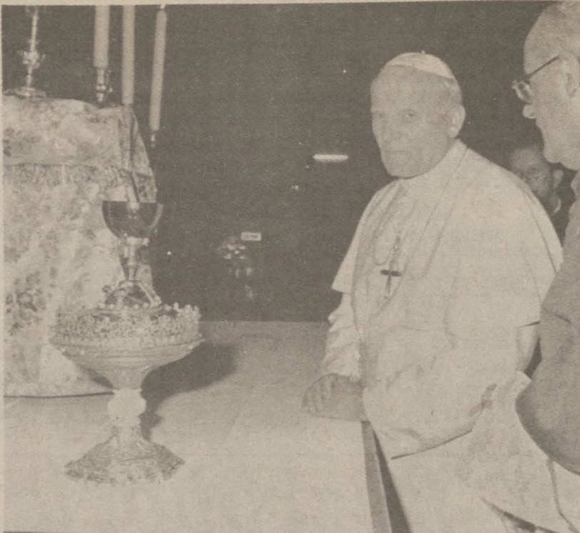
WALENCIA, HISPANIA.—Ojciec Święty ogląda Złoty Kielich znajdujący się w lokalnej katedrze. Kielich ten, jak głosi legenda, służył Panu Jezusowi w czasie Ostatniej Wieczerzy.

prosek do prania 31 lbs. — $27.00 łącznie z kosztem transportu PLEX LTD. (est. 1958) 23, Sherbrooke Rd. London SW6 7QJ England Wysyłamy również inne artykuły i lekarstwa. Cennik wysyłamy na żądanie.