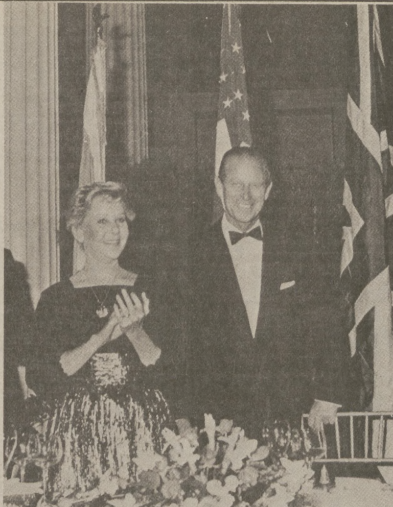
CHICAGO.— Mayor Jane Byrne i książę Filip w czasie przyjęcia, jakie odbyło się w Muzeum Field'a 8 listopada br.

Zapisujcie Działwę Waszą Do Wydziału Młodzież Z.N.P.