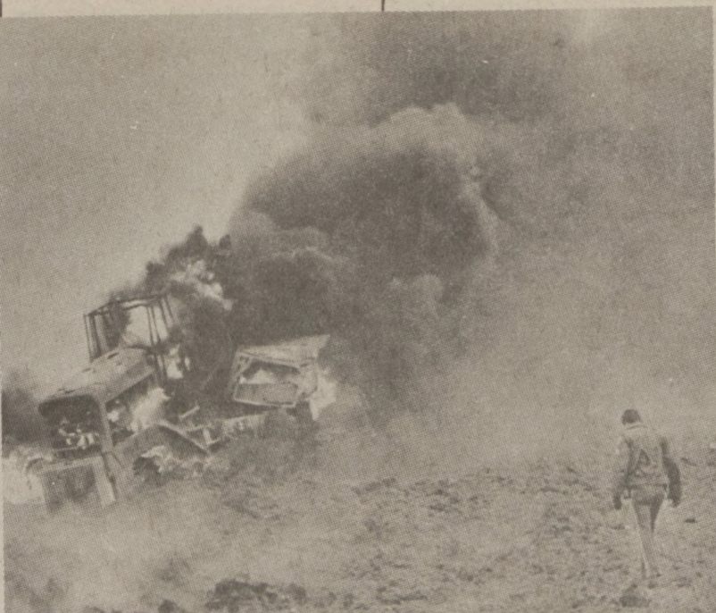
HUDSON, IOWA.—Zdjęcie tłących się szczątków samochodów zniszczonych w olbrzymiej eksplozji gazu ziemnego, w której zginęło 5 osób. Eksplozja nastąpiła 4 listopada br.

Łącznie na rynku powinno znaleźć się więcej miodu, przynajmniej ok. tysiąca ton, niż w ub. sezonie, tym bardziej, że spółdzielnie ogrodnicze i pszczelarskie gwarantują pszczelarzom odbiór całej ilości zebranego miodu. W zamian pszczelarze otrzymają ponad 37 tys. ton cukru, która to ilość powinna zaspokoić zimowe potrzeby dokarmiania pasiek w okresie zimowym.