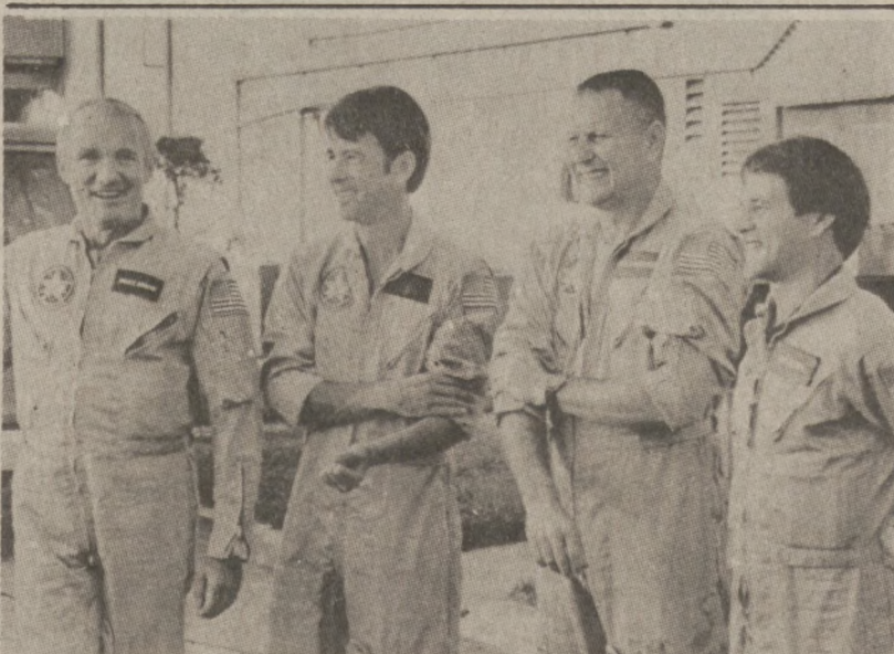
TEXAS — Czterech astronautów amerykańskich szczęśliwie zakończyło swą misję w przestworzach, wracając na ziemię wczoraj rano. Na zdjęciu ekipa “Columbii 5”, od lewej: komendant Vance Brand, William R. Lenoir, Robert Overmyer i Joseph P. Allen.

Większość wypowiedzianych przez Busha komentarzy, dotyczyła konfliktów w Afryce połudn. Bush podkreślił, że Stany Zjedn. nie posiadają — skierowanych ku Afryce — interesów militarnych, ani też kolonialnych.