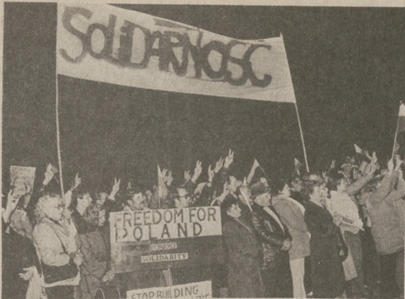
CHICAGO — Zdjęcie z demonstracji zorganizowanej przez Wydział Stanowy Kongresu Polonii Amerykańskiej w środę, 10 listopada, przed konsulatem PRL-u.

Jeśli chodzi o urządzenia dla inwalidów, to w okresie, gdy zamawiano autobusy obowiązywały one na podstawie przepisów federalnych. Obecnie przepisy te zostały odrzucone, stąd CTA wolało zrezygnować z urządzeń, aby zaoszczędzić pieniądze.