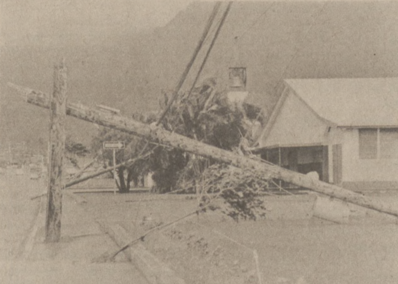
HONOLULU, HAWAJE. — Zdjęcie zniszczeń spowodowanych huraganem Iwa, jaki nawiedził wyspy Hawajskie 24 listopada br. (UPI)

Los Angeles (UPI) — Firma Rockwell International, która oskarżona jest o nadmierne rozdmuchanie kosztów robocizny — w związku z wyprodukowaniem wahadłowca kosmicznego, zgodziła się na zapłacenie rządowi federalnemu sumy $500,000 oraz na przeznaczenie kwoty miliona dolarów na usprawnienie swego systemu produkcyjnego, celem uniknięcia dalszych tego typu nadwyżek.