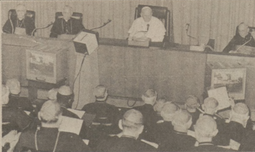
WATYKAN. — Papież Jan Paweł II w czasie konferencji kardynałów, jaka odbywała się w ubiegłym tygodniu. Od lewej, przy stole prezydyjnym siedzą: kardynałowie włoscy Giuseppe Siri i Carlo Confalonieri, Ojciec Święty, oraz watykański sekretarz stanu kard. Agostino Casaroli.

Sytuacja pracodawcy jest zrozumiała, nie chce zatrudniać elementu przestępczego, ale sprawa ta musi być zbalansowana. Policja chicagoska podaje, że corocznie 90,000 ludzi popada w konflikt z prawem, z tej liczby 30,000 to ludzie, którzy popadają w konflikt z prawem po raz pierwszy. Wobec tego corocznie trzeba będzie przygotowywać historię kryminalną dla 30,000 osób, które zostały aresztowane bez względu na to, jakie będzie orzeczenie sądu w tej sprawie.