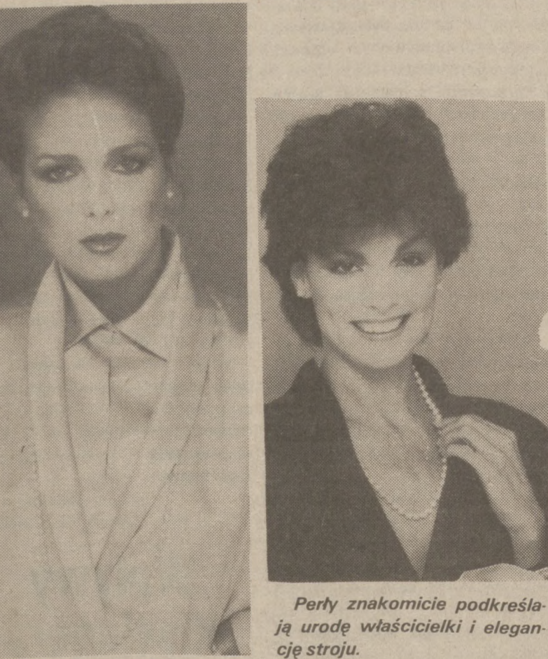
Perty znakomicie podkreślają urodę właścicielki i elegancję stroju.