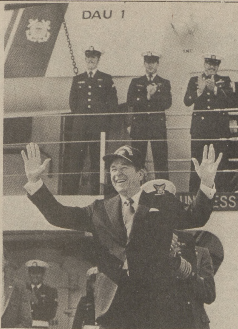
MIAMI. — Dwa tygodnie temu prezydent Ronald Reagan złożył wizytę marynarzom Straży Wybrzeża, na statku patrolowym Dauntless.

Yes! I want to see more crafts. send me your new 1983 NEEDLECRAFT CATALOG. 150 designs. 3 free patterns. Only $1.50 ALL CRAFT BOOKS. $2.00 each All Books and Catalog—add 50¢ each for postage and handling. 135-Dolls & Clothes On Parade 134-14 Quick Machine Quilts 133-Fashion Home Quilting 132-Quilt Originals 130-Sweater Fashions-Sizes 38-56 128-Envelope Patchwork Quilts 127-Afghans 'n' Dollies 125-Petal Quilts 124-Easy Gifts 'n' Ornaments 123-Stitch 'n' Patch Quilts 122-Stuff 'n' Puff Quilts 120-Crochet Your Wardrobe 119-Easy Art of Flower Crochet 116-Nifty Fifty Quilts 115-Easy Art of Ripple Crochet 113-Complete Gift Book 109-Sew + Knit(Basic tissue incl) 105-Instant Crochet 102-Museum Quilts 101-Quilt Book Collection 1