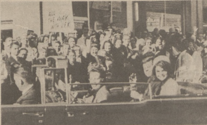
DALLAS, TEKSAS. — Zdjęcie zrobione na kilka minut przed zamachem na życie prezydenta Johna Kennedy'ego, 22 listopada 1963 r. W poniedziałek minęła 9 rocznica tego tragicznego dnia.