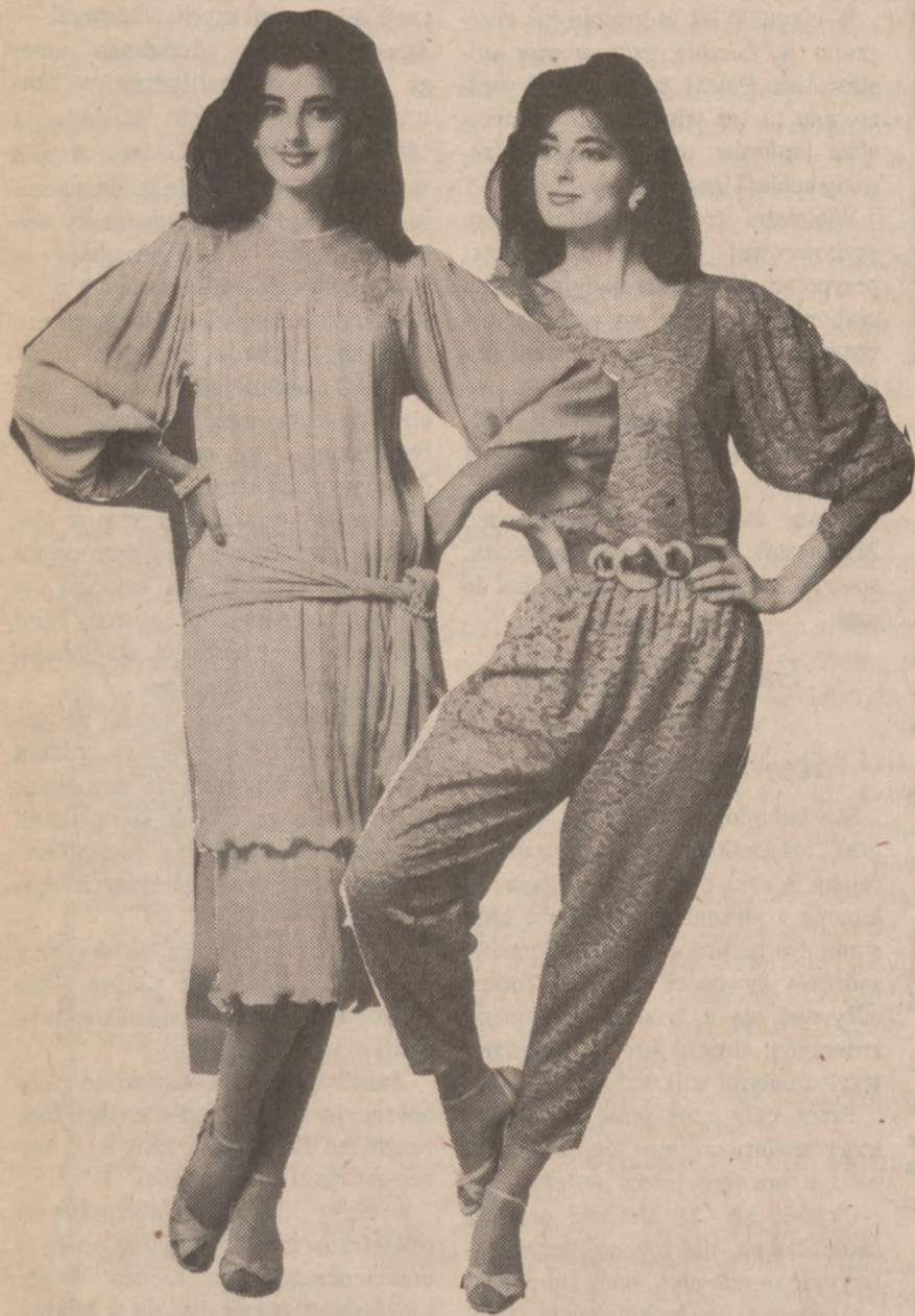
Suknia i "jump-suit" na świąteczne okazje. Projektowała Joan Wieseneck.