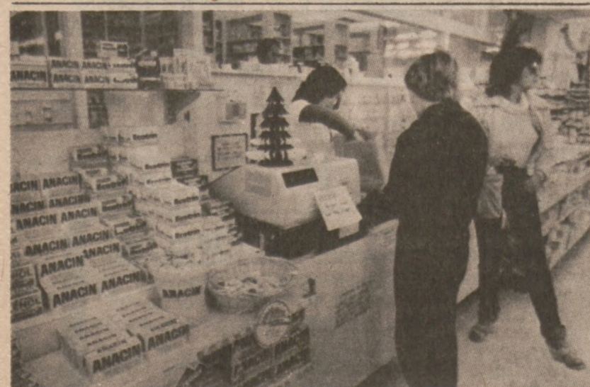
SAN JOSE, KALIFORNIA. — Z drogerii Longs Drug Store, gdzie kupiono zatrute cyjankiem lekarstwo Anacin III, wycofano je ze sprzedaży. Pozostawiono jednak inne rodzaje tego samego leku.