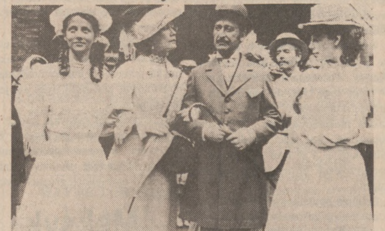
Zamożna rodzina pani Dulskiej

Barwny i pikantny film według noweli Gabrieli Zapolskiej "Moralność pani Dulskiej" będzie miał premierę w kinie Milford w sobotę i niedzielę — 25 i 26 grudnia — po 4 seanse o 12:30 — 3:30 — 6:30 i 9:30 wieczorem. Nastpne dni tylko po dwa seanse o 6:30 oraz 9:30 wieczorem.