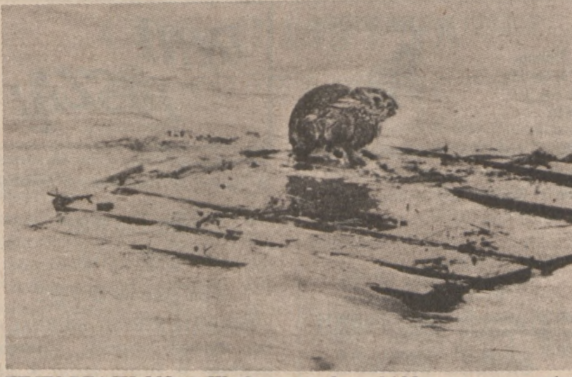
TIMES BEACH, MO. — Wezbrane wody rzeki Meramec porywają po drodze wszystko, nawet biednego królika, który ratując się wskoczył na pływające drzewo.