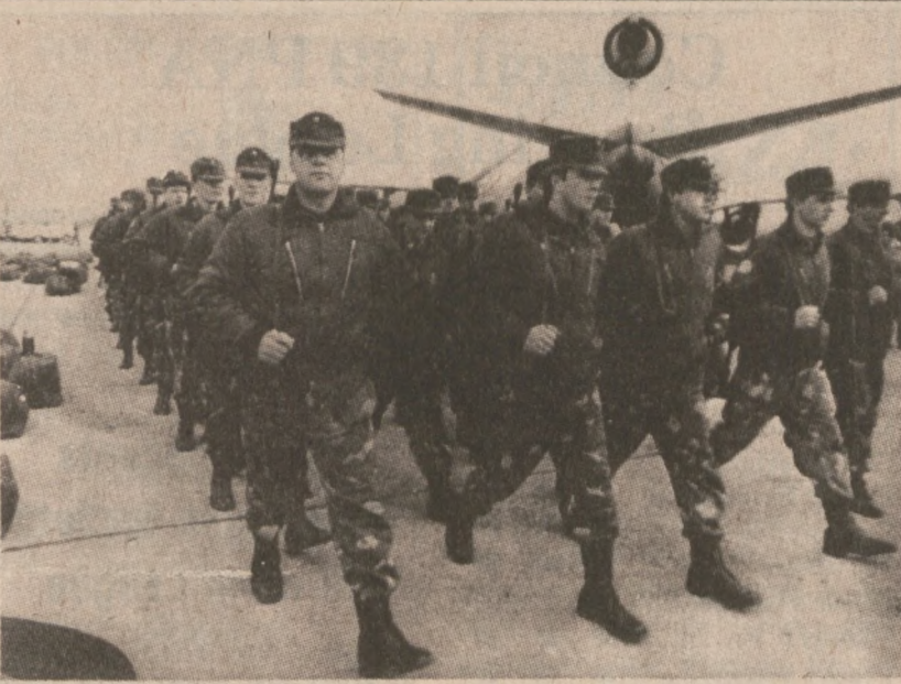
BEJRUT. — Żołnierze fińscy maszerują na lotnisku libańskim. Są oni częścią międzynarodowych sił militarnych przysłanych do Libanu. (UPI)

Livermore, Calif. (UPI) — Naukowcy podejrzewają istnienie rzek pod lodową powierzchnią na niektórych księżycach systemu solarnego, zwłaszcza na trzech księżycach Jupitera: Europie, Ganymede i Callisto. Sądzi się, że pod grubymi warstwami lodu znajdują się znacznie cieplejsze podstawy skalne.