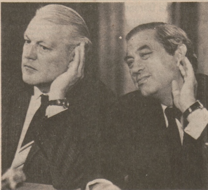
KRONBERG, NIEMCY ZACHODNIE. — Minister finansów Niemiec Zachodnich Gerhard Stoltenberg (po lewej) oraz prezes Bundesbank Karl Otto Poehl, w czasie konferencji ministrów finansów państw: Stanów Zjednoczonych, Wielkiej Brytanii, Francji, Japonii i Niemiec Zachodnich, jaka odbyła się 10 grudnia.

Zdaniem sekretarza stanowego, silna i zdecydowana postawa społeczeństwa pozwoli na zatwierdzenie przez Legislaturę proponowanej ustawy. Nowe przepisy zobowiążą sędziów do wyznaczania znacznie surowszych, niż dotychczas kar.