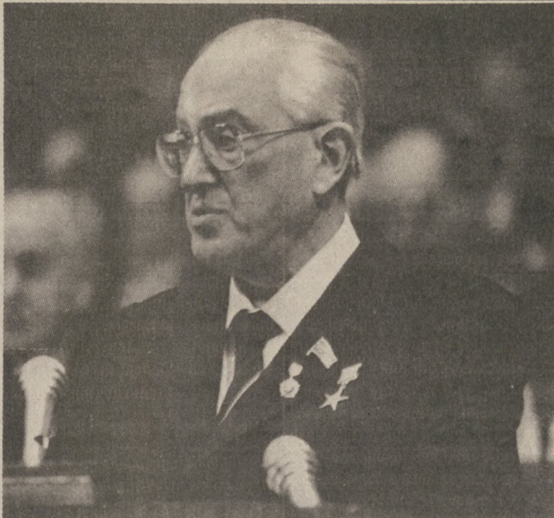
MOSKWA.—Sekretarz Generalny KC Jurij Andropow przemawia w czasie uroczystości 60 rocznicy powstania państwa sowieckiego.

Obecnie z powodu głębokiej recesji liczba zatrudnionych spadła do około 99 mln. Ekonomisci przewidują, że ze względu na spadek urodzin po powojennym "boomie" z czasem liczba poszukujących pracę zmniejszy się. Nie nastąpi to jednak w przyszłym roku. Sądzi się również, że liczba robotników zostanie ograniczona po zmodernizowaniu i wprowadzeniu nowoczesniejszych zautomatyzowanych urządzeń w miejsce obsługiwanych przez ludzi.