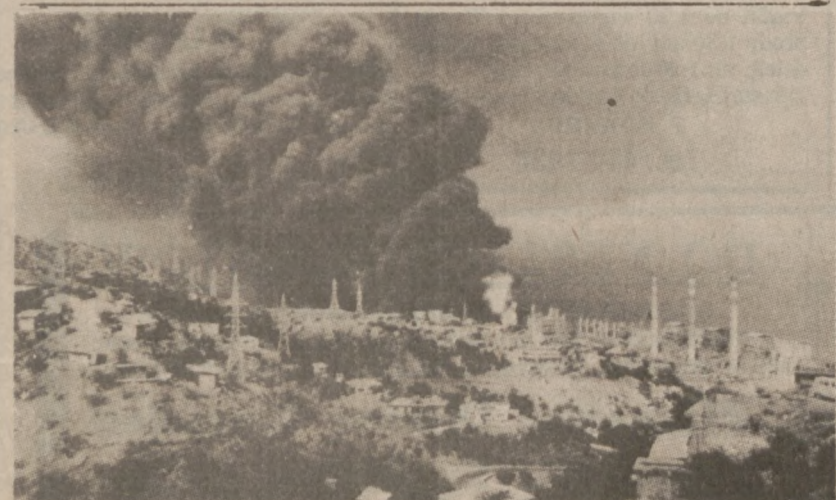
KARAKAS, WENEZUELA.—Widok olbrzymiego pożaru, jaki wybuchł w elektrowni Tacora. Trzeba było ewakuować okolicznych mieszkańców. Zdjęcie z 20 grudnia br. (UPI)

Właściciel muzeum choinek, które znajduje się w pobliżu West Chicago został zmuszony przez władze do zamknięcia muzeum w dniu Bożego Narodzenia. Około 150 chętnych do zwiedzania, z różnych stanów musiało zrezygnować z możliwości obejrzenia wystawy. Władze wydały takie zarządzenie z powodu protestu okolicznych mieszkańców, którzy stwierdzają, że tego rodzaju byznes jest niedozwolony w okręgu rezydencyjnym. Właściciel muzeum stwierdził, że przynosi ono dochód około $1 mln rocznie oraz pomaga okolicznym właścicielom restauracji w uzyskaniu dużych dochodów.