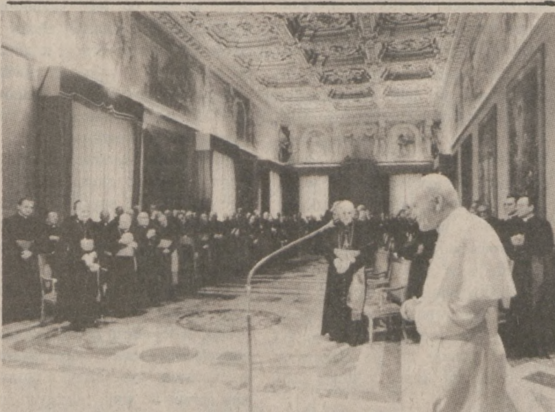
WATYKAN. — Papież Jan Paweł II wchodzi do sali Consistorial Hall, aby złożyć zebranym w niej Kardynałom życzenia świąteczne. Zdjęcie z 23 grudnia br.

W kilku stanach notowane są powoździe. Co najmniej 1,400 osób zostało zmuszonych do opuszczenia swych domostw i łóżek szpitalnych w rejonie Zatoki Meksykańskiej. Władze Czerwonego Krzyża oceniły, że powoździe oraz tornada zmusiły 900 osób do opuszczenia domostw w Arkansas. 500 osób pozostało bez dachu nad głową w Luizjanie.