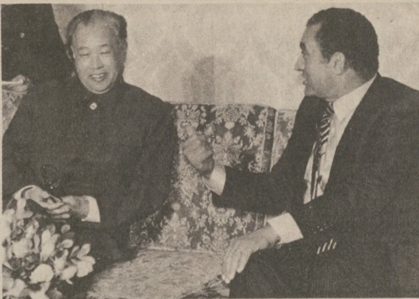
KAIR.—Prezydent Egiptu Hosni Mubarak (po prawej), w rozmowie z premierem Chin Zhao Ziyang. Premier chiński złożył oficjalną wizytę Egiptowi 20 grudnia br.