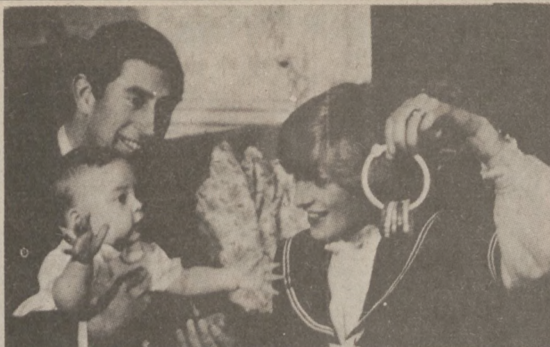
LONDYN.— Księżę i Księżna Walii — Karol i Diana, z sześciomiesięcznym synkiem, księciem Williamem.

Przypuszczalnie na początku następnego roku federalna EPA ogłosi listę powiatów, na które zostaną nałożone sankcje. Powiaty te będą mogły przedstawić swoją ewidencję o obecnym stanie zanieczyszczenia jako obronę. Na czołowym miejscu na liście znajdują się prawdopodobnie stany środkowego zachodu jak Minnesota, Wisconsin, Indiana, Michigan, Ohio i Illinois. Powiaty tych stanów są bardziej "zanieczyszczone" jak gdzie indziej na terenie kraju.