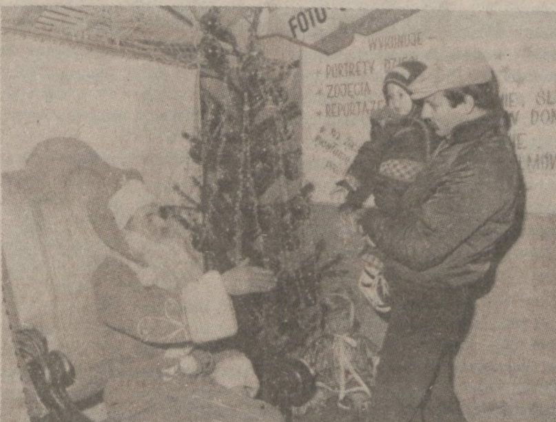
WARSZAWA. — Jedną z większych atrakcji w sklepie z konfekcją dziecięcą, było naturalnie spotkanie ze św. Mikołajem.

W czasie przeszukania ujawniono i zakwestionowano m.in. powielacz offsetowy prod. RFN, około 16,000 egzemplarzy nielegalnych wydawnictw, matryce, farby drukarskie, papier, schematy budowy radiostacji i ręczny miotacz gazowy. Śledztwo w toku.