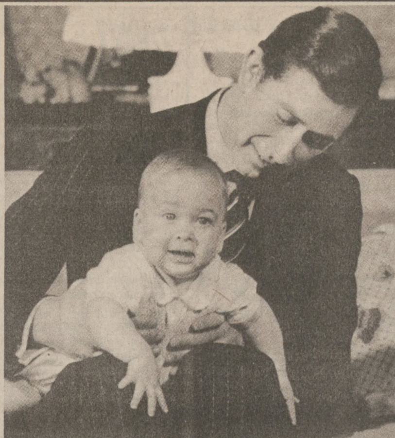
LONDYN. — Dumny tata z synem — księżę Karol z księciem Williamem.