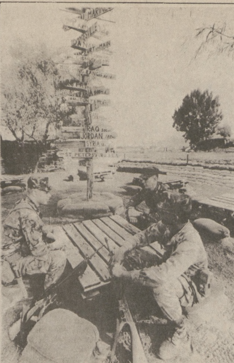
BEJRUT. — Amerykańscy żołnierze niedaleko bazy w okolicach Bejrutu.

Matka dziecka stwierdziła, że przez pół roku nie wiedziała gdzie jej dziecko się znajduje, wydała $100.000 na poszukiwania go. Wynajęła prywatnych detektywów, którzy szukali go po całym Iranie. Dopiero wróżka w Iranie powiedziała, że dziecko jest na terenie Stanów. Zatelefonowała wtedy do brata swego byłego męża w Chicago i przypadkowo jej były mąż odebrał telefon.