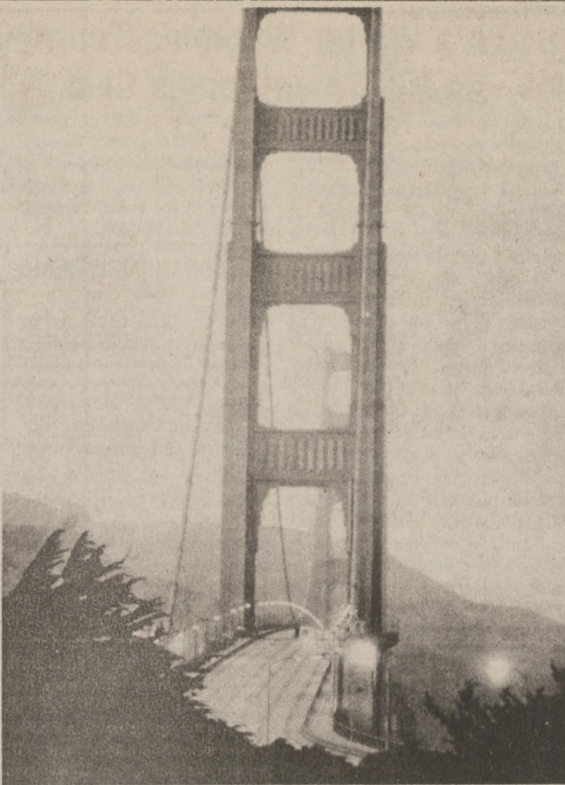
SAN FRANCISCO. — Olbrzymie sztormy jakie nawiedziły Kalifornię, zmusiły nawet władze do zamknięcia na jakiś czas mostu wiszącego Golden Gate Bridge, ponieważ porywiste wiatry "huštały" mostem. Odchylenie dochodziło do 5 stóp.

Wizyta brytyjskiej pary królewskiej odbędzie się w dniach 26 lutego-7 marca. Królowa Elżbieta oraz książę Filip odwiedzą pp. Reagan w czasie, gdy Prezydent oraz Nancy Reagan, będą obchodzić swą 31 rocznicę małżeństwa. Dzień ten — 4 marca — spędzą wraz z brytyjską parą królewską na jachcie "Britannia."