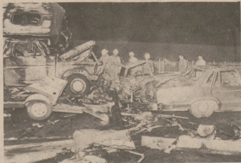
LOS ANGELES. — Akcja oczyszczania miejsca kraksy samochodowej, jaka wydarzyła się tutaj 28 grudnia. W wyniku zderzenia się trzech samochodów zginęły trzy osoby, kilka innych odniosło obrażenia.