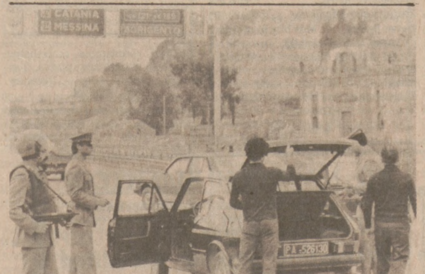
PALERMO, SYCYLIA. — Patrole policyjne sprawdzają samochody, w związku z siedmioma morderstwami jakie popełniono w Palermo. Jak przypuszczają władze, były to morderstwa związane z walką rywalizujących klanów podziemnej Mafii. (UPI)

Program polega na tym, że dodatkowe patrole policyjne mają tylko za zadanie pilnowanie kierowców, którzy wykazują "nieprawidłowości" w kierowaniu samochodem. Program ten jest częściowo finansowany przez National Highway Traffic Safety Administration.