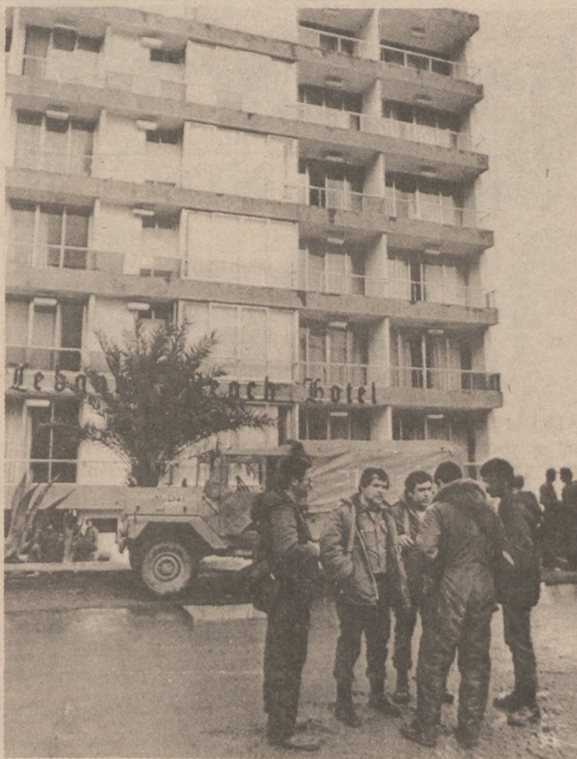
KHALDE. — Grupa izraelskich żołnierzy pilnuje wejścia do hotelu Lebanon Beach, gdzie odbywają się rozmowy pomiędzy przedstawicielami Izraela i Libanu na temat wycofania wojsk.

W sumie więc: jeżeli ktoś od lat kąpie się "we wrzątku" i czuje się po tej ablucji zdrowo, może to śmiało robić nadal. Jeśli ktoś chciałby dopiero zacząć, albo gdy zachęcenie reklamą sauny mamy ochotę spróbować jej uroków — najpierw poradźmy się lekarza.