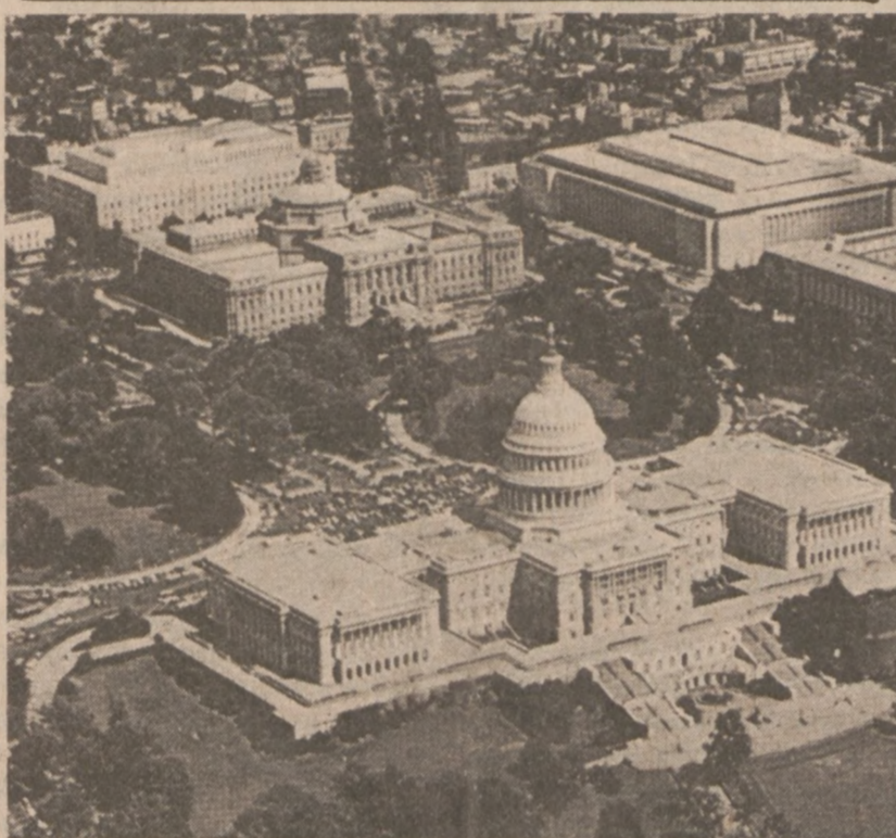
WASHINGTON. — Kapitol (siedziba Kongresu US).

Cena złota zarówno w Zurichu, jak i w Londynie wyniosła $451.50 za uncję.